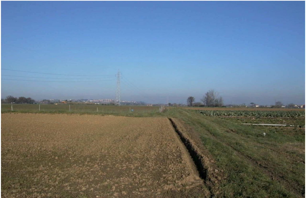
Situazione ANTE OPERAM