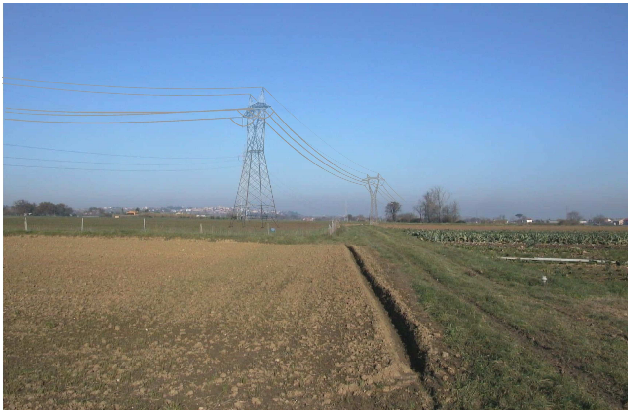
Rappresentazione POST OPERAM