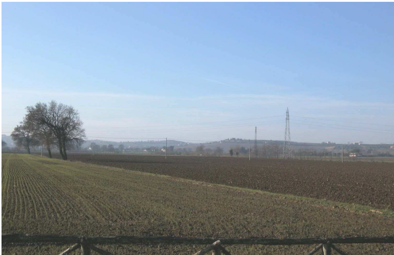
Situazione ANTE OPERAM