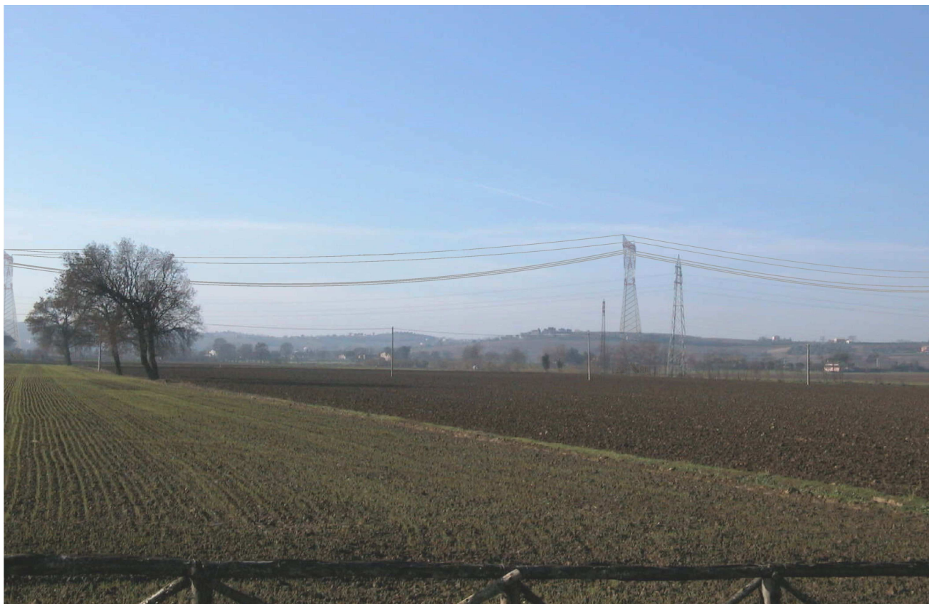
Rappresentazione POST OPERAM