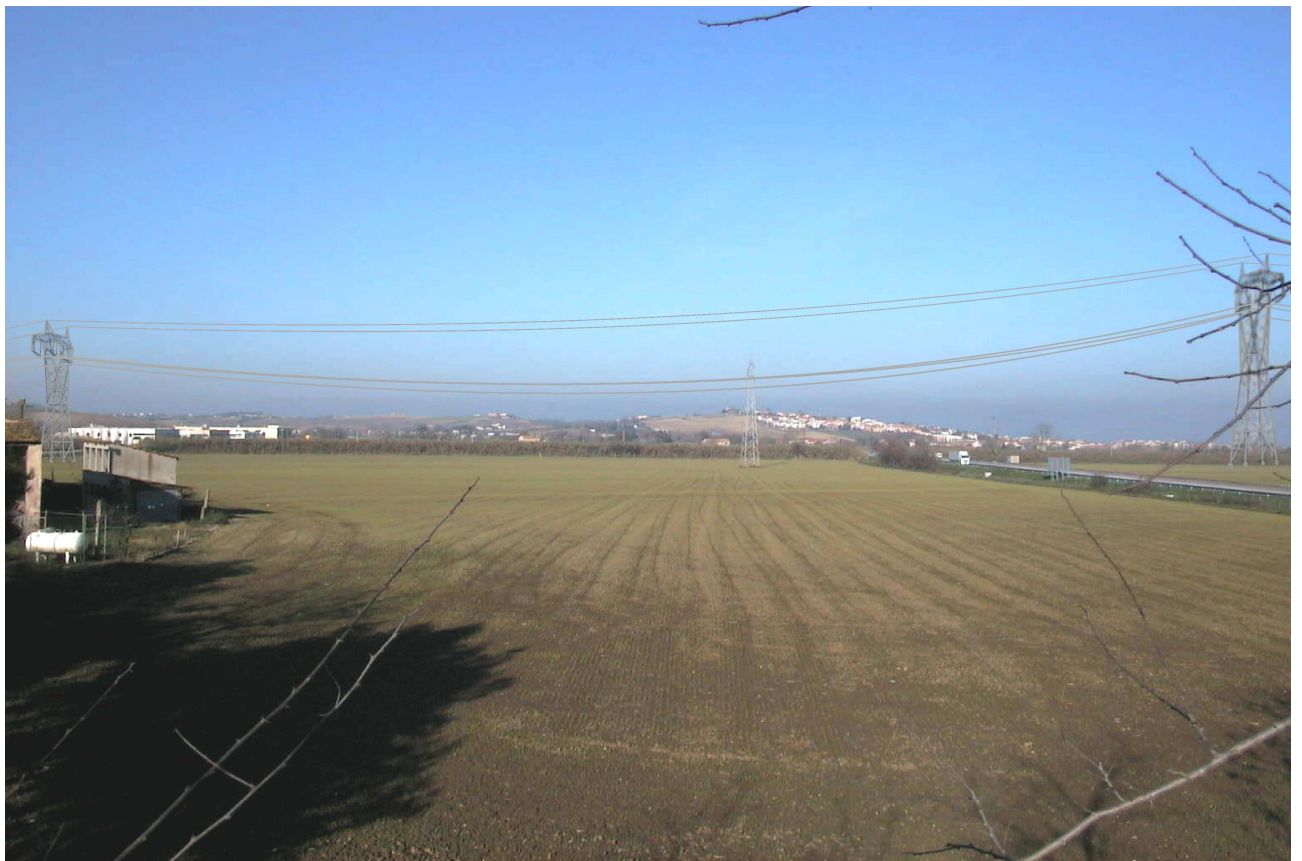
Rappresentazione POST OPERAM