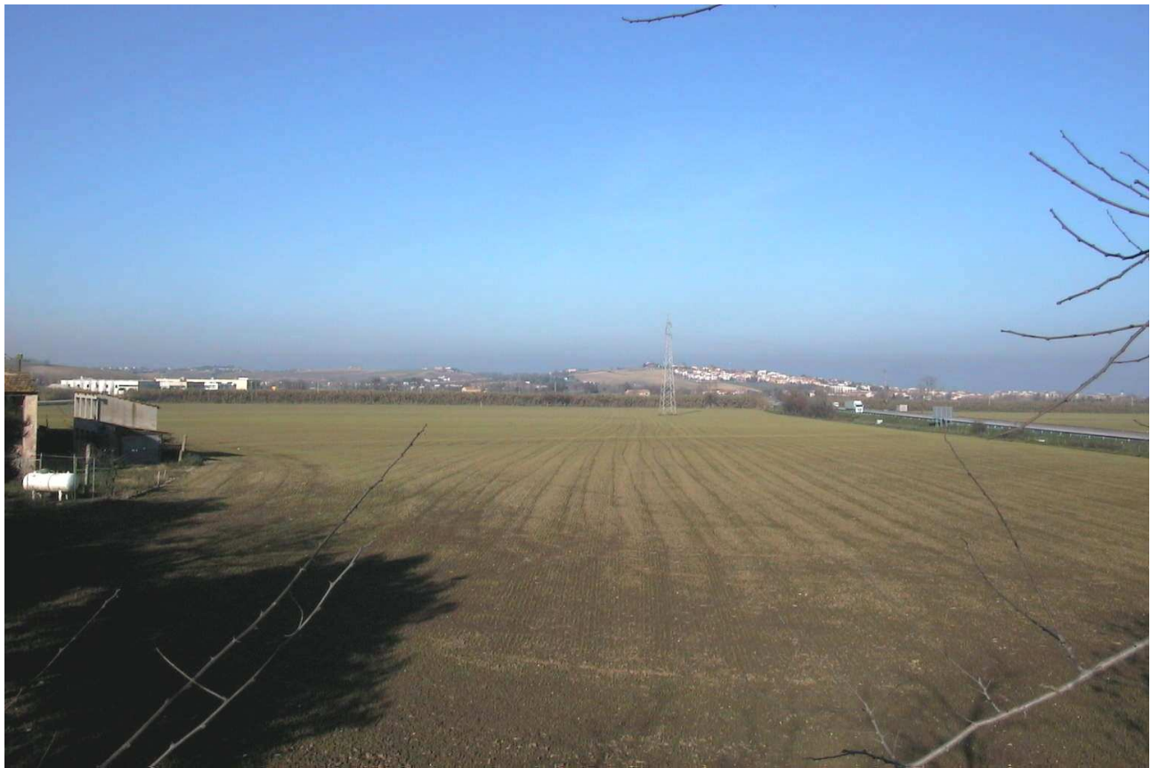
Situazione ANTE OPERAM