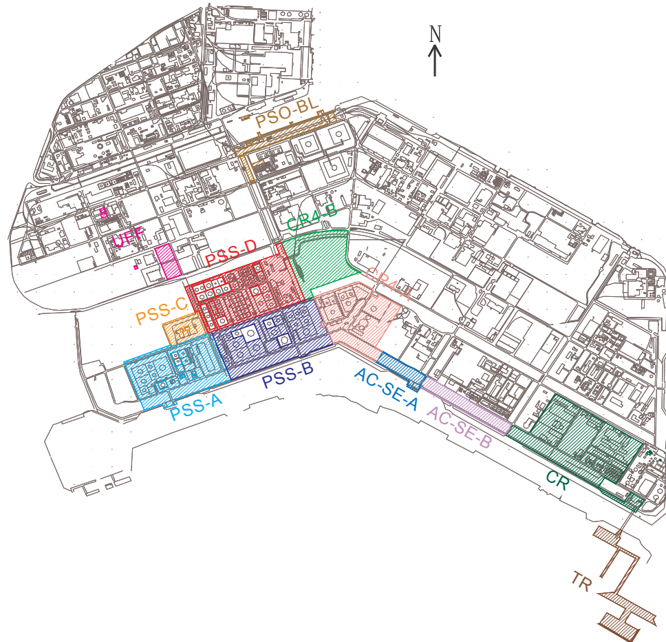
Fig. 2.1/A –Aree di proprietà Polimeri Europa interne al Petrolchimico

Morfologicamente l'area del Nuovo Petrolchimico si presenta regolare e generalmente pianeggiante, con quote topografiche variabili da ca. -0,5 m a ca. 4,5 m s.l.m..