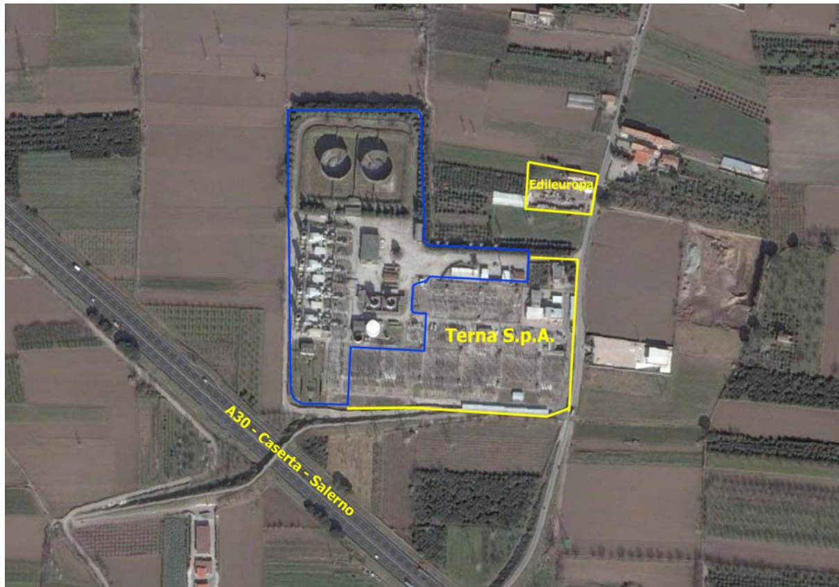
Figura 2: ubicazione del sito e delle attività confinanti

Questa disposizione delle proprietà confinanti è illustrata nella figura seguente.