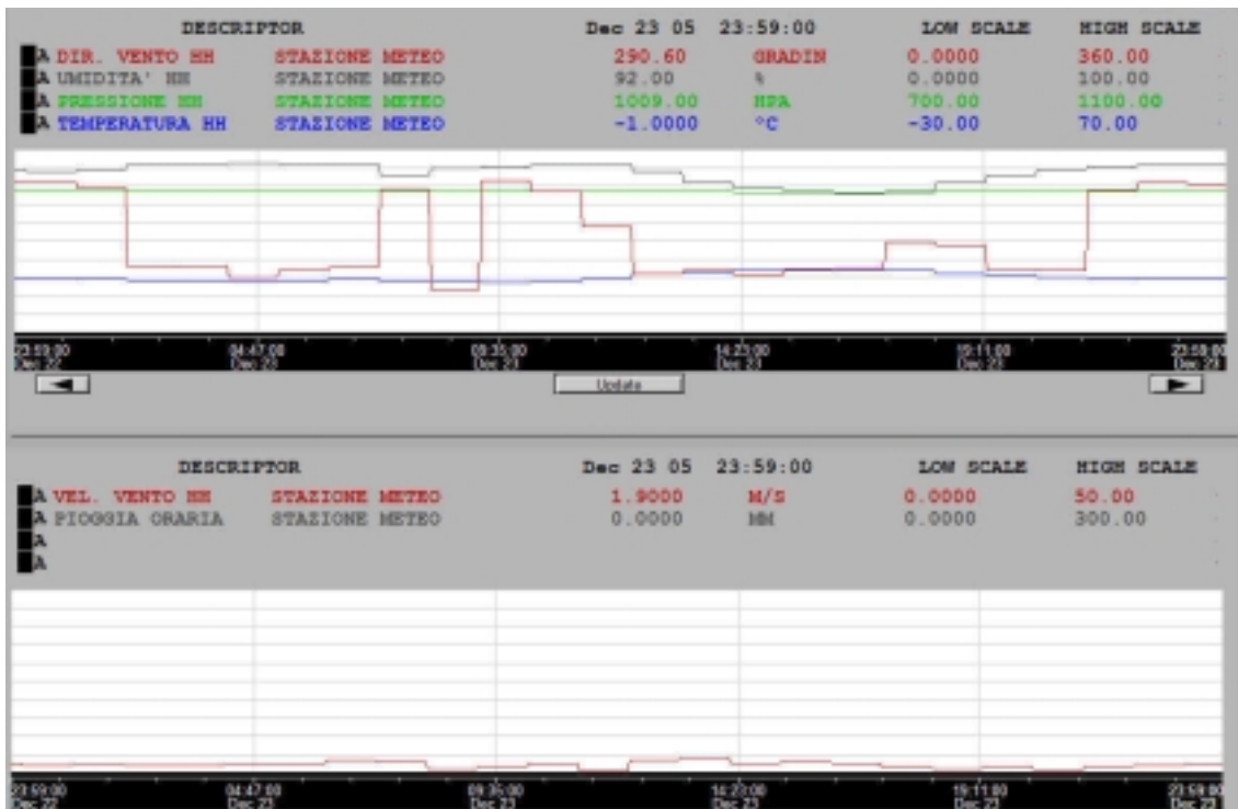
Figura 3. Condizioni meteo del 23 dicembre 2005.