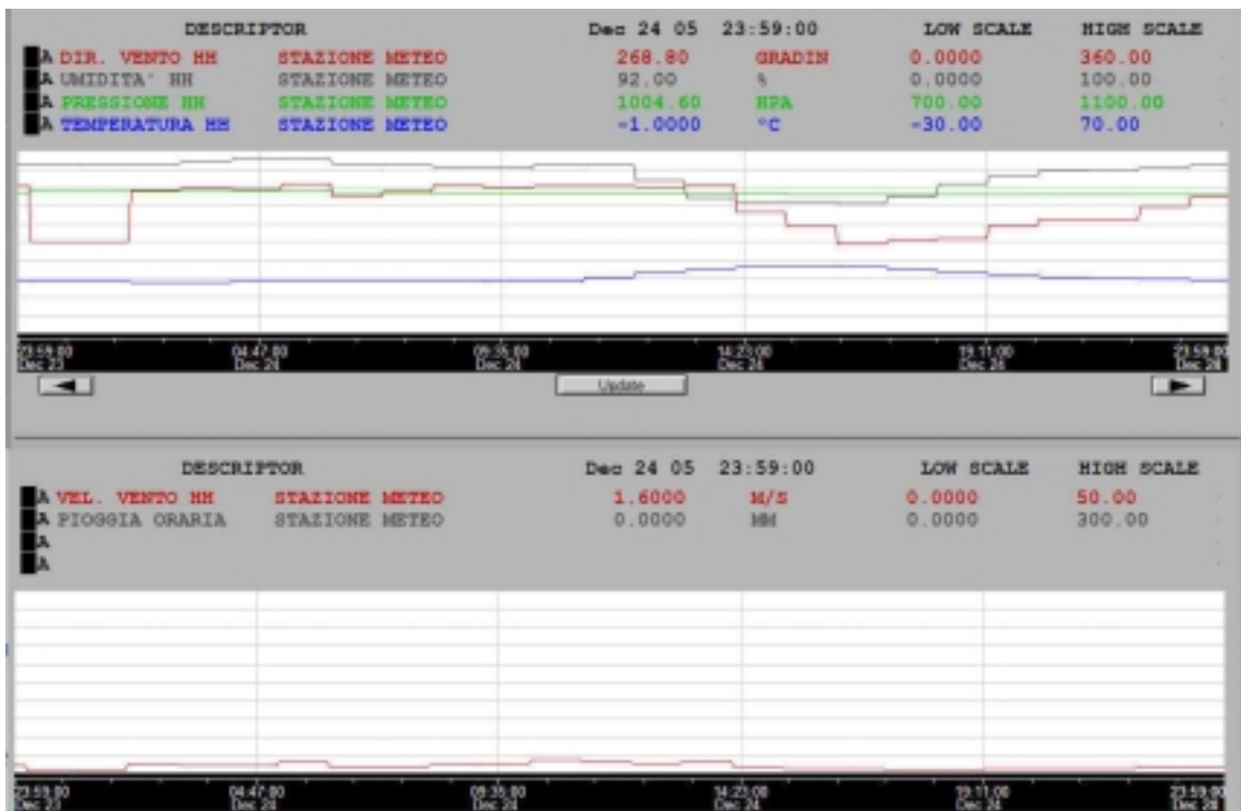
Figura 4. Condizioni meteo del 24 dicembre 2005.