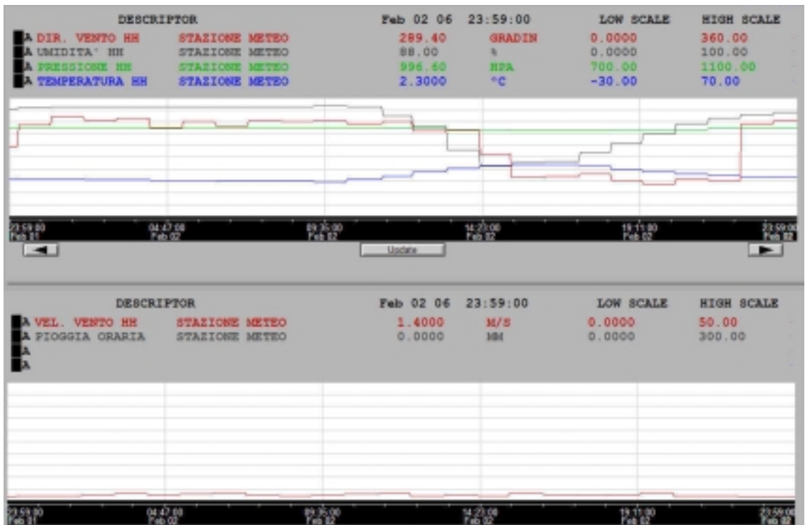
Figura 5. Condizioni meteo del 2 febbraio 2006.