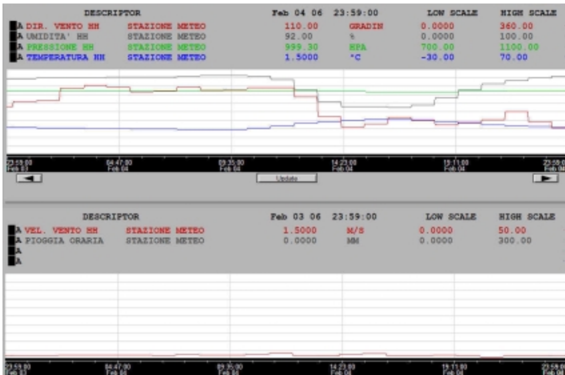
Figura 7. Condizioni meteo del 4 febbraio 2006.