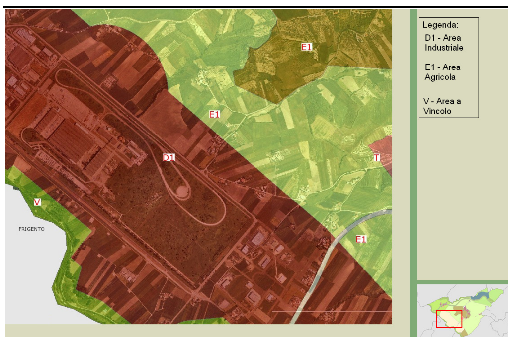
Figura A24 2.1a Classificazione del Sito Prevista dal PRG

Le aree limitrofe sono classificate come Area-E1 – Area a Destinazione Agricola .