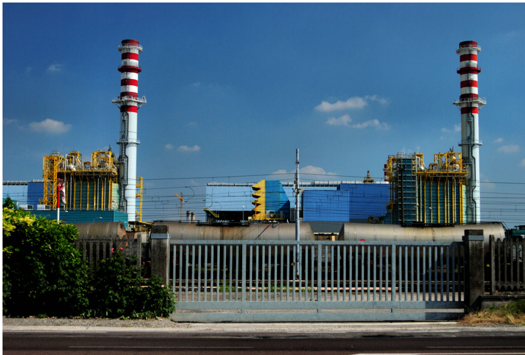
Figura 3-2: Fotosimulazione situazione post-operam