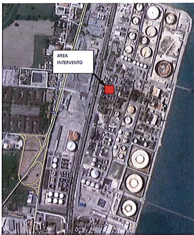
Figura 1: Inquadramento territoriale

In particolare l'area oggetto della modifica è posta tra la linea ferroviaria e il mare come si evince dalla figura 1.