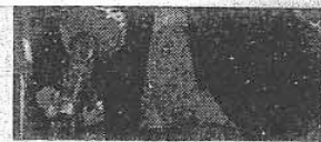
Il senatore Dell'Utri

La vicenda giudiziaria è complessa e intricata, ma alla luce di questa sentenza l'ombra del sospetto coinvolge solo i due pentiti coincadagati con il parlamentare: la posizione di Cirfeta è stata chiusa