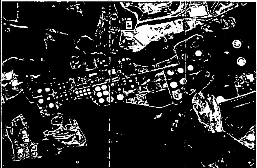
Figura 1: Raffineria di Roma - Vista dall'alto

Relazione tecnica allegata alla Istanza di presa d'atto ai sensi dell'art. 57, comma 8, D.L. n. 5/2012, della trasformazione dell'impianto sito nel Comune di Roma, Località Pantano di Grano, da stabilimento di lavorazione e di stoccaggio di oli minerali in mero deposito di oli minerali