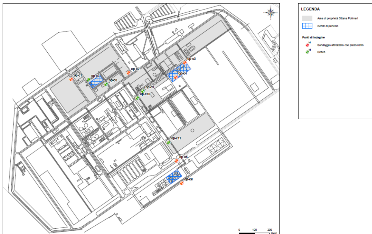
Figura 2 – Ubicazione dei centri di pericolo e dei punti di campionamento acque e suolo.

In nessuno dei punti di campionamento è stato rilevato un valore superiore ai limiti di soglia imposti per i parametri ricercati e nella quasi totalità dei casi la concentrazione presente nella matrice (acqua o terreno) è risultata inferiore alla soglia di rilevabilità del metodo analitico impiegato.