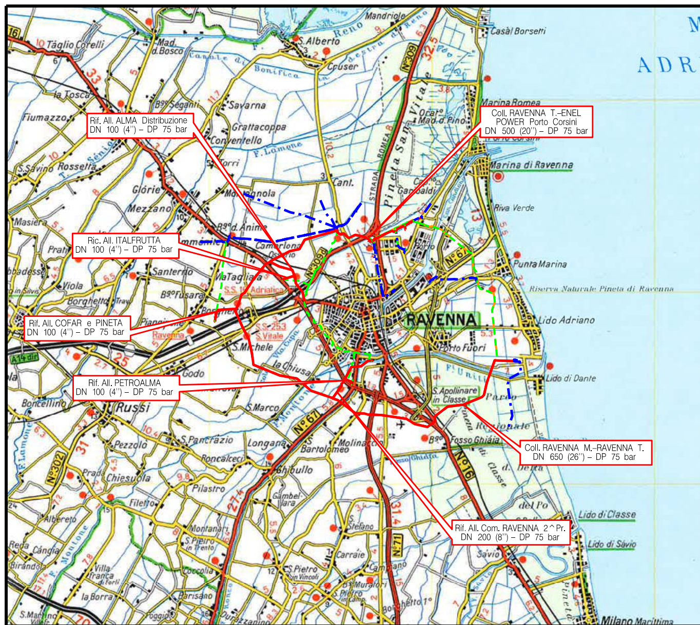
COROGRAFIA Scala 1:200.000