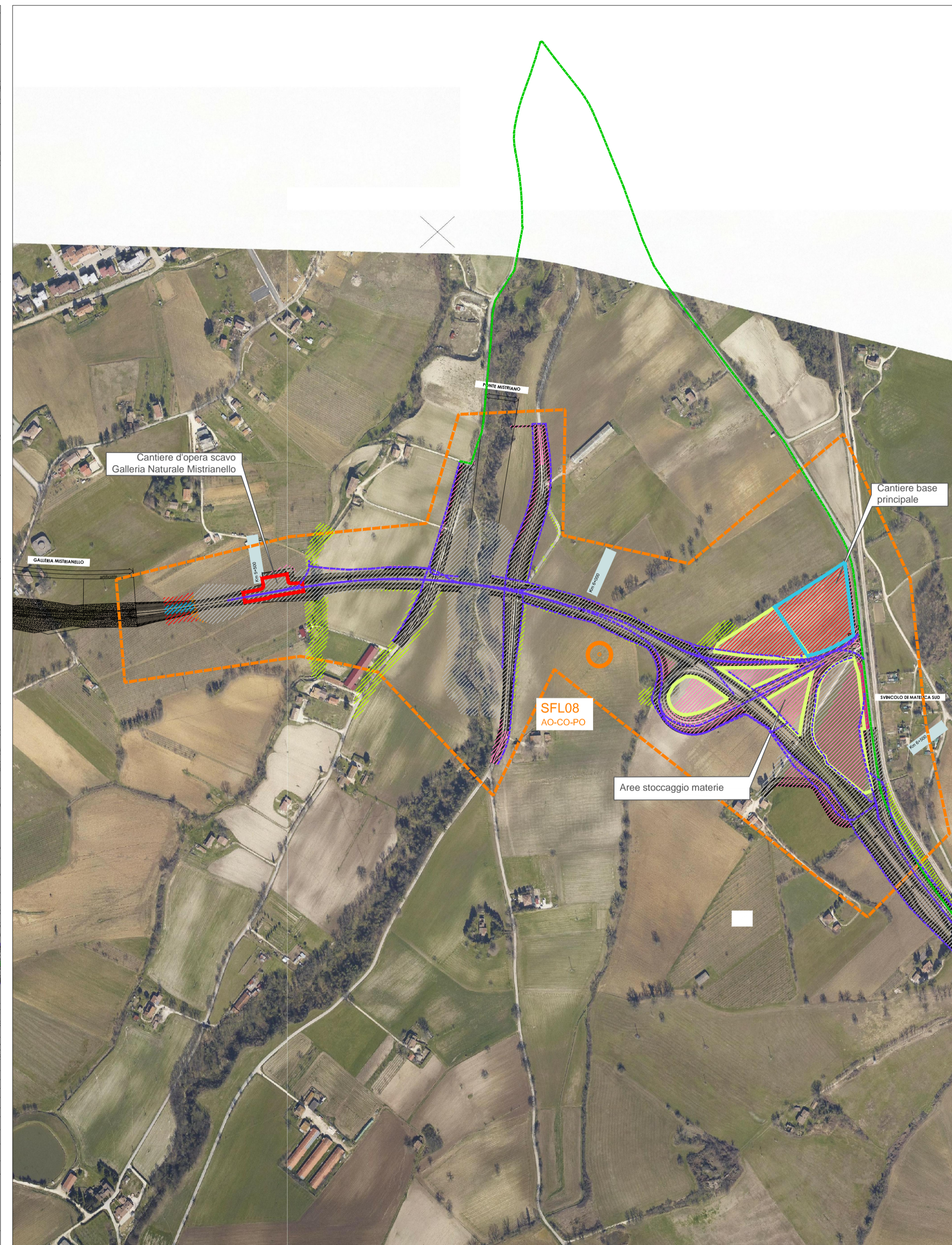
Sovrapposizione planimetria di progetto / Ortofoto Ante Operam (2017) - Scala 1:2000