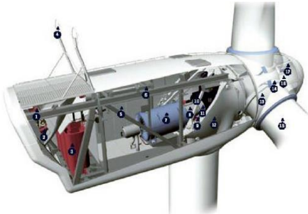
Fig. 4-1a. Schema di navicella completa di rotore e di pale (1. Raffreddamento olio; 2. Raffreddamento generatore; 3. Trasformatore; 4. Sensori condizioni vento; 5. Sistema controllo; 6. Argano e rotaia di movimentazione pezzi; 7. Punto di controllo generatore; 8. Collegamento generatore-moltiplicatore giri; 9. Azionamento imbardata; 10. Moltiplicatore; 11. Freno di stazionamento; 12. Cella di sostegno macchinario; 13. Cuscinetto di pala; 14/15. Albero; 16. Collegamento per azionamento pitch; 17. Controller dell'albero)