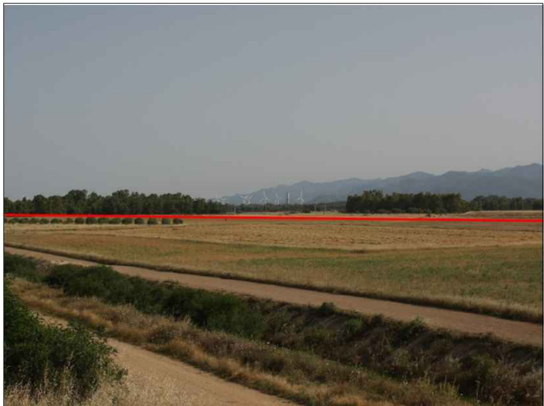
Attraversamento di prati-pascoli in prossimita' della S.P. n. 2, in Comune di Uta