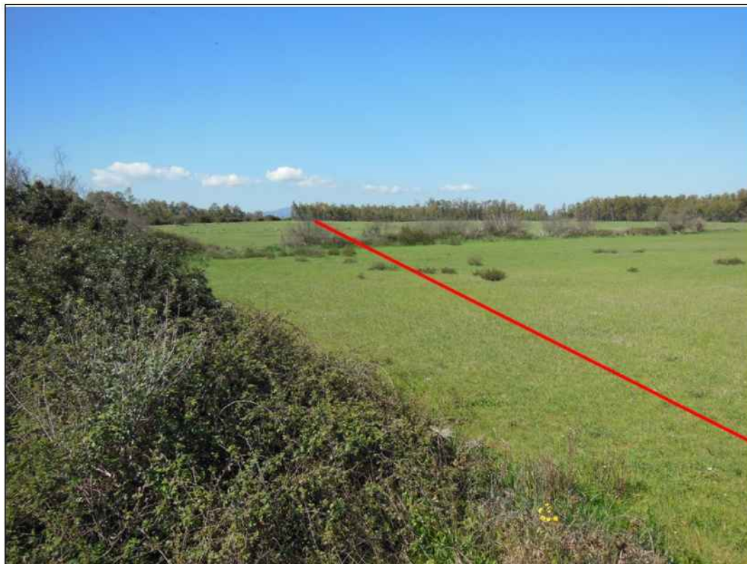
Percorrenza della condotta nel Comune di San Gavino Monreale