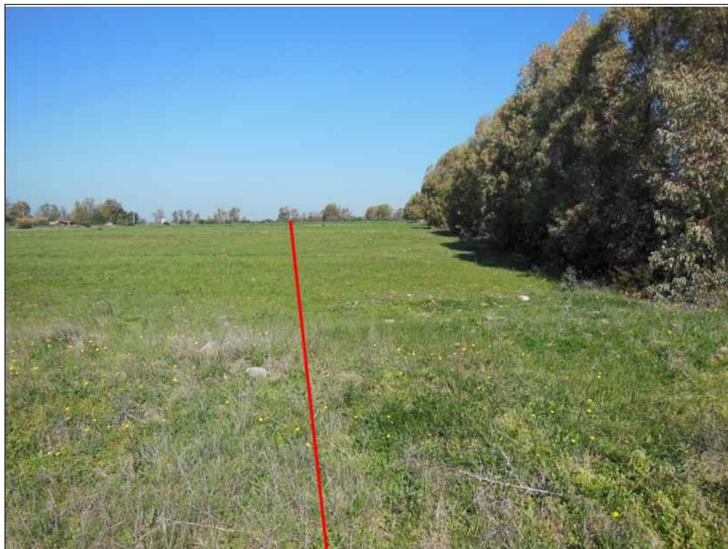
Tracciato della condotta, in Comune di Uras