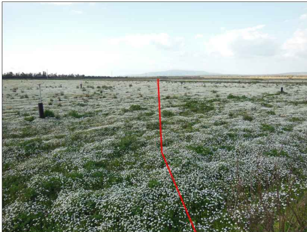
Panoramica del tracciato, in Comune di San Gavino Monreale