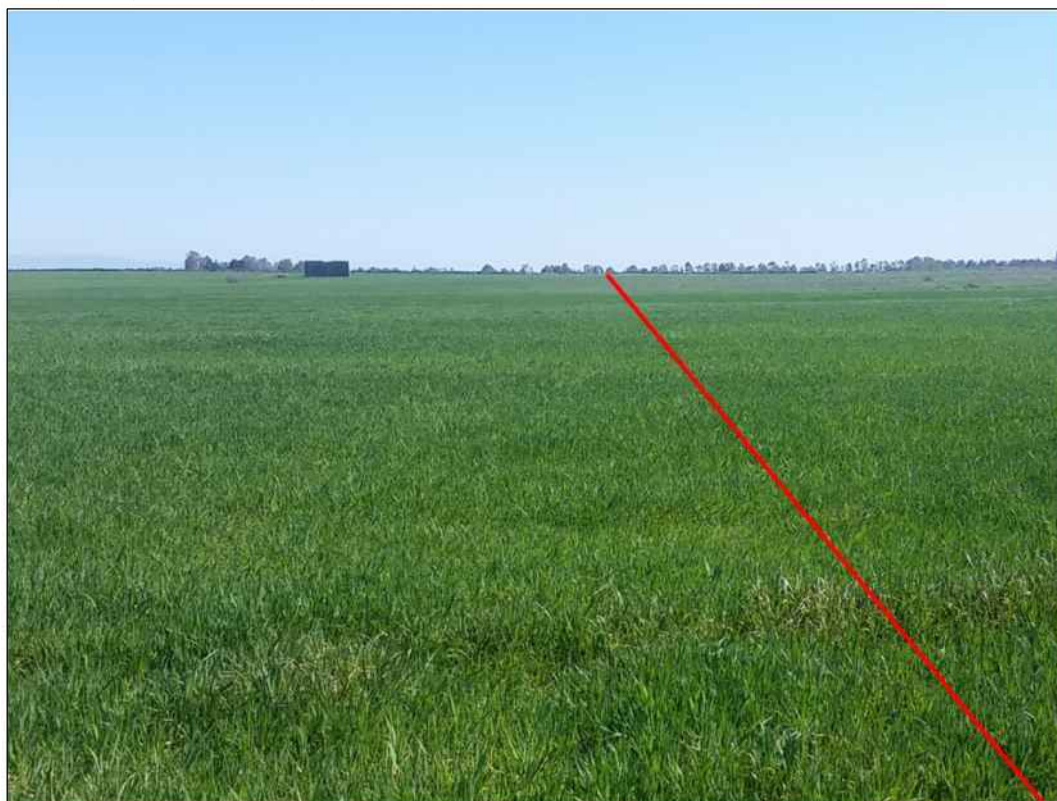
Attraversamento di seminativi in localita' Prescina Su Procu, in Comune di Villaspeciosa