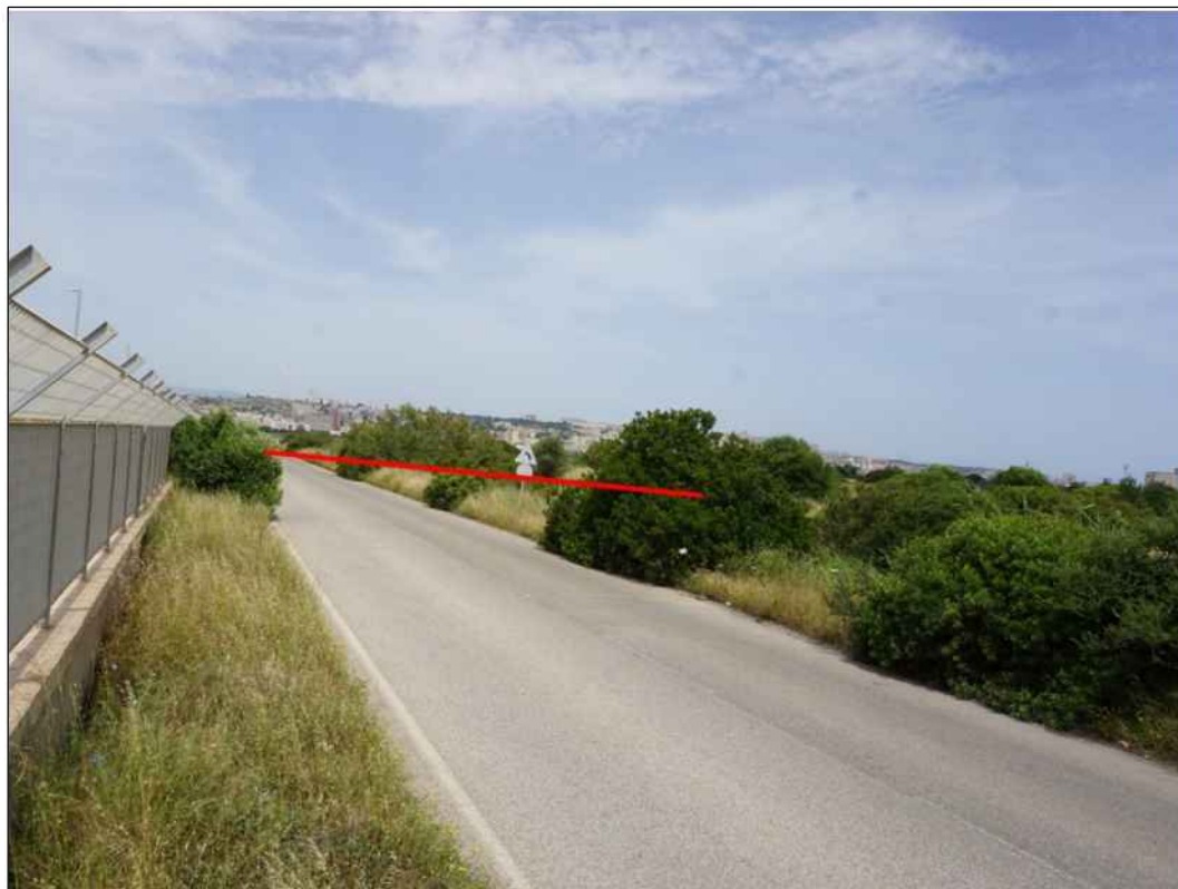
Panoramica del tracciato iniziale a nord della Localita' Giorgino in Comune di Cagliari