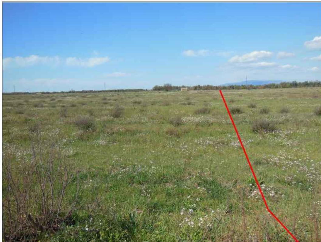
Percorrenza del tracciato a ovest dell'area produttiva, in Comune di San Gavino Monreale