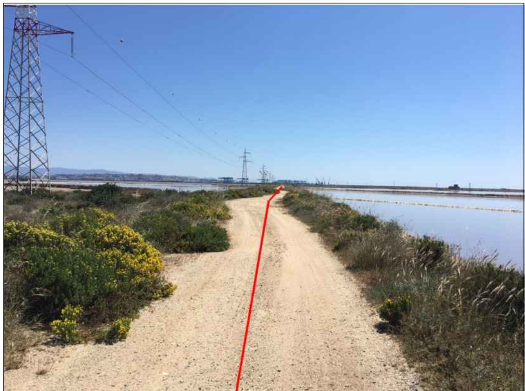
Panoramica del tracciato in prossimita' dello stagno di Cagliari, in Comune di Assemini