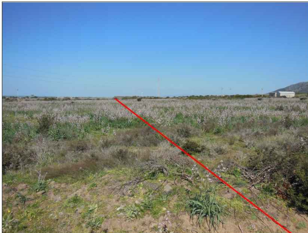
Panoramica del tracciato ad est della S.S. n. 131" Carlo Felice", in Comune di Marrubiu