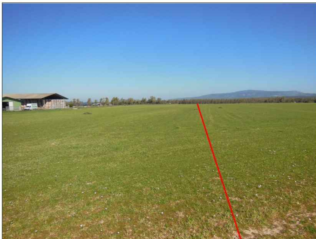
Panoramica in localita' Is Aenas, in Comune di Mogoro