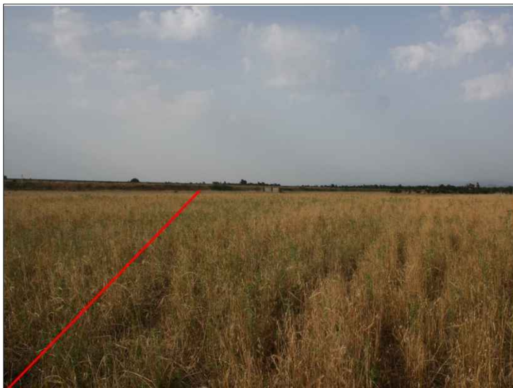
Panoramica del tracciato in prossimità del Riu Cixerri in Comune di Uta