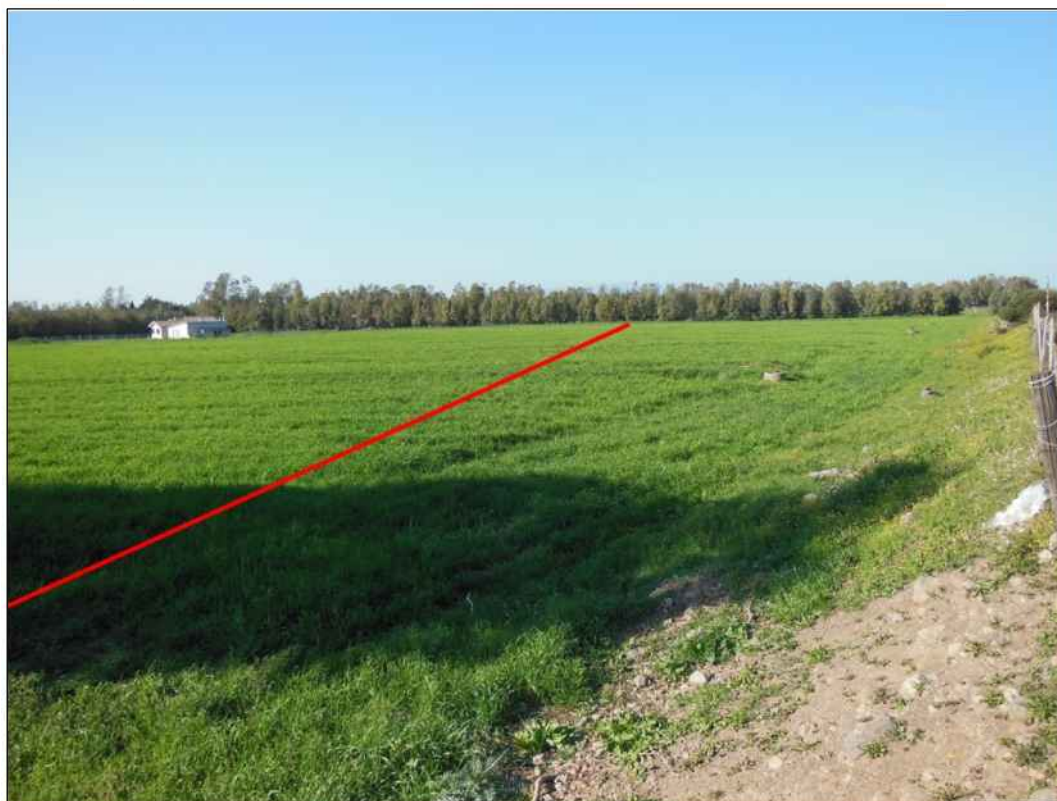
Percorrenza in prossimita' della frazione di Sant'Anna, in Comune di Marrubiu