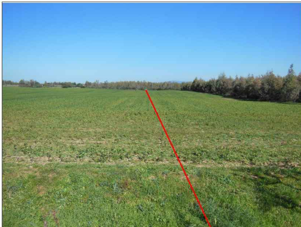
Panoramica del tracciato in localita' S'Enna su Molenti, in Comune di San Gavino Monreale