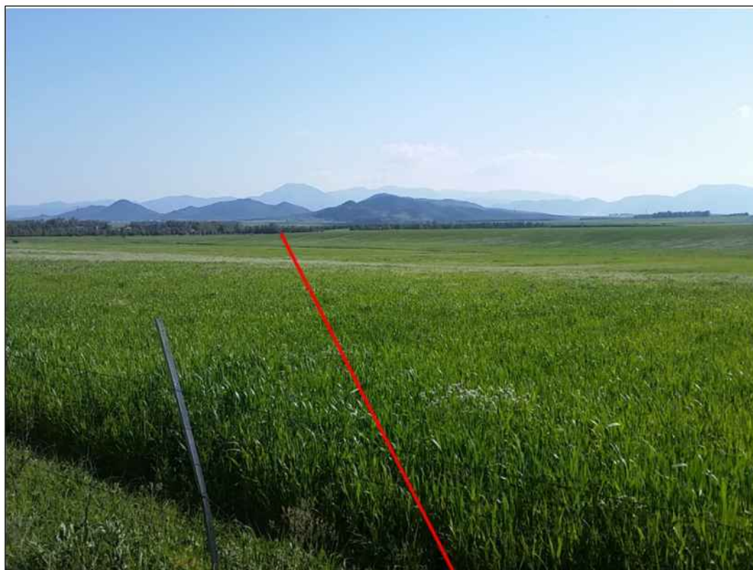
Panoramica del tracciato in seminativi, in Comune di Villasor