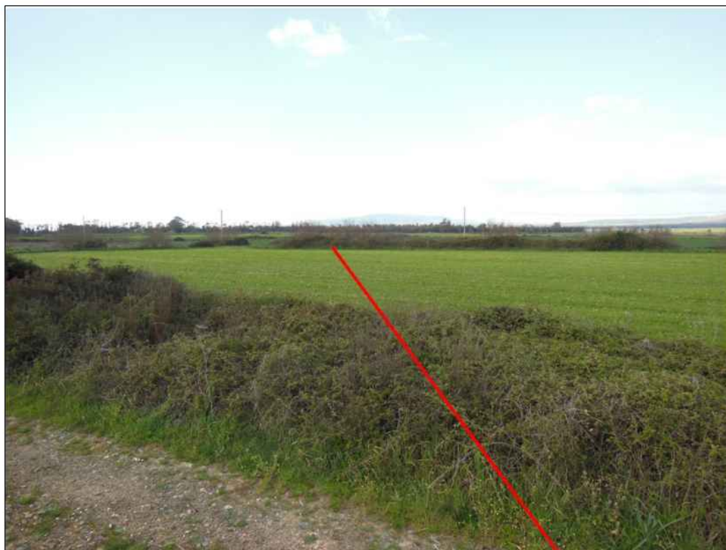
Percorrenza di seminativi in localita' Zirva Lada, in Comune di San Gavino Monreale