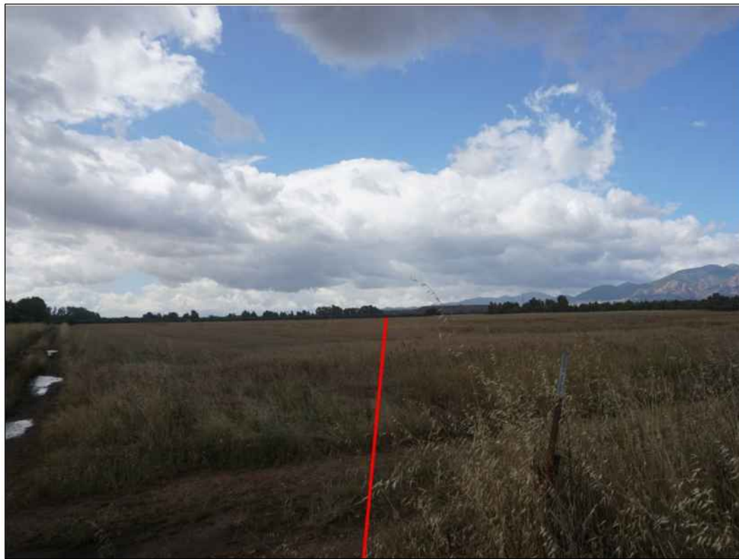
Attraversamento di seminativi in localita' Zirva de Sa Carroccia nel Comune di Villacidro