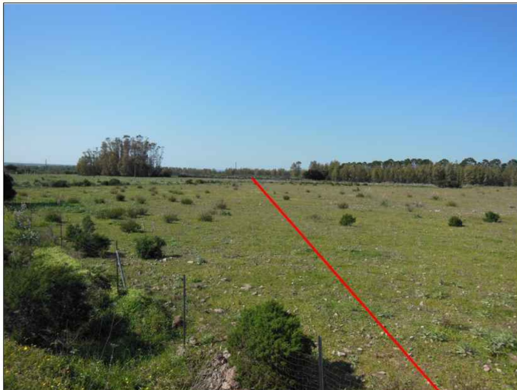
Attraversamento di pascoli a nord della S.P. 68 in localita' Mandrazzorcu, in Comune di Marrubiu