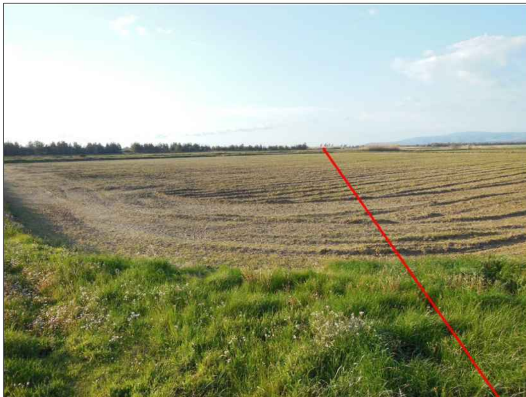
Percorrenza della condotta in appezzamenti a seminativo, in Comune di San Gavino Monreale