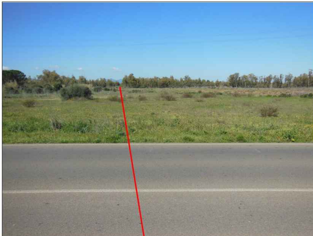
Attraversamento S.S. n. 197, in Comune di San Gavino Monreale