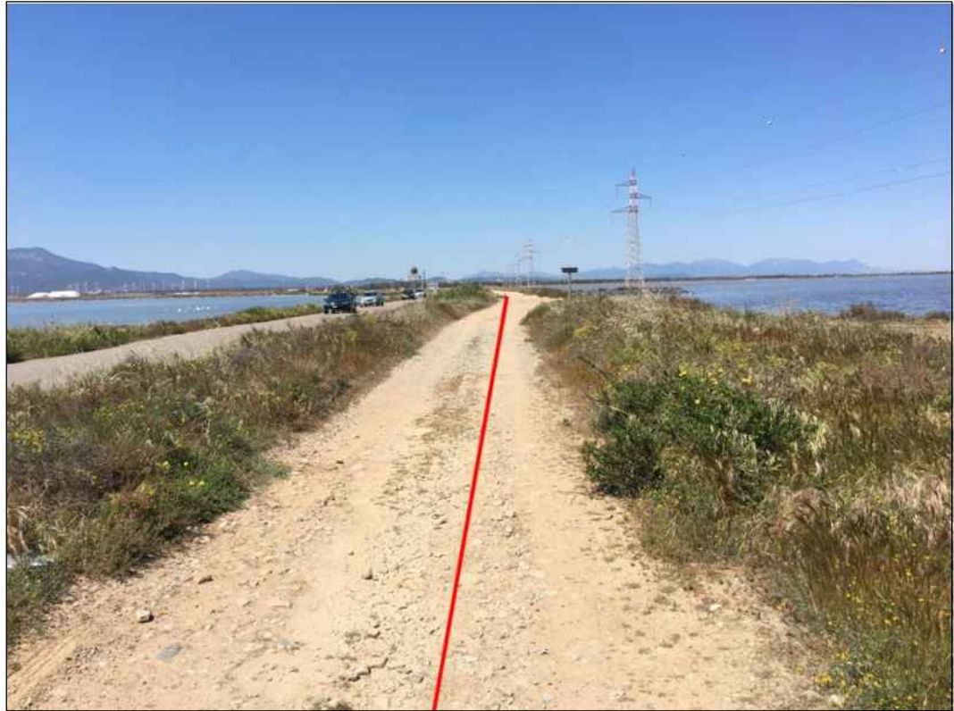
Percorrenza della condotta su strada bianca comunale, in prossimita' dello Stagno di Cagliari