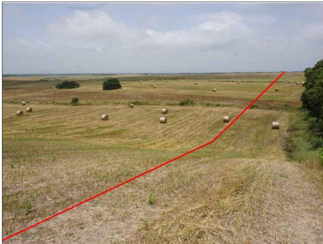
Percorrenza della condotta in seminativi, in Comune di Palmas Arborea