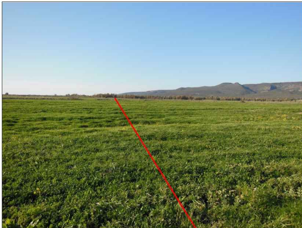
Attraversamento di prati-pascoli in localita' Pauli Gruis, in Comune di Uras