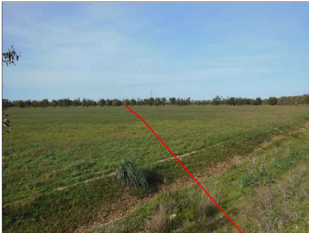
Panoramica del tracciato, in Comune di Villacidro