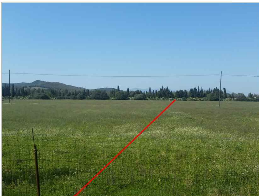
Panoramica attraversamento di seminativi, in Comune di Uta