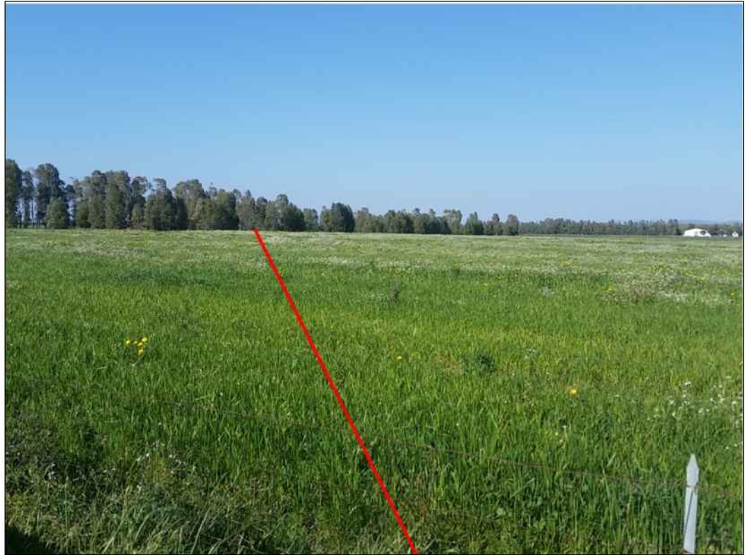
Percorrenza del tracciato, in Comune di Villasor