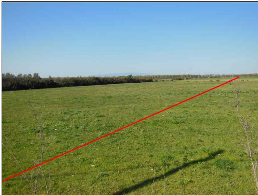
Tracciato della condotta a nord della strada comunale "Is Bangius", in Comune di Marrubiu