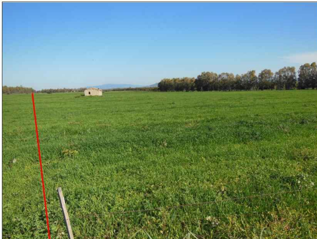
Percorrenza a nord del Torrente Seddamus, in Comune di San Gavino Monreale