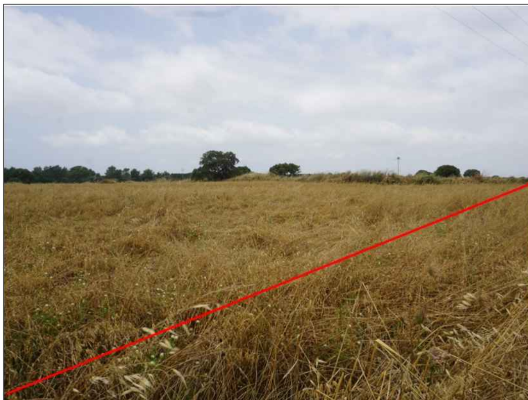
Attraversamento di seminativi in localita' Campu Siuru nel Comune di Santa Giusta