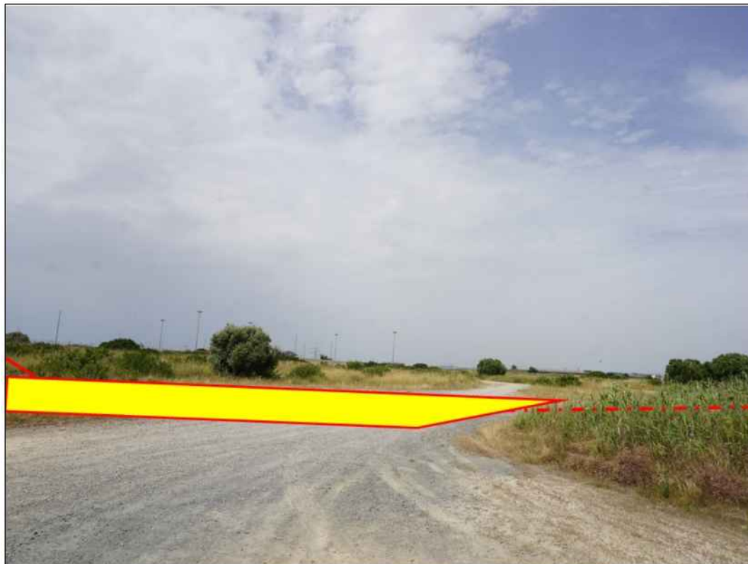
Panoramica del punto iniziale della condotta in prossimita' del PID n. 1 in Comune di Cagliari