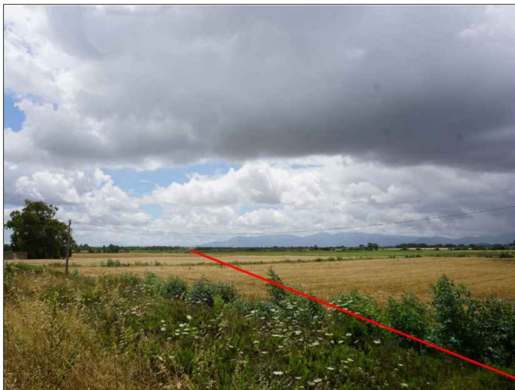
Panoramica del tracciato in prossimita' della S.S. n. 131, in Comune di Mogoro