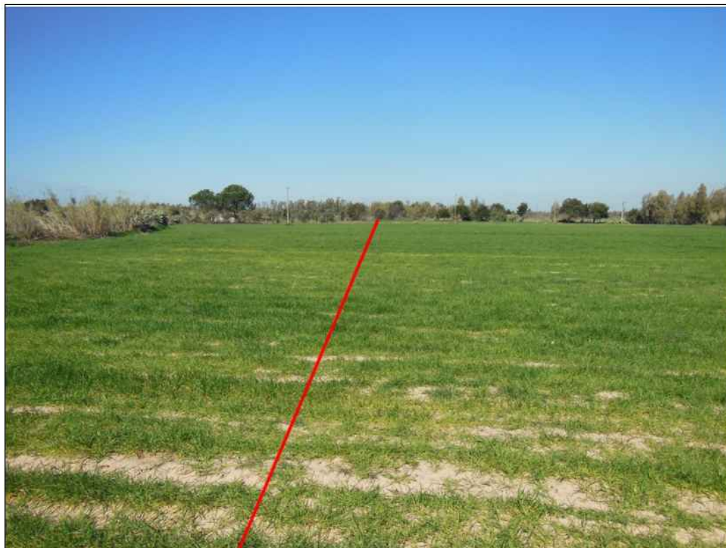
Percorrenza della condotta in seminativi, in Comune di Mogoro