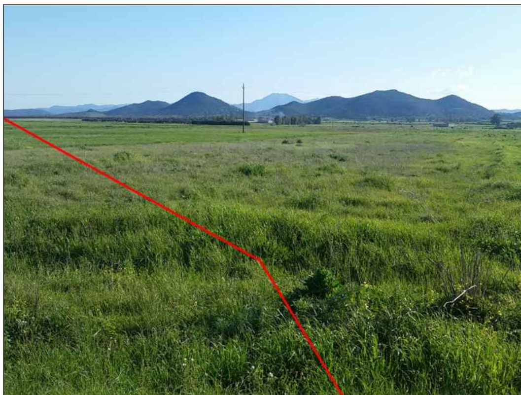
Panoramica del tracciato a sud del Riu Nou, in Comune di Decimoputzu