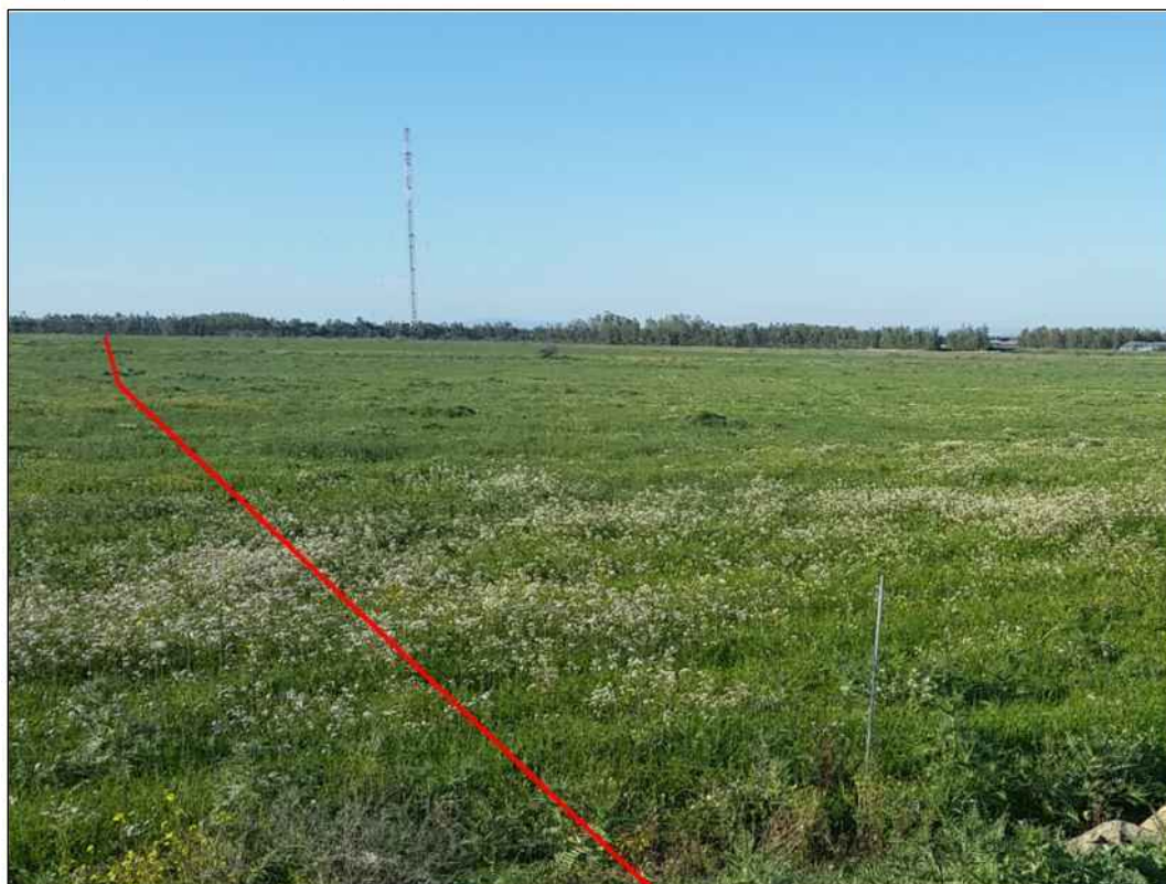
Panoramica del tracciato in vicinanza del Riu Spinosu, in Comune di Decimoputzu