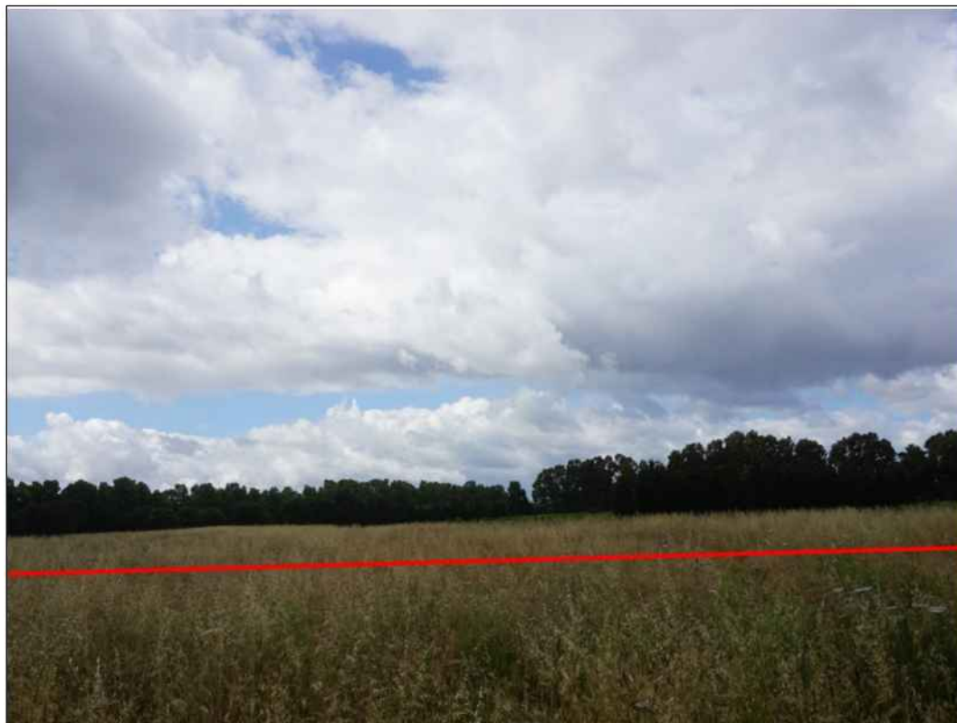
Panoramica del tracciato in prossimita' del PID n. 8 in localita' Piscina de Quaddu, in Comune di Villacidro