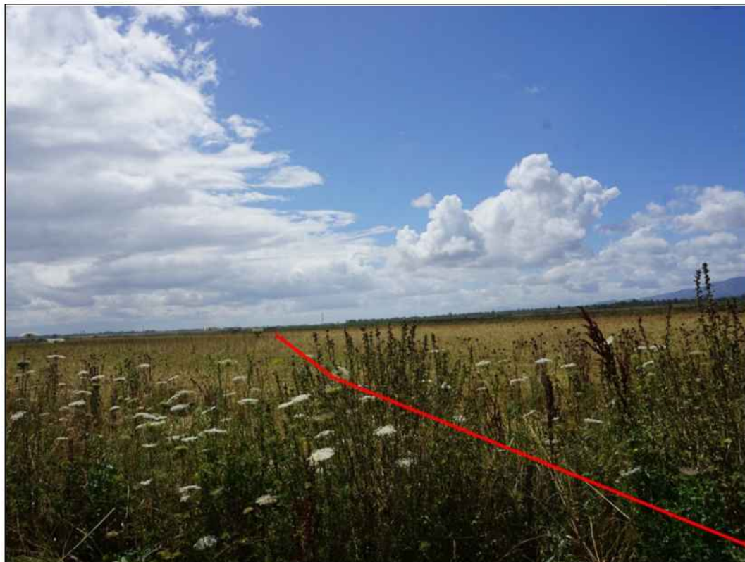
Panoramica del tracciato in prossimità del Flumini Malu in località S'Acqua Cotta nel Comune di San Gavino Monreale