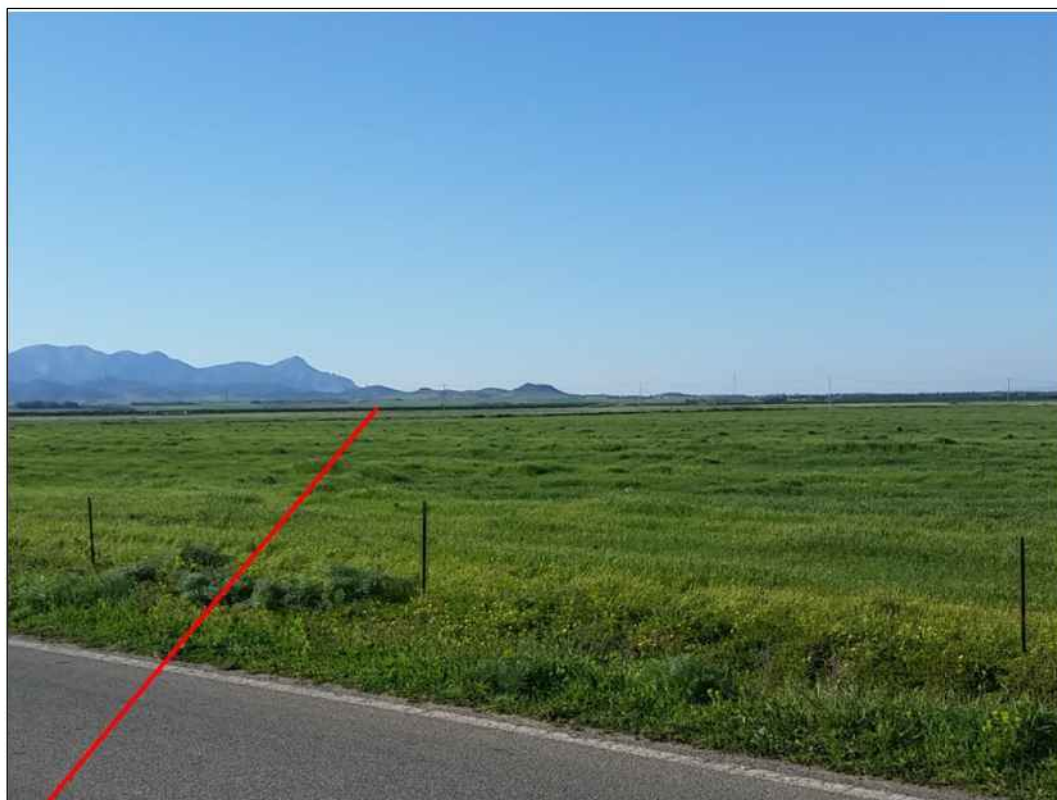
Percorrenza a sud della S.P. 3, in Comune di Decimoputzu