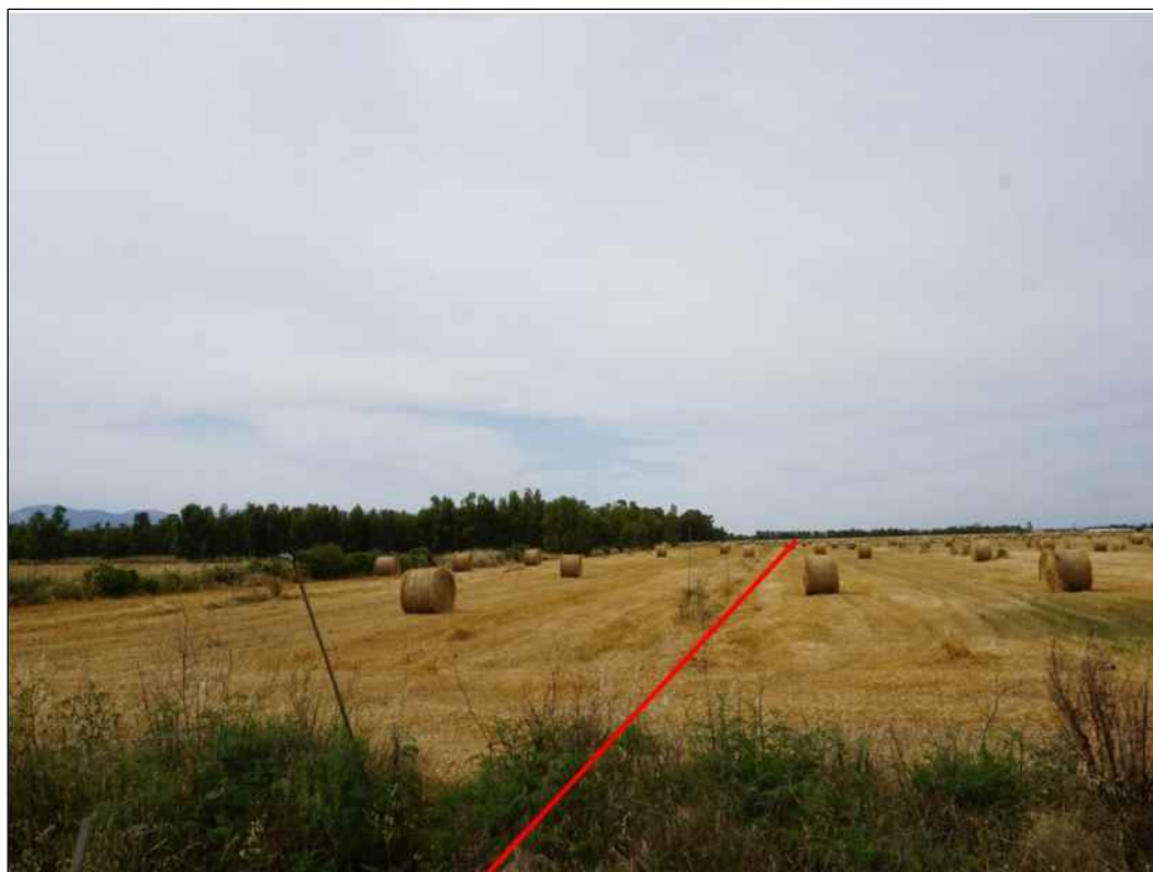
Percorrenza di seminativi in localita' Sa Carroccia, in Comune di Decimoputzu