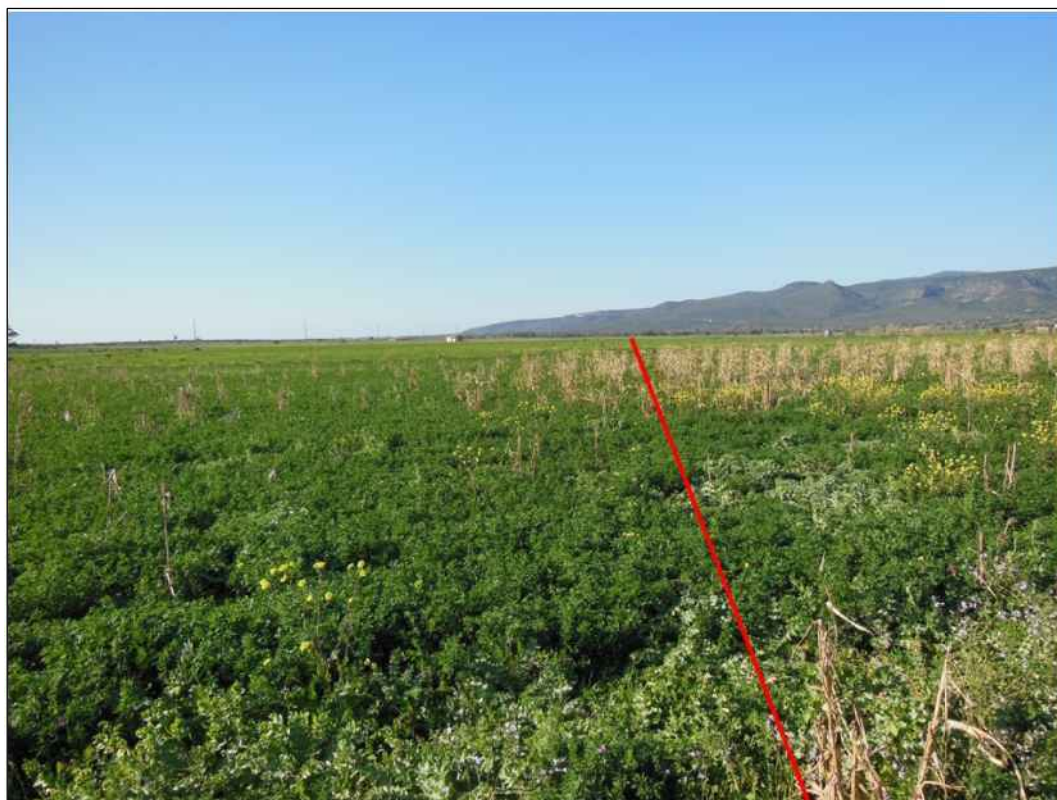
Panoramica del tracciato in localita' Terra Meloni, in Comune Mogoro