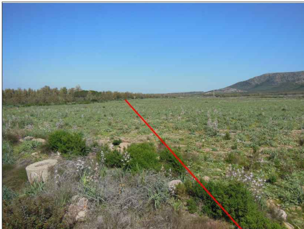
Panoramica del tracciato ad est della S.S. n. 131" Carlo Felice" in prossimita' della Zona Artigianale, in Comune di Marrubiu