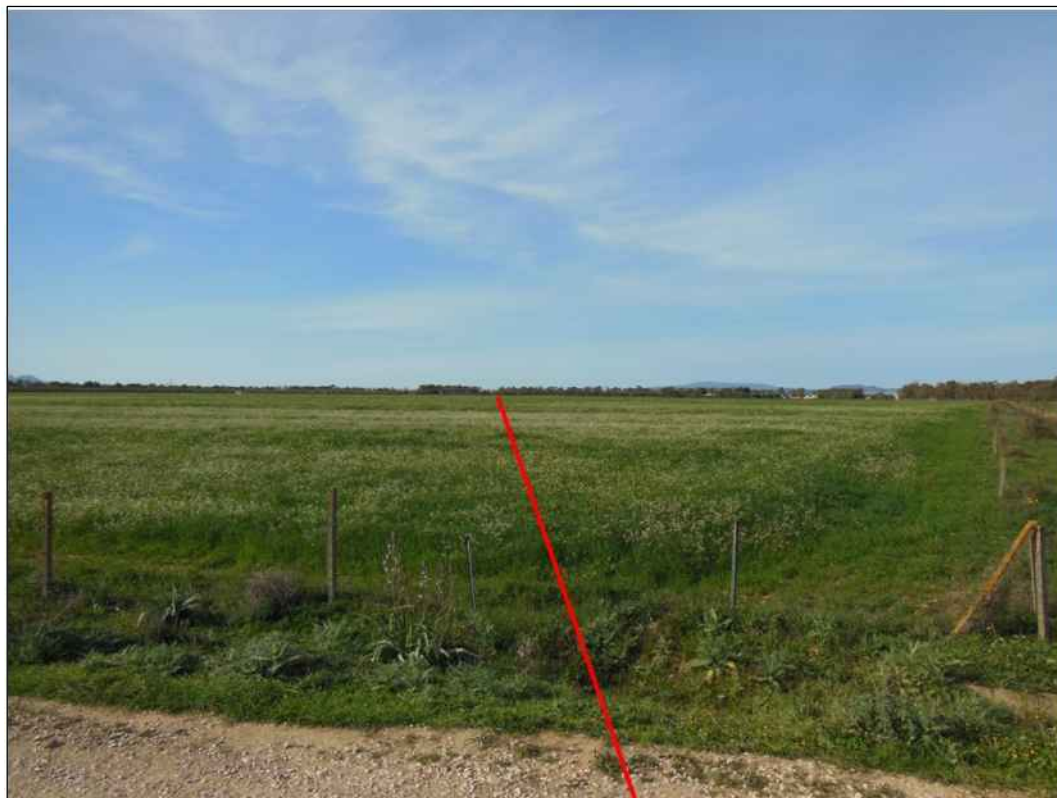
Percorrenza della condotta in vicinanza della "Strada de Mutera", in Comune di Villacidro