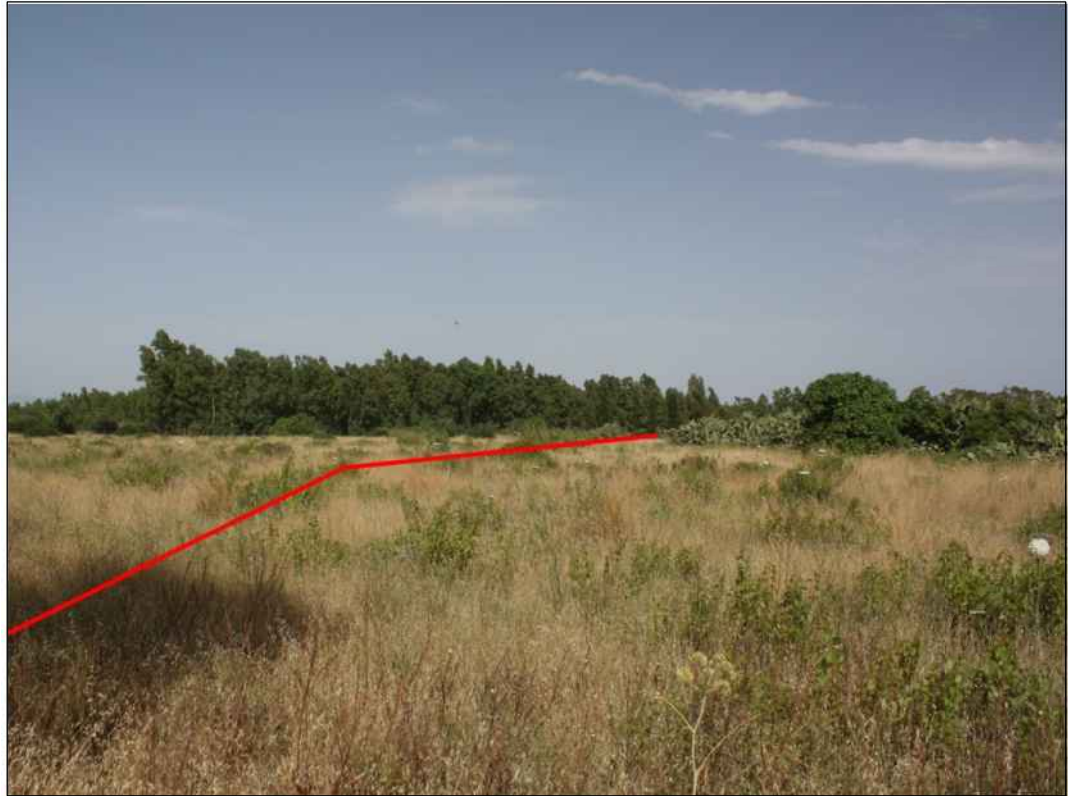
Panoramica del tracciato in localita' S'Affronta in Comune di Uta