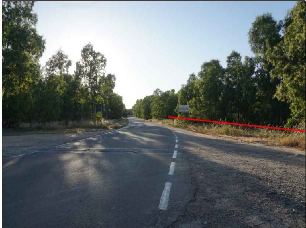
Panoramica del tracciato a sud-est della localita' industriale di Macchiareddu in prossimita' della S.P. 1, in Comune di Assemini