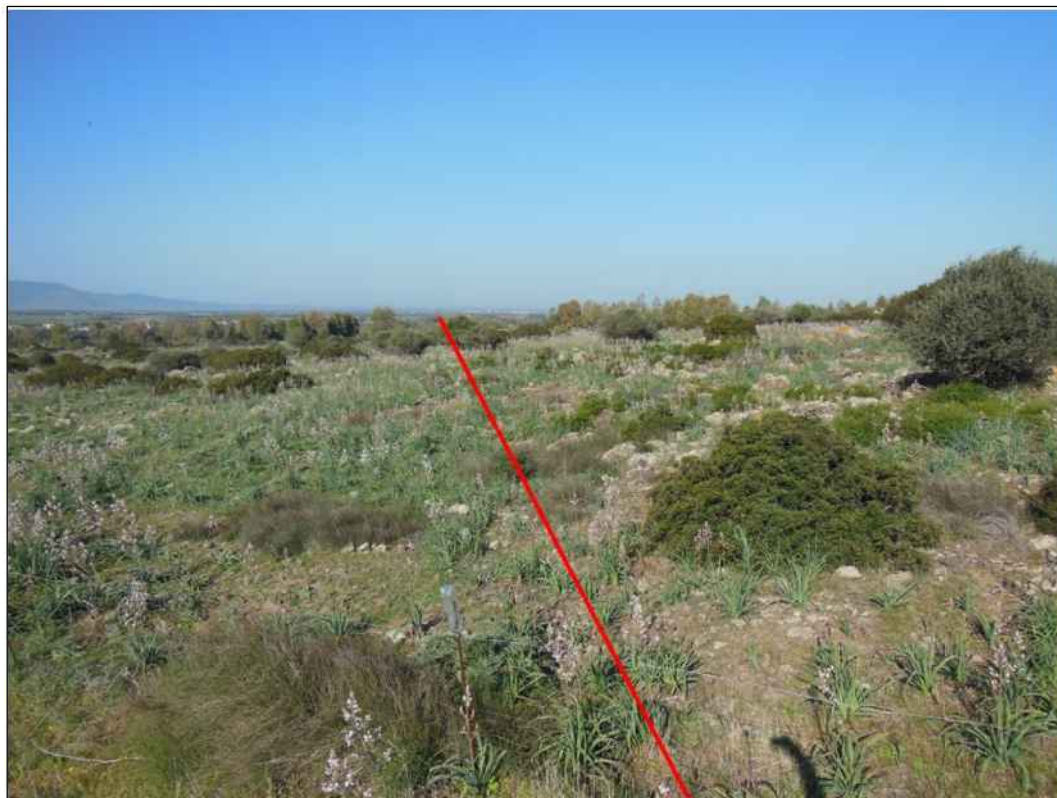
Panoramica del tracciato a est della S.S. 131 "Carlo Felice" in prossimita' del centro abitato di Uras

Il presente disegno e' di proprieta' aziendale - La Societa' tutelera' i propri diritti a termine di legge.