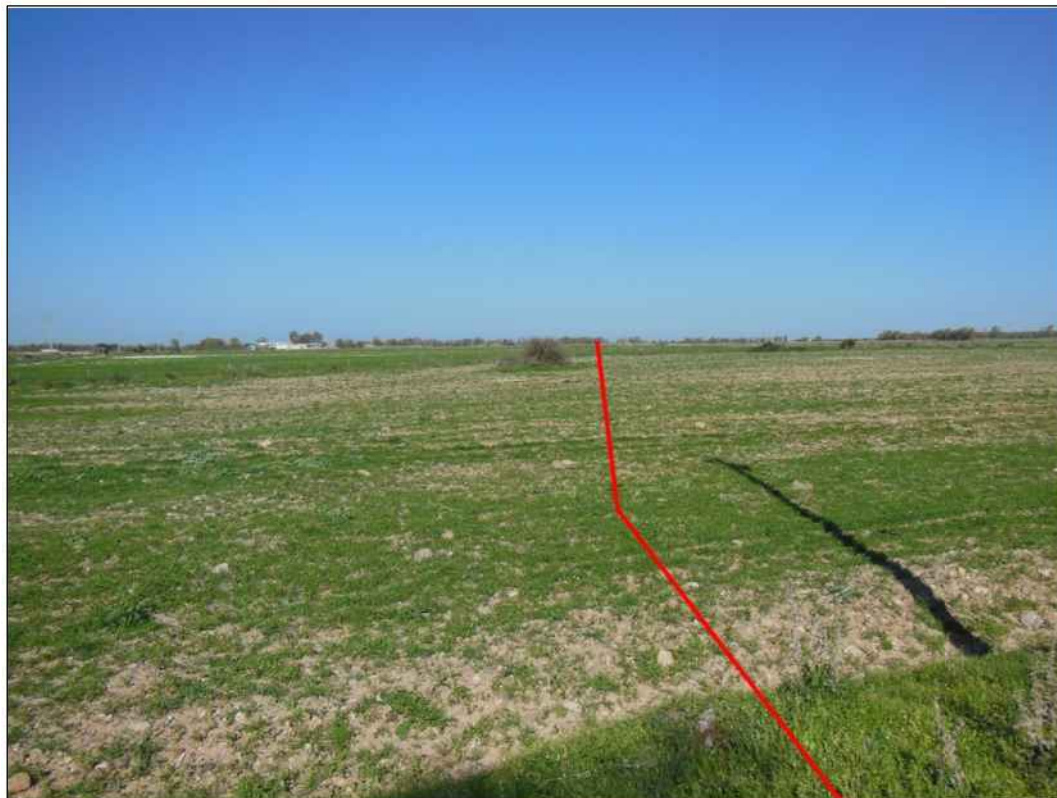
Percorrenza del tracciato in terreni destinati al pascolo ad est della S.S. 131 "Carlo Felice", in Comune di Uras