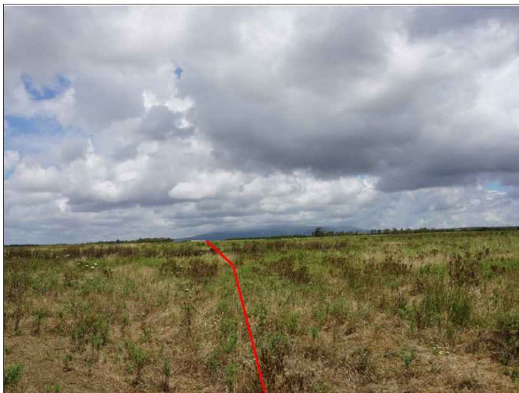
Attraversamento di prati-pascoli in località Bia Sardara nel Comune di Pabillonis