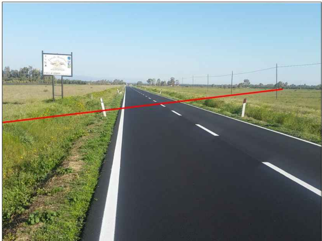
Attraversamento della S.S. n. 196, in Comune di Villasor

Il presente disegno e' di proprieta' aziendale - La Societa' tutelera' i propri diritti a termine di legge.