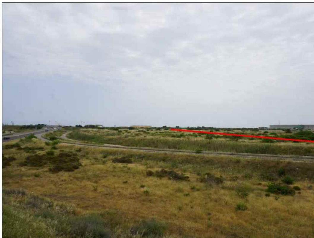
Panoramica della condotta in prossimità della S.S. n. 195 Sulcitana in Comune di Cagliari