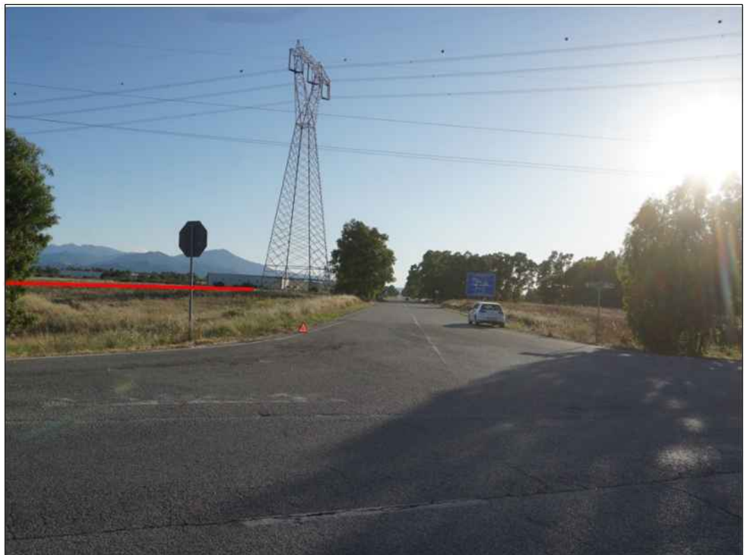
Percorrenza della condotta a nord-est dell'area industriale di Macchiareddu in Comune di Assemini