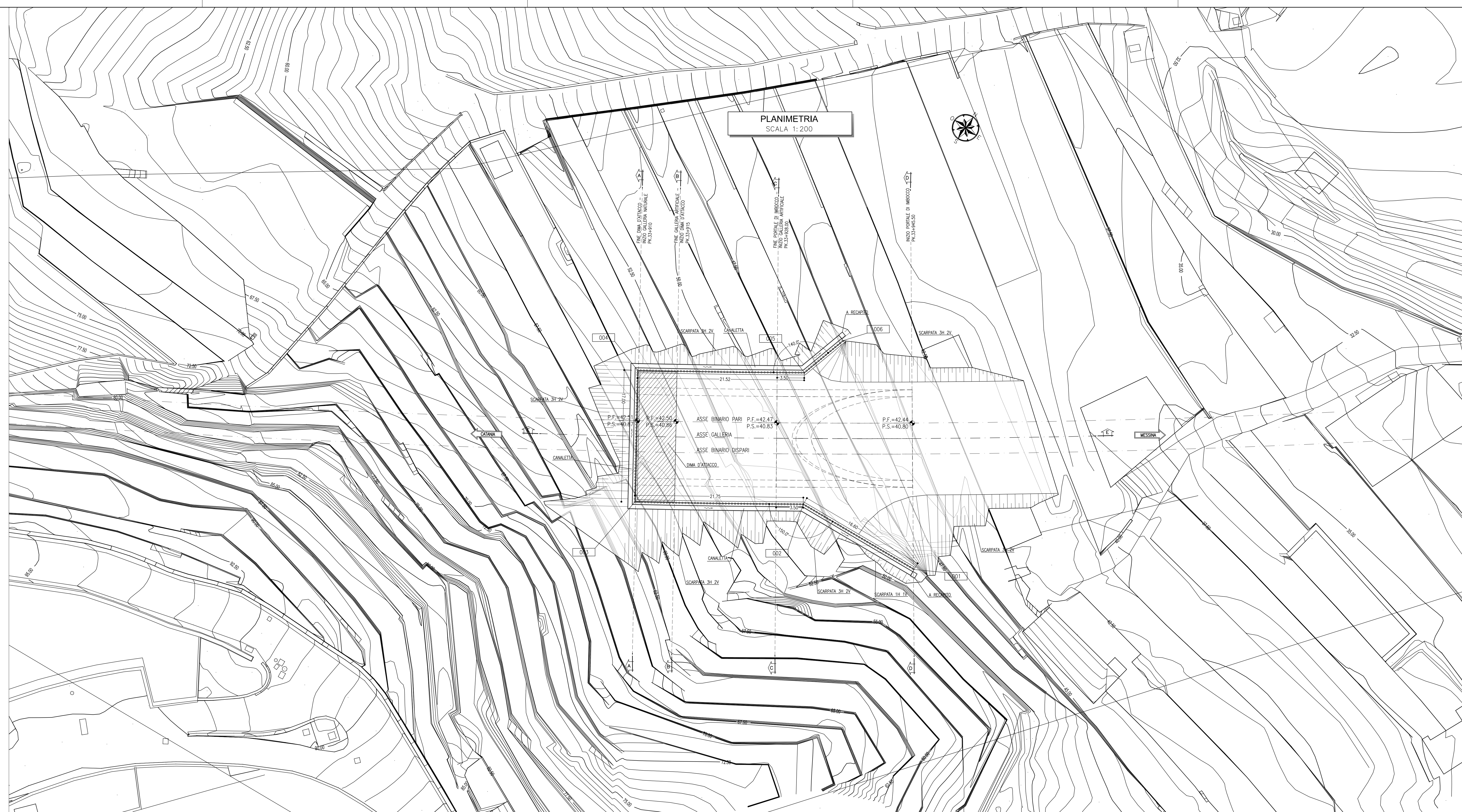
PLANIMETRIA SCALA 1:200