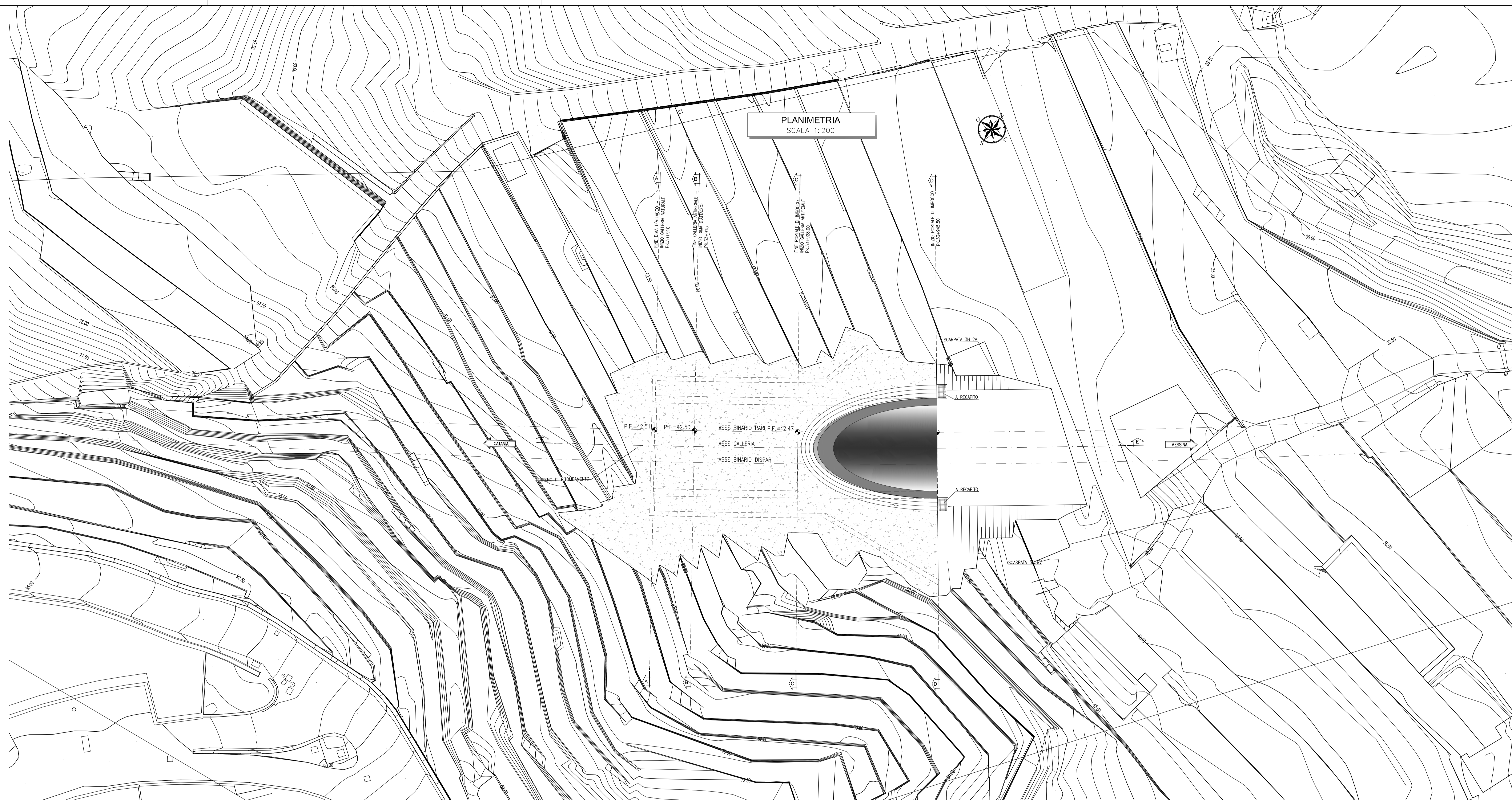
PLANIMETRIA SCALA 1:200