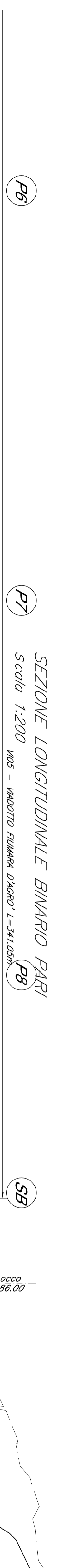
SEZIONE LONGITUDINALE BINARIO PARI Scala 1:200