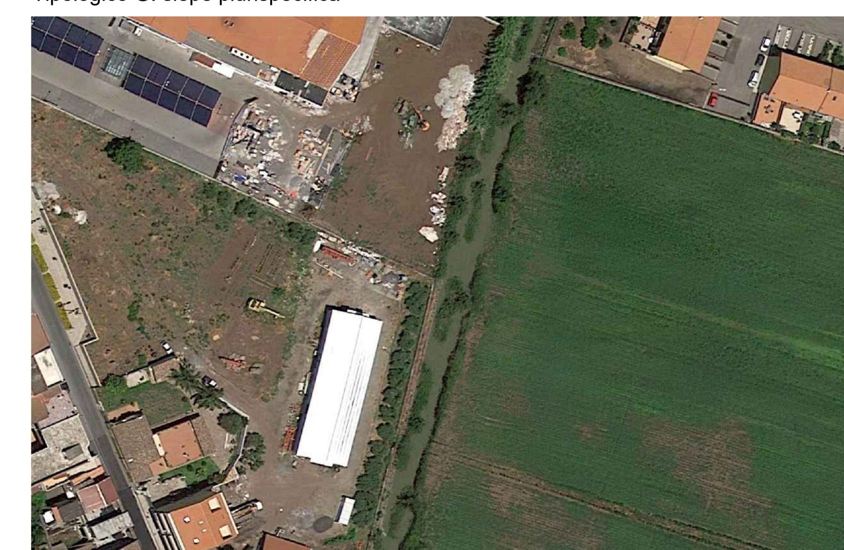
Post operam Tipologico G: siepe plurispecifica