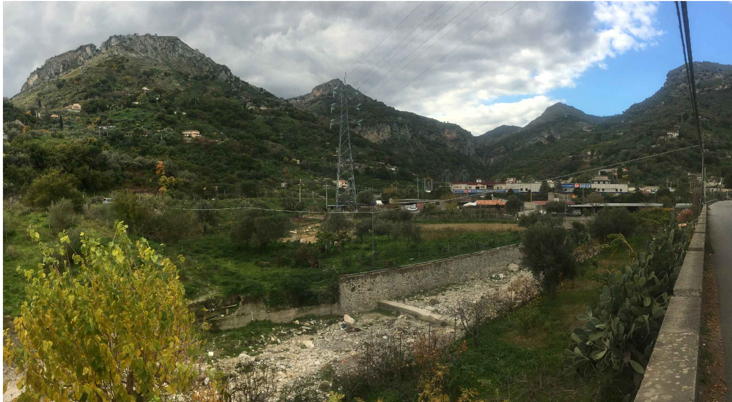
STATO ANTE OPERAM