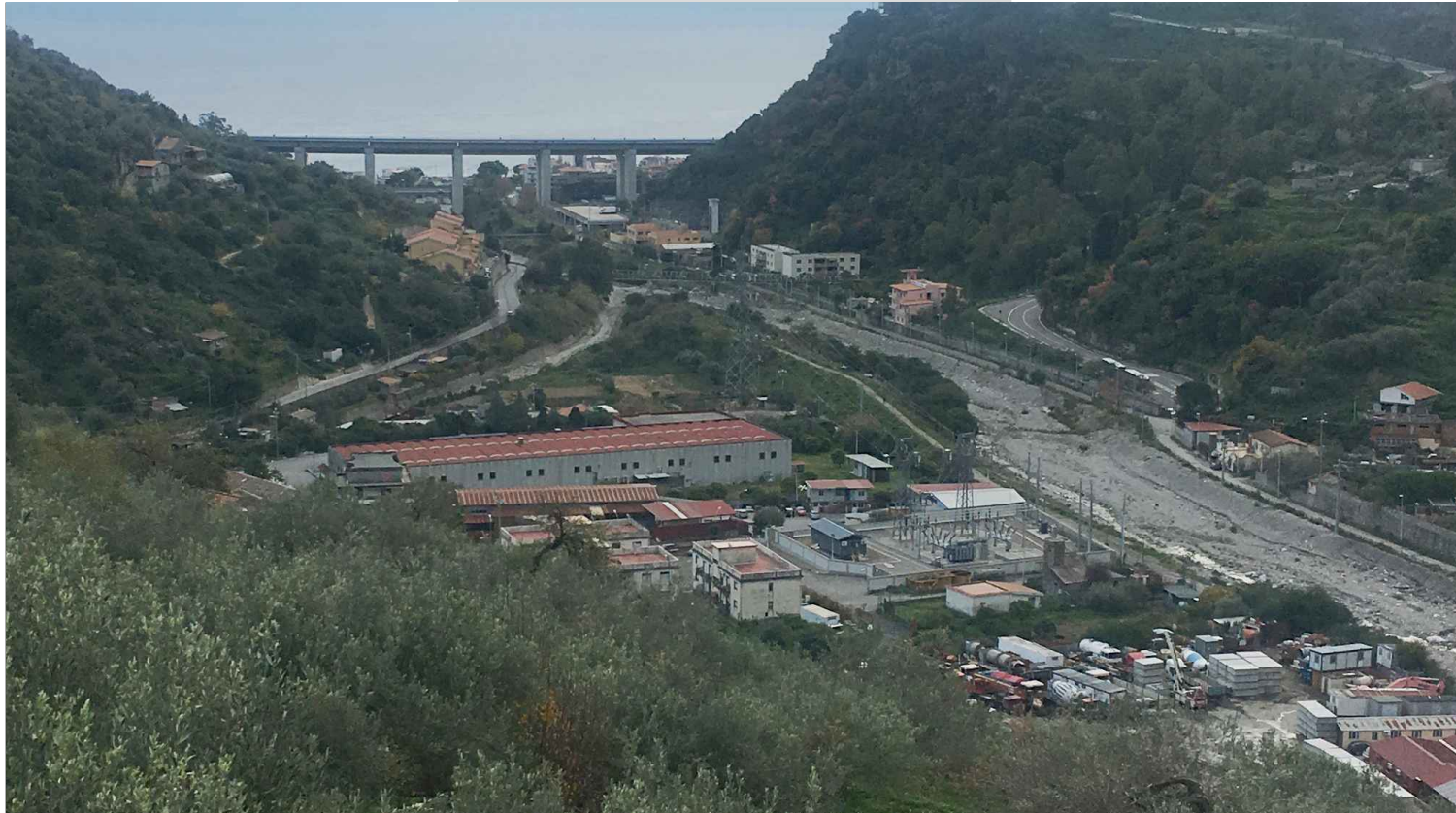
STATO ANTE OPERAM