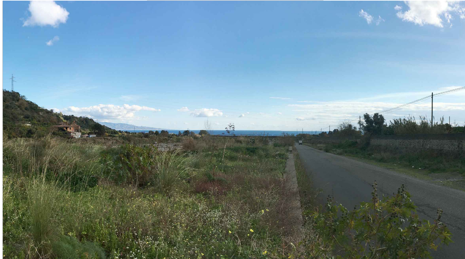
STATO ANTE OPERAM