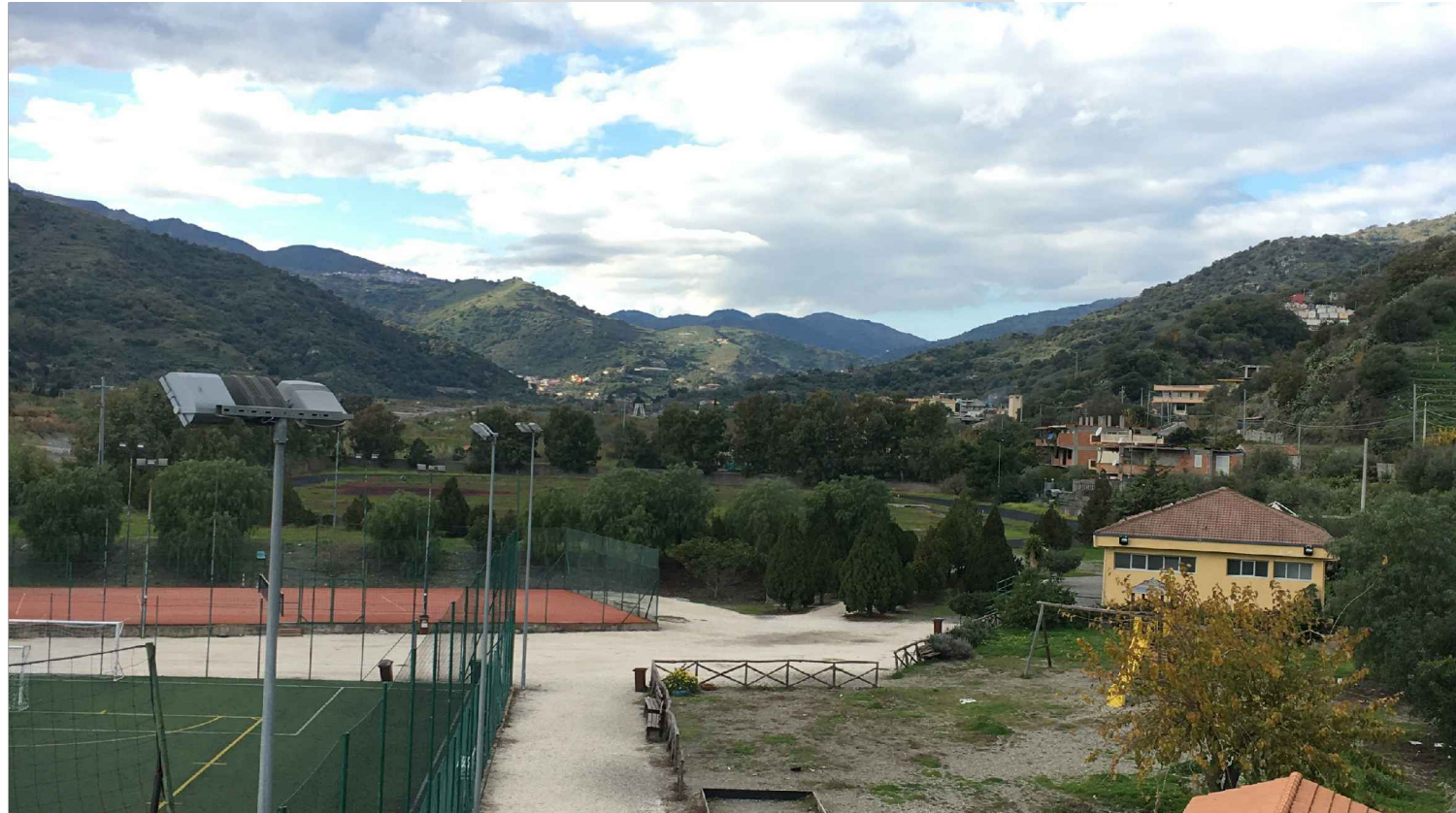
STATO ANTE OPERAM