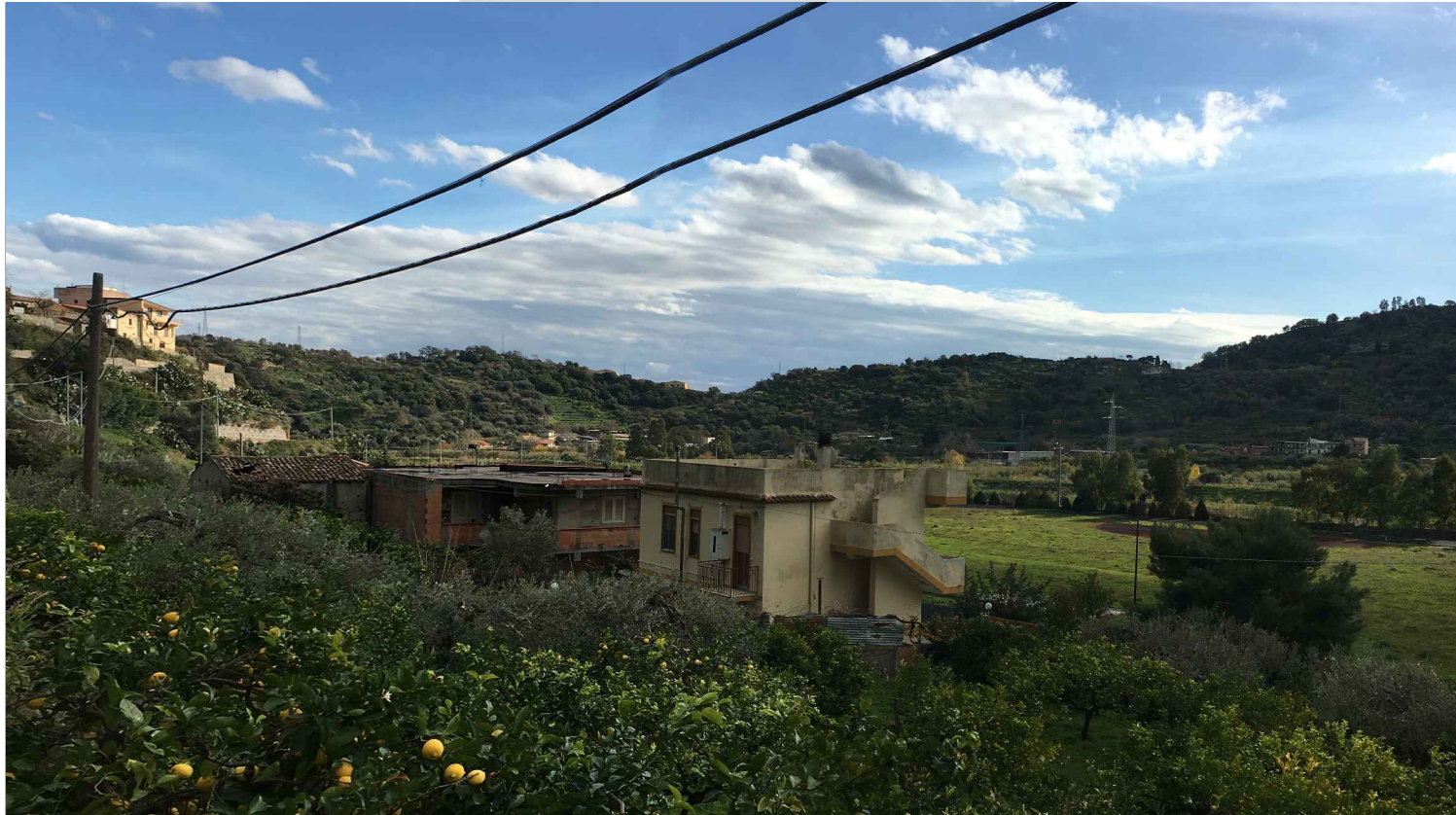
STATO ANTE OPERAM