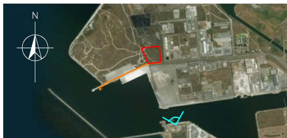
MAPPA DEL PUNTO DI VISTA FOTOGRAFICO