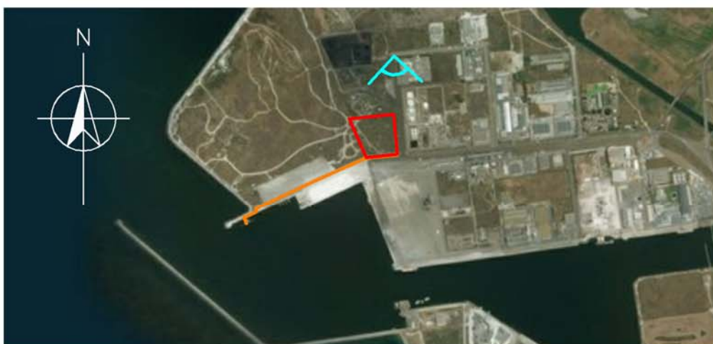
MAPPA DEL PUNTO DI VISTA FOTOGRAFICO