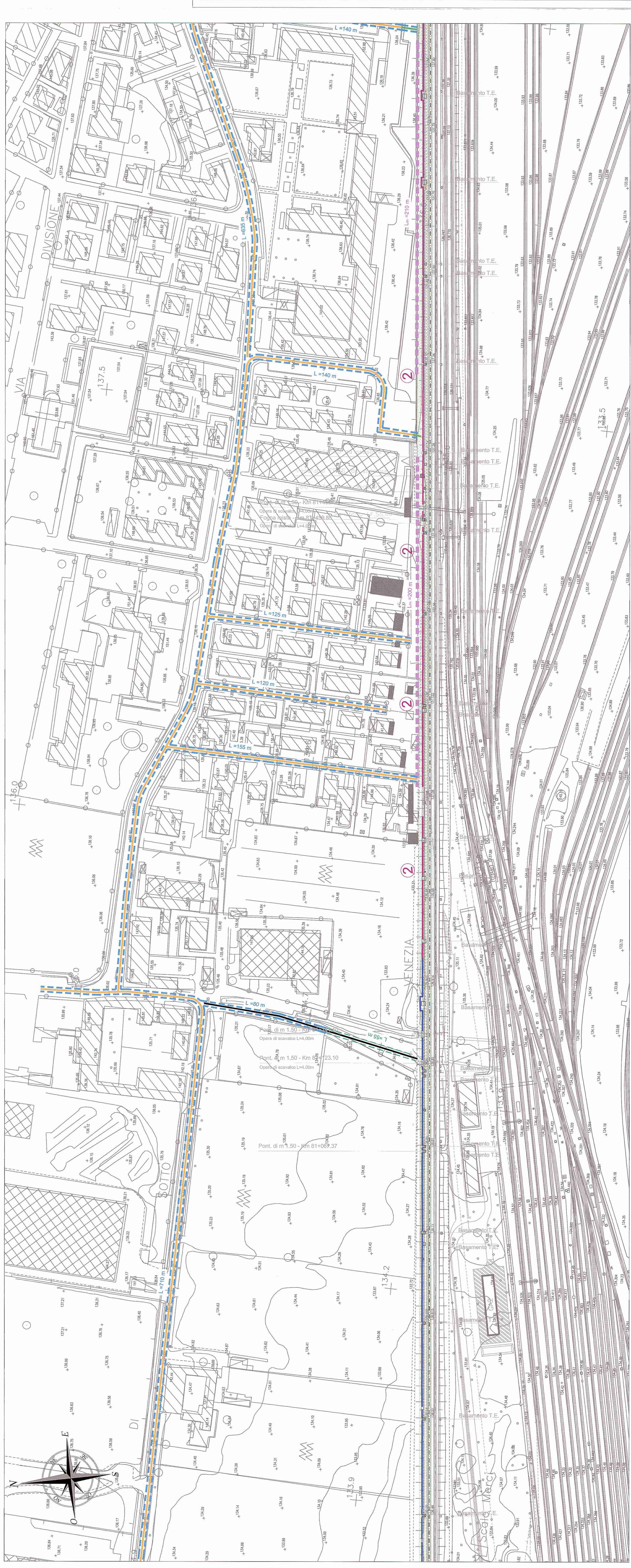
2- PLANIMETRIA INTERVENTI DI MITIGAZIONE scala 1:1.000