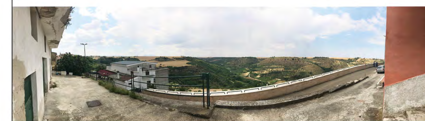
PANORAMICA PUNTO di SCATTO Montemilone (PZ) - via Piave Coordinata WGS84 41.033958-15.971202