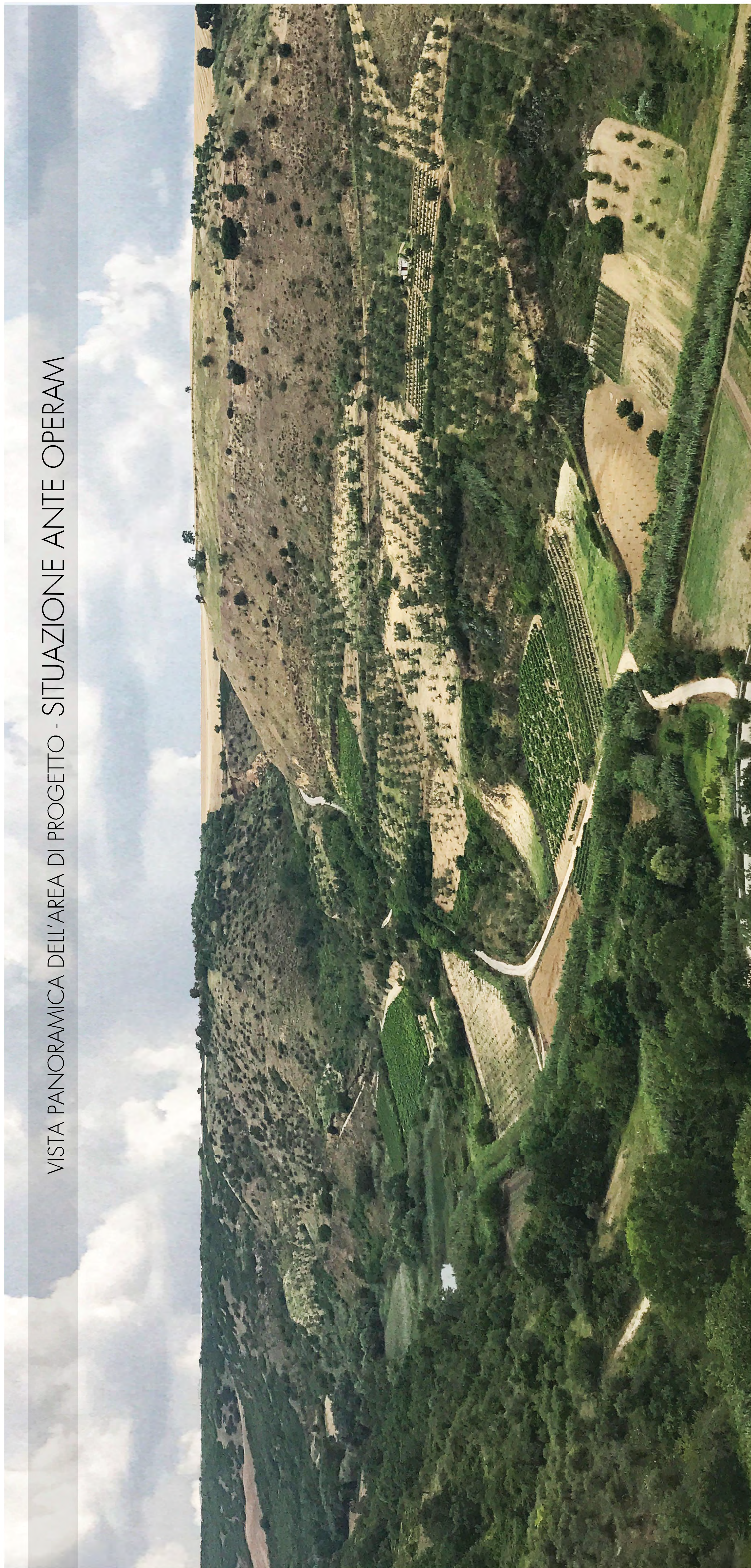
VISTA PANORAMICA DELL'AREA DI PROGETTO - SITUAZIONE ANTE OPERAM