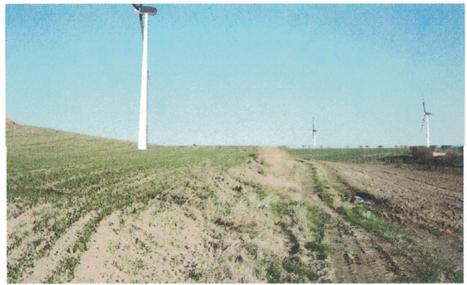
Punto di presa 14-Posta Capaciotti (Ante e Post Operam)