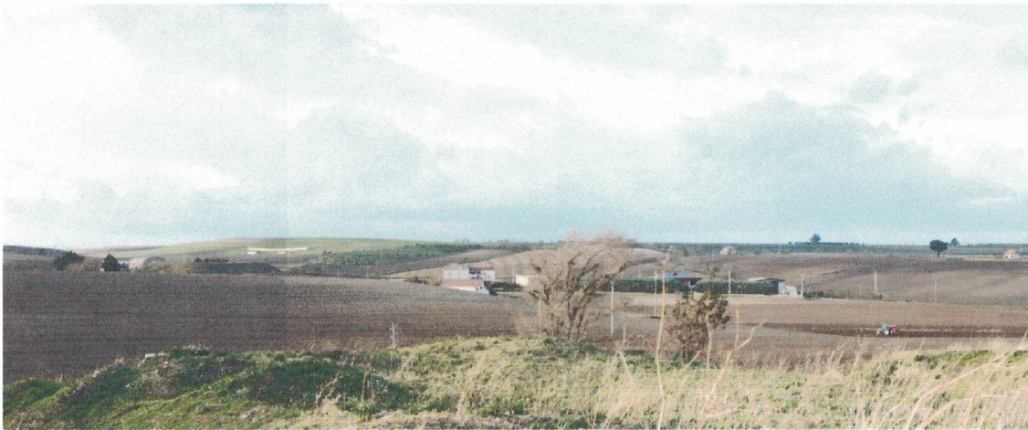
Punto di presa 19 – Masseria Gubito Primo (Ante Operam)