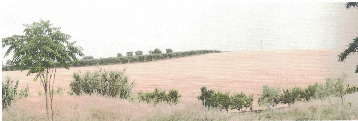
Punto di presa 20 – Torre Alemanna (Ante e Post Operam)

DIREZIONE GENERALE ARCHEOLOGIA BELLE ARTI E PAESAGGIO SERVIZIO V