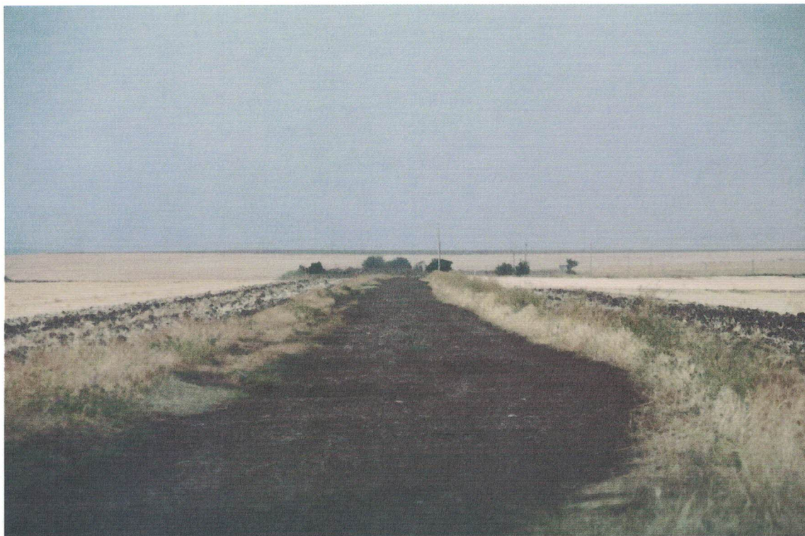
Punto di ripresa 22 – Tratturo tra la strada SP97 e la WTG1

DIREZIONE GENERALE ARCHEOLOGIA BELLE ARTI E PAESAGGIO SERVIZIO V