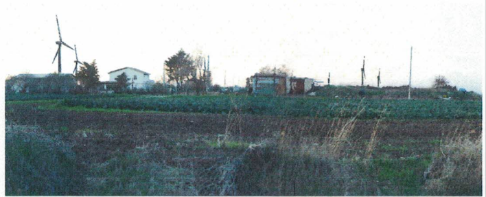
Punto di presa 17 – Posta S. Clotilde (Ante e Post Operam)