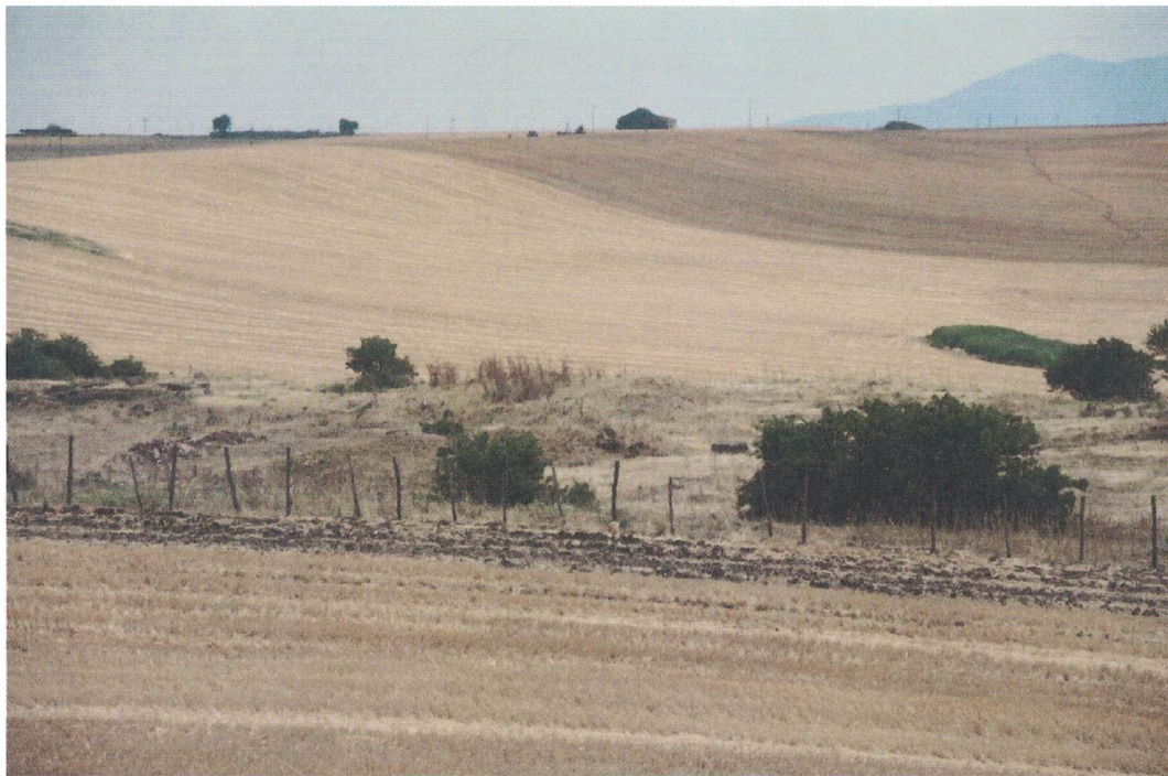
Punto di presa 3 – Installazione WTG10

DIREZIONE GENERALE ARCHEOLOGIA BELLE ARTI E PAESAGGIO SERVIZIO V