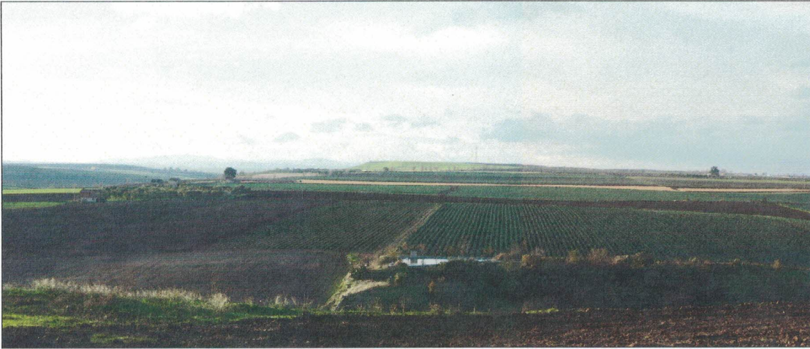
Punto di presa 9 - Masseria Gubito (Ante e Post Operam)

DIREZIONE GENERALE ARCHEOLOGIA BELLE ARTI E PAESAGGIO SERVIZIO V