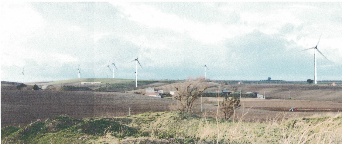
Punto di presa 19 – Masseria Gubito Primo (Post- Operam)