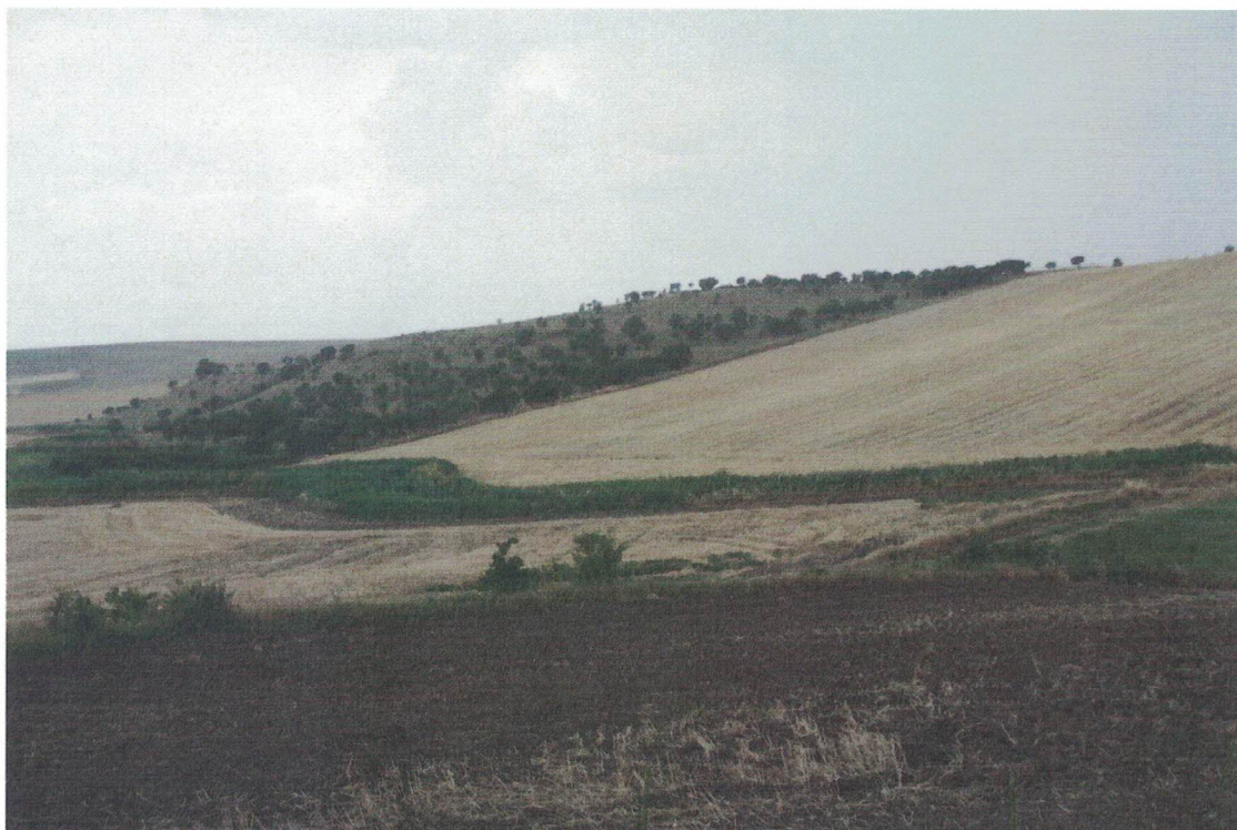
Punto di presa 1 – Da SP97 verso l'impianto (lato sinistro – sopra – e destro – sotto - della panoramica)

DIREZIONE GENERALE ARCHEOLOGIA BELLE ARTI E PAESAGGIO SERVIZIO V