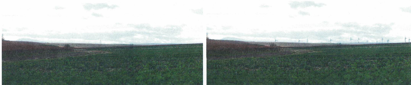
Punto di presa 16 - Posta Ragucci (Ante e Post Operam)

CONSIDERATO e VALUTATO che con riferimento al punto 2 delle Osservazioni del Proponente, le fotosimulazioni contenute nel documento " Appendice 2. Fotomontaggi " mettono in evidenza l'impatto paesaggistico degli aerogeneratori sul contesto (es. punto di presa n. 9 Masseria Gubito; punto di presa n. 11 - masseria Torretta; punto di presa n. 14 posta Capacciotti; punto di presa n. 15 - Posta di Forcone Nord; punto di presa n. 16 - Posta Ragucci; punto di presa n. 18 - I Tre Perazzi; punto di presa n. 19 - Masseria Gubito Primo; punto di presa n. 20 - Torre Alemanna ) e che la parziale schermatura dell'impianto data, in alcuni casi, dalla presenza di alberature interposte tra il punto di presa e l'impianto eolico (cfr. punto di presa 3 - posta Casella; punto di presa 17 - Posta S. Clotilde; punto di presa n. 20 - Torre Alemanna) non può essere considerata quale elemento di riduzione dell'impatto, in quanto la fruizione dinamica dell'area renderebbe comunque visibili anche gli altri aerogeneratori, senza contare che con il mutare delle stagioni verrebbe meno la stessa eguale efficacia schermante. A riprova di quanto sopra, si riportano di seguito le fotosimulazioni prodotte dalla Società nel documento " Appendice 2. Fotomontaggi ".