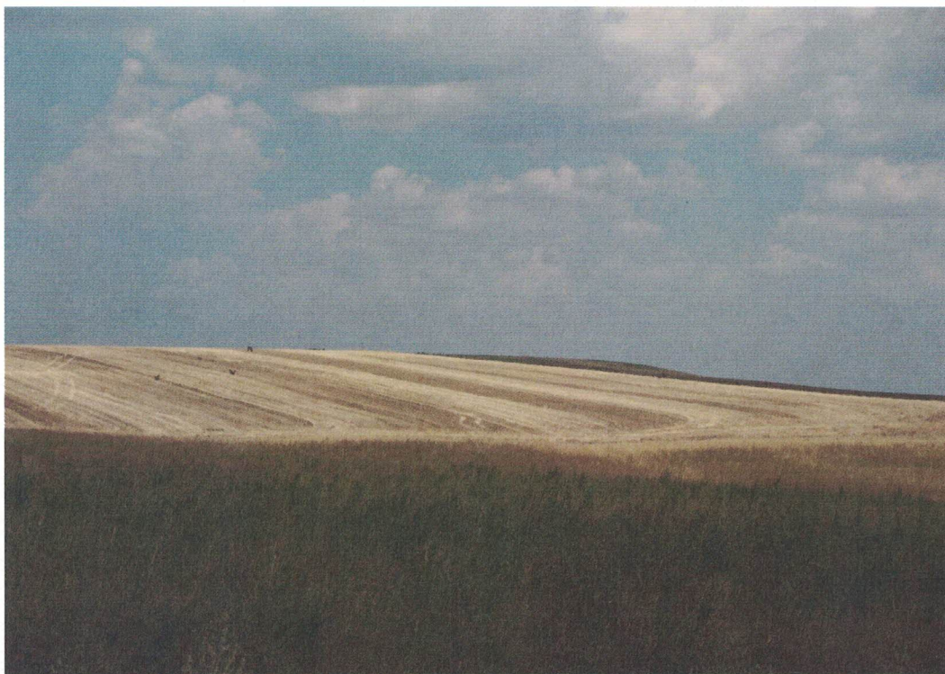
Punto di presa 12 – luogo installazione WTG6