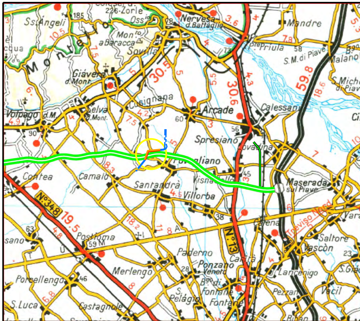
COROGRAFIA Scala 1:100.000