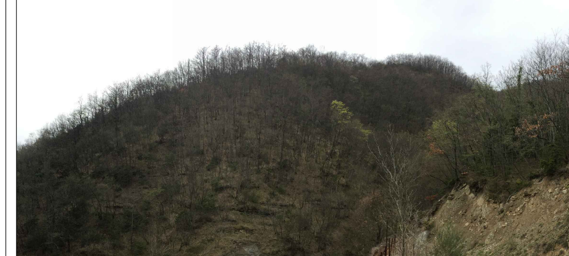
3 - Versante al lato dell'imbocco della Guinza in cui visibile la cresta spoglia e l'acclività del versante