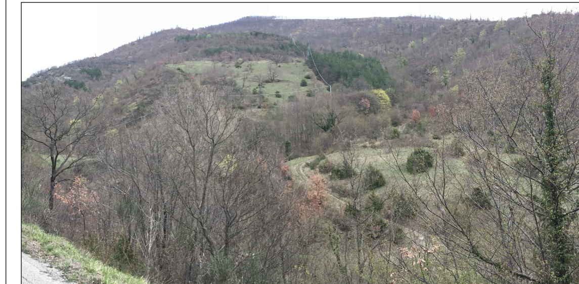
1 - Versante opposto all'area della Guinza in cui risaltano un rimboscimento di pino nero, un'area prativa con presenza di ginepri e al margine della strada sulla scarpata presenza di roverelle e cerri