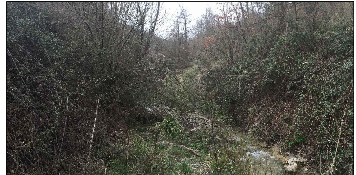
2 - Torrente Lama, si evidenzia l'area ripariale degradata in cui non si ritrovano specie quali salici e pioppi segnalate invece come presenti tra gli habitat del SIC