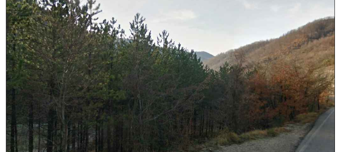
4 - Vista della paratia adiacente l'imbocco della galleria Guinza con sulla sinistra visibile il rimboscimento di pino nero