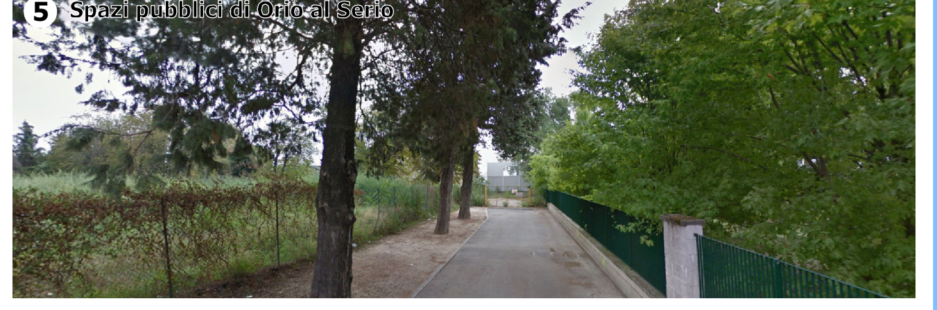
Condizione percettiva parziale (V2) in presenza di vegetazione arborea e manufatti