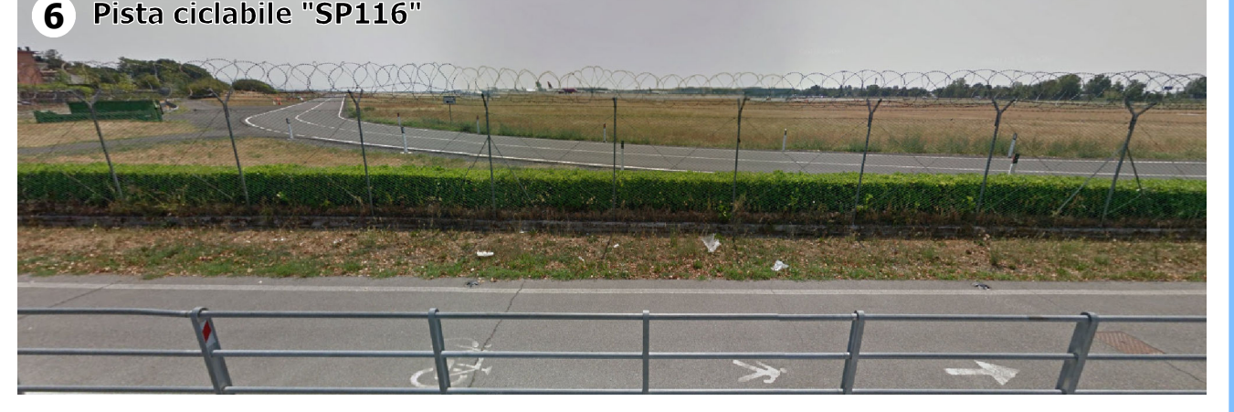
Condizione percettiva possibile (V1) determinata dalla vicinanza intercorrente tra l'ambito e l'area aeroportuale