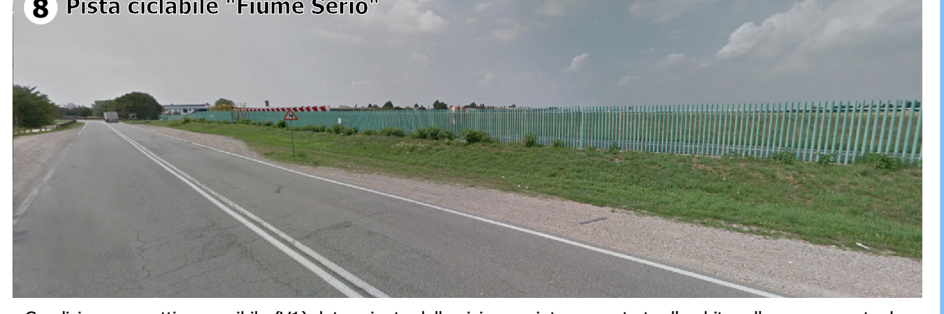
Condizione percettiva possibile (V1) determinata dalla vicinanza intercorrente tra l'ambito e l'area aeroportuale