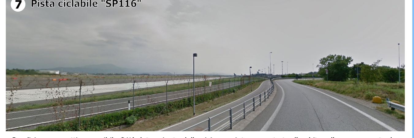
Condizione percettiva possibile (V1) determinata dalla vicinanza intercorrente tra l'ambito e l'area aeroportuale