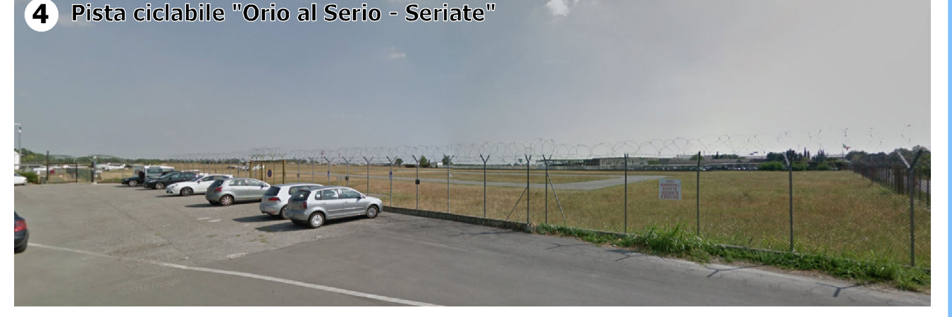
Condizione percettiva possibile (V1) in ragione della vicinanza intercorrente tra l'ambito e l'area aeroportuale