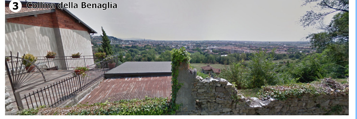
Condizione percettiva impossibile (V3) in ragione della distanza intercorrente tra l'ambito e l'infrastruttura aeroportuale