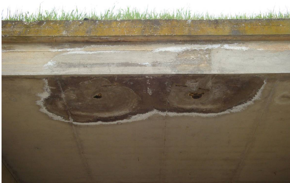
Foto 3 – Particolare infiltrazioni ed efflorescenze sull'intradosso del solettone; dilavamento del cls, del cordolo