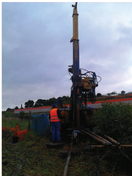
Foto N°1: Postazione sondaggio SG6