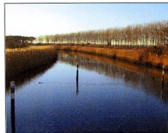
4) FOSSO ADIACENTE A STRADA COMUNALE VIA ISONZATO