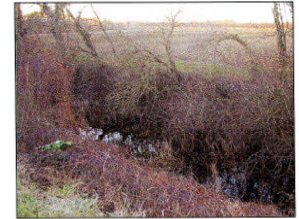
6) CANALE RENZITA