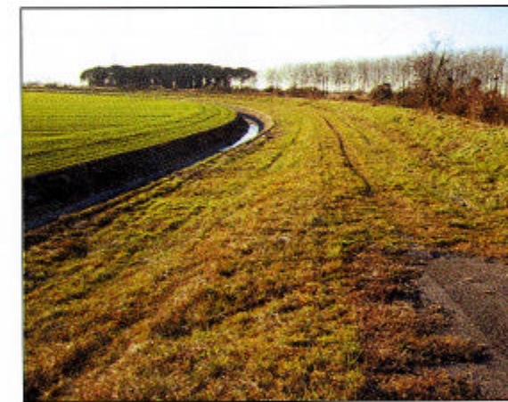
5) CANALE ISONZATO