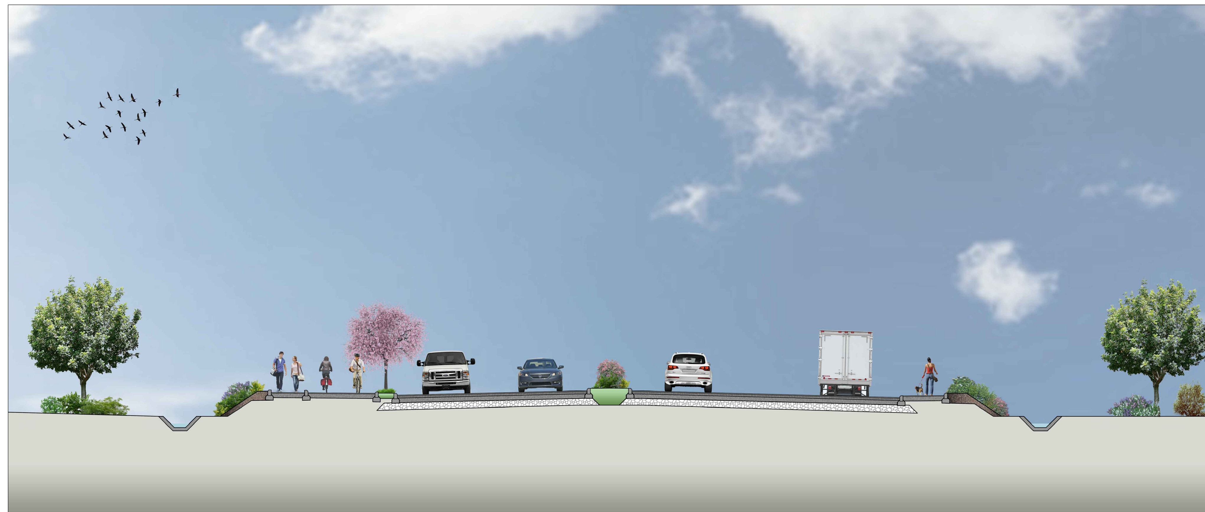
SEZIONE TIPO CIRCONVALLAZIONE ALGHERO - in rilevato con pista ciclopedonale - Cat. D