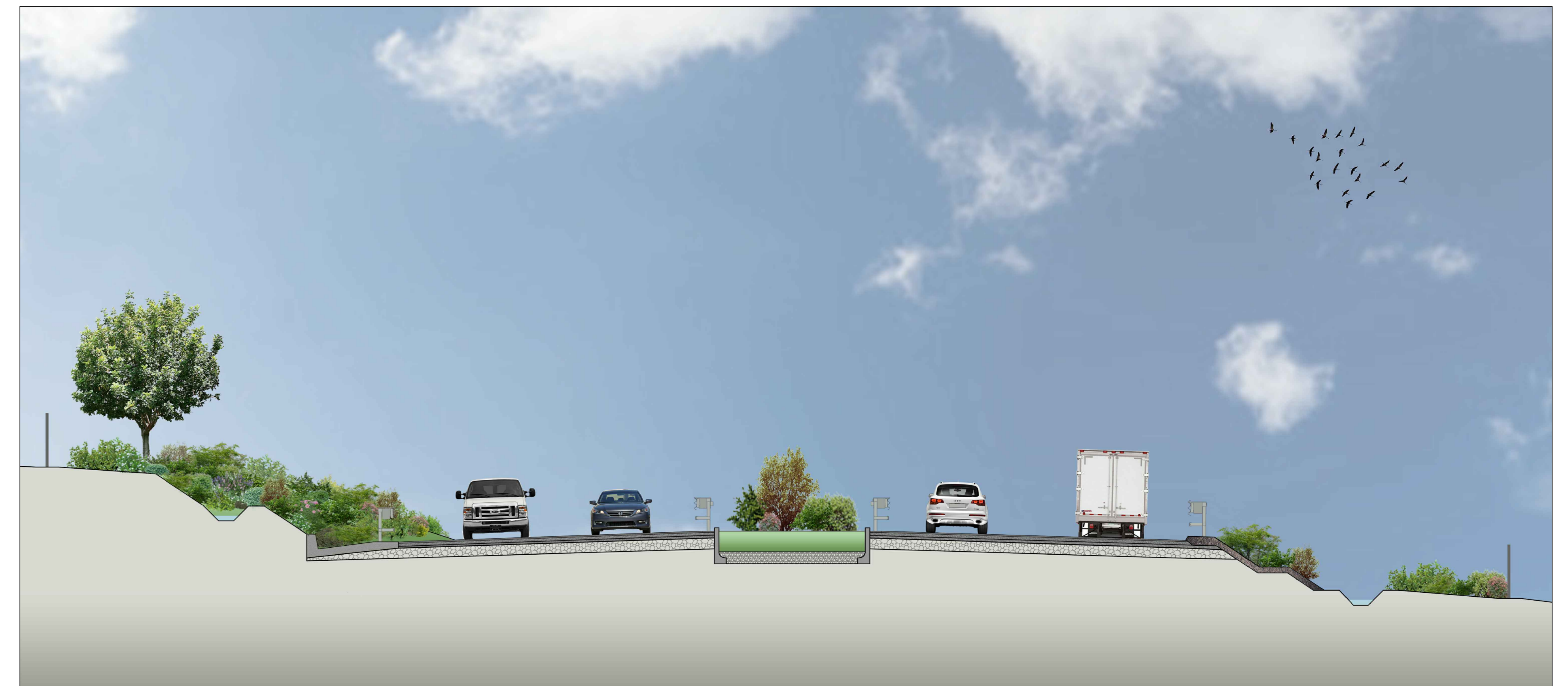
SEZIONE TIPO CON SPARTITRAFFICO RINVERDITO (L. 5m) - Tratto da Svincolo MAMUNTANAS a sottopasso ciclabile SURIGHEDDU