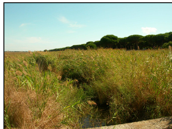
UR 493, panoramica da NE