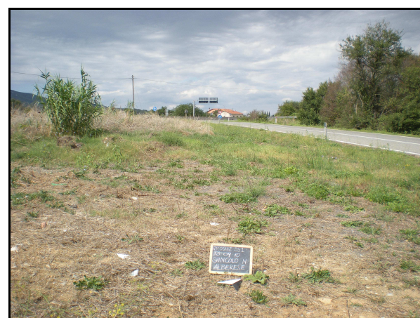
UR 607, da SE