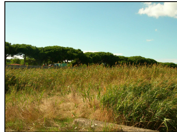
UR 509, panoramica da E