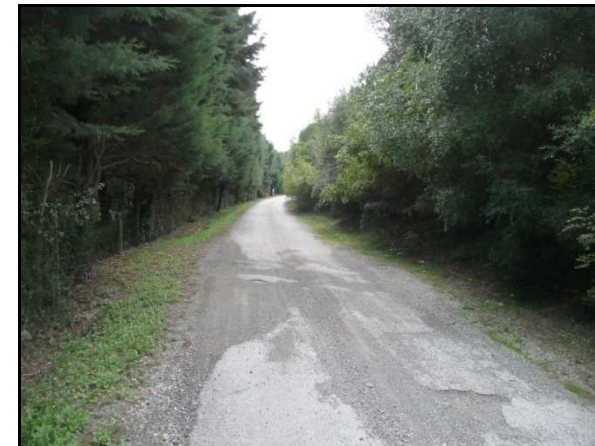
UR 570, da N

I terreni sono inaccessibili perché recintati: a O della strada secondaria collegata con la corsia O dell'Aurelia, ci sono proprietà private incolte; a E ci sono campeggi; mentre alla fine della strada è presente un albergo. A causa dell'inaccessibilità dell'area non è stato possibile verificare le segnalazioni bibliografiche 1494, 884 e 28 . Qui è segnalato un estesissimo vincolo archeologico (cfr. AR 4/4).