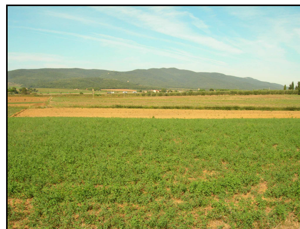
UR 567, panoramica da S

Campo coltivato a erba medica, illeggibile: la verifica dei due dati noti da bibliografia (segnalazioni 15 e 188 ; cfr AR 4/6) e delle cinque zone umide di origine naturale, rilevate attraverso l'analisi delle fotografie aeree, non ha riscontrato alcuna delle segnalazioni indicate.