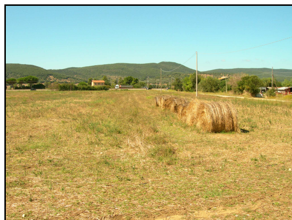
UR 551: il punto in cui è segnalata il cluster SIA 645T