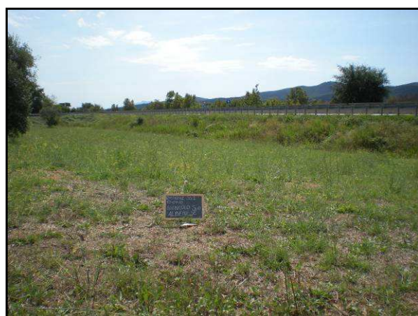
UR 605, da NW

Superficie incolta poco leggibile all'interno dello svincolo di "Alberese".