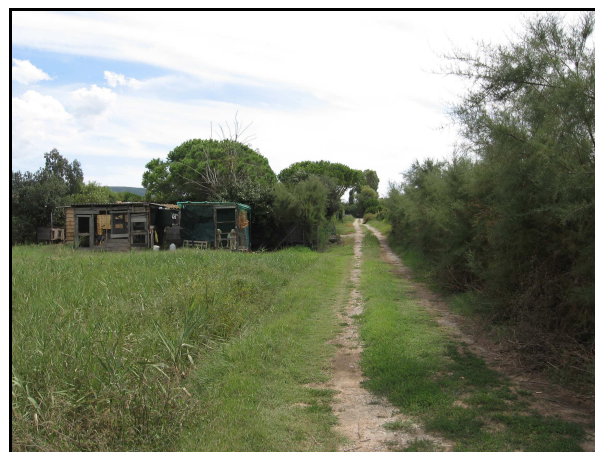
Panoramica delle UR 500, 502, da N

I campi risultano inaccessibili in quanto proprietà private recintate relative verso N ad abitazioni con orti e giardini, mentre verso S si trova un'area protetta del WWF. Su questi terreni insiste un vincolo archeologico areale e un vincolo archeologico puntuale (UR 502) corrispondente all'insediamento di "Casa Brancazzi" e identificato dalla Carta del Rischio come villa rustica romana. Sono segnalati dall'analisi delle fotografie aeree un'anomalia areale di origine naturale interpretata come zona di interesse, due anomalie puntuali di origine naturale interpretate come zone umide, un'anomalia lineare di origine naturale interpretata come traccia di umidità. Inoltre sono indicate le segnalazioni bibliografiche 86 e 1494 (cfr. AR 4/1), non rintracciate data la pessima leggibilità del terreno.