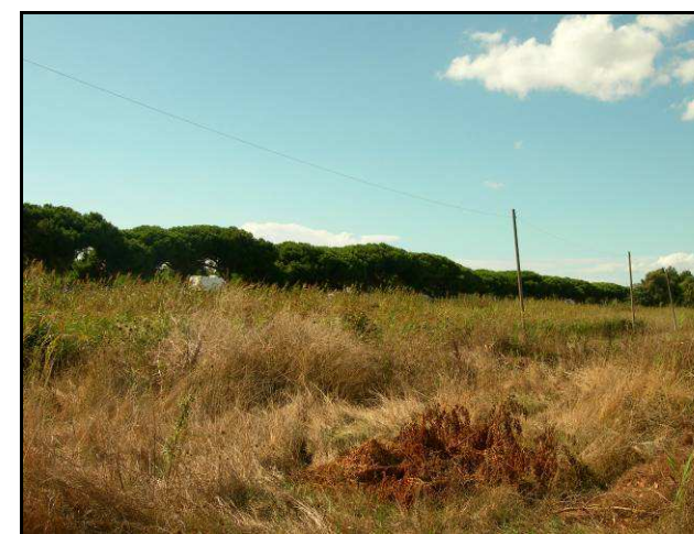
UR 507 da SE; sullo sfondo, dietro gli alberi, è la SS1

Campo incolto, illeggibile: non è stata quindi possibile verificare la presenza in essa della traccia anomala già segnalata per la UR limitrofa (505). Nella UR è segnalata la presenza di una porzione di un esteso vincolo archeologico.