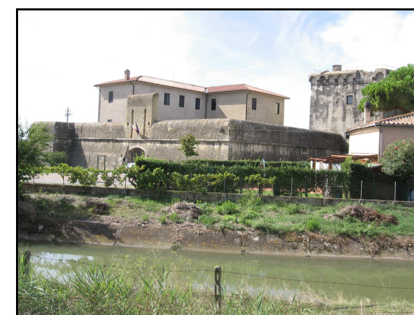
Panoramica dell'UR 522, da NO