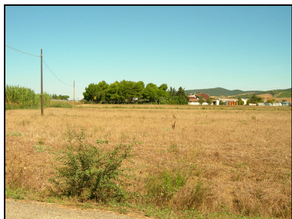
UR 551, panoramica da SE

Campi incolti, illeggibili per la presenza di fitta erba, condizione che ha reso impossibile la identificazione sul terreno dei dati da ricognizione SIA A12 (cfr AR 4/6): 644T (corrispondente alla segnalazione bibliografica 122 ) e 645T nella UR 551; 646T nella UR 557. Per lo stesso motivo non si è potuto procedere alla individuazione nella UR 551 della traccia anomala (interpretata come zona di interesse di origine naturale), riconosciuta attraverso la analisi delle fotografie aeree.