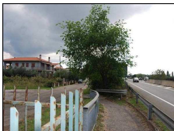
UR 459, da N

Area urbanizzata nel territorio di Albinia (Gr), occupata da edifici, aree asfaltate: inaccessibile.