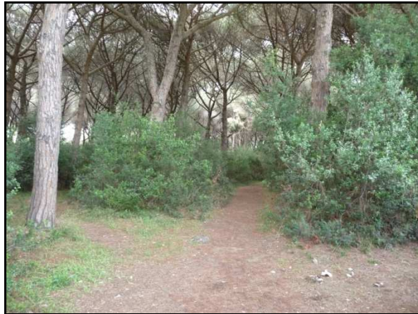
UR 562, da S

La pineta (Parco della Maremma) è illeggibile perché la superficie del terreno è ricoperta da un fitto tappeto di aghi di pino. Forse per tale motivo non è possibile riconoscere le segnalazioni bibliografiche 29, 116, 119 e 120 (cfr. AR 4/4).