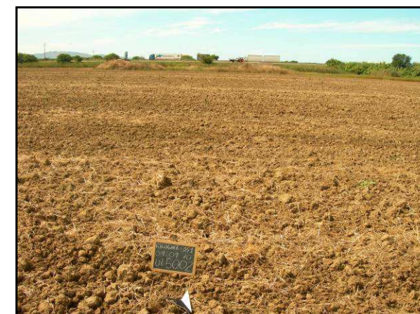
UR 473, campo arato in cui è stato individuato il sito 5002