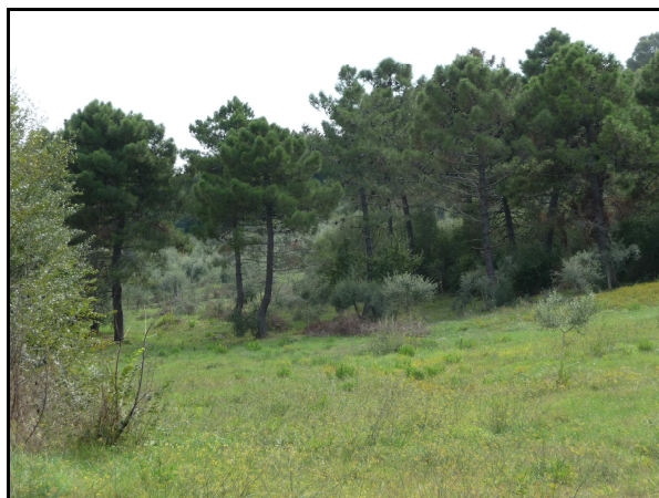
UR 576, da N

Il campo è illeggibile perché, oltre alla presenza di qualche ulivo, la vegetazione in superficie è fitta, alta ca. 50 cm e non permette di vedere il terreno. Forse per tale motivo non è stato possibile riconoscere l'anomalia di origine antropica individuata dall'analisi delle fotografie aeree (zona con scavi). Qui è presente un estesissimo vincolo archeologico.