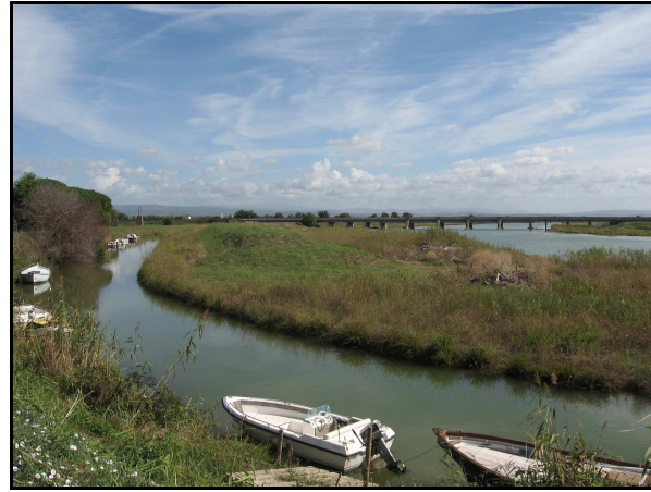
Panoramica delle UR 524, 526, 528, 530, da S

I campi sono illeggibili perché incolti, in quanto costituiscono gli argini dell'Albegna. Nonostante ciò è stato possibile individuare il sito 8004 . Il vincolo puntuale nell'UR 524 non corrisponde a nulla. La segnalazione bibliografica 1613 , relativa a un forte di cui non si trova traccia è invece da riferire al "Forte Saline" presente nell'UR 522 e la segnalazione bibliografica 1494 , relativa al tracciato ipotetico della via Aurelia Vetus , non è stata riscontrata.