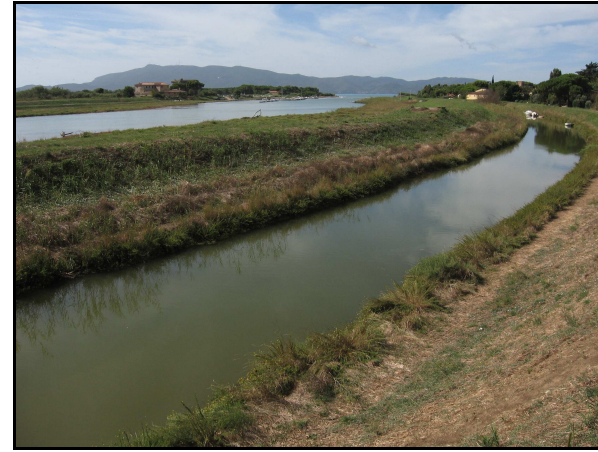
Panoramica delle UR 524, 526, 528, 530, da N