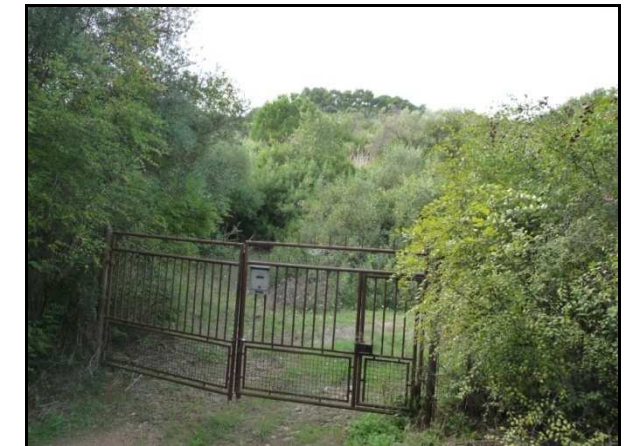
UR 570, da E