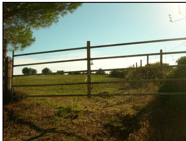
UR 515: proprietà recintata, inaccessibile

Superficie incolta e illeggibile, all'interno dell'area dello svincolo della SS1 Aurelia "Talamone", "Fonteblanda".