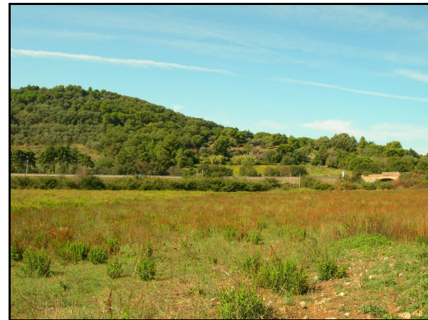
UR 511, panoramica da E

Aree inaccessibili, per la presenza di proprietà private alternate a fitta boscaglia e terreni incolti impercorribili. L'impraticabilità di questi terreni ha impedito il controllo, nel corso della ricognizione, dei dati già noti per questa area: le segnalazioni bibliografiche 1211 e 1494 (UR 509; cfr AR 4/4), 883 (UR 509, 513; cfr AR 4/4), 6 (UR 509; cfr AR 4/5), 1212 (UR 515; cfr AR 4/5), 1214 (UR 515), le anomalie aeree (una zona di interesse di origine naturale, quattro zone con scavi di origine antropica, interpretate come probabili cave; una traccia di origine naturale nella UR 509; una traccia e una zona umida entrambe di origine naturale nella UR 515). In tutta l'area descritta, con l'eccezione della UR 515, ricade un esteso vincolo archeologico, posto evidentemente a tutela delle evidenze archeologiche segnalate, ma ancora non è stata fatta richiesta delle motivazioni che hanno portato alla sua imposizione.