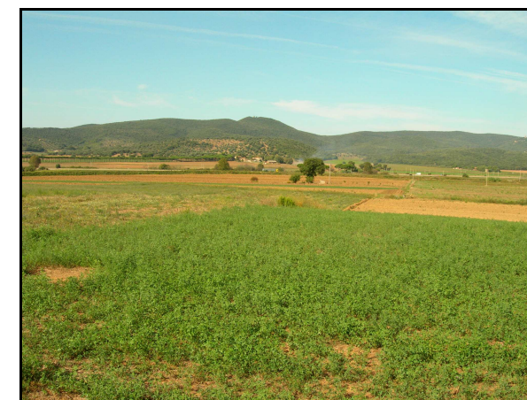
UR 567: punto in cui è indicata la segnalazione bibliografica 15