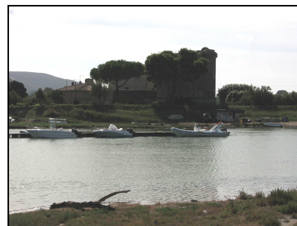
Panoramica dell'UR 522, da NO

Il campo, al cui interno si trova il "Forte Saline", si presenta inaccessibile in quanto recintato. L'edificio e l'area circostante sono sottoposti a vincolo monumentale (confermato dalla Carta del Rischio) e sono attualmente sede di alcuni uffici.