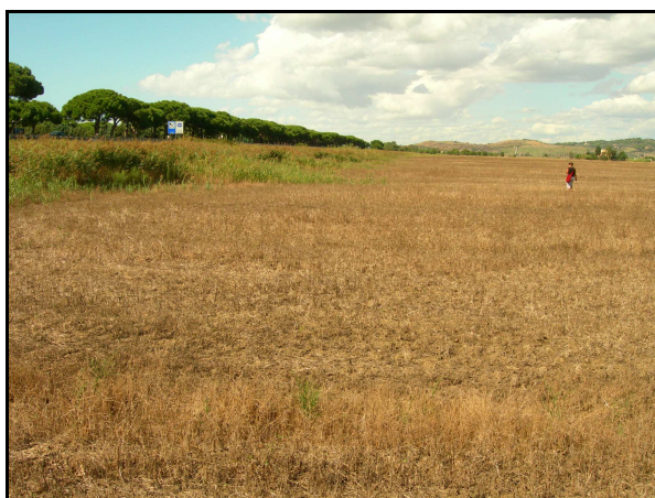
UR 491; sullo sfondo è l'UR 489

Campo incolto di grandi dimensioni, caratterizzato dalla presenza di erba alta e secca. L'illeggibilità del terreno ha impedito il controllo delle segnalazioni bibliografiche 711 e 1494 (cfr. AR 4/3) e delle tre anomalie (zone umide di origine naturale) identificate attraverso l'analisi delle fotografie aeree.