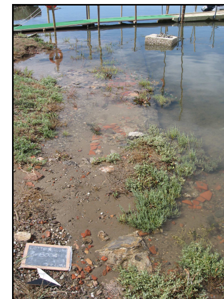
Panoramica del sito 8004, da E