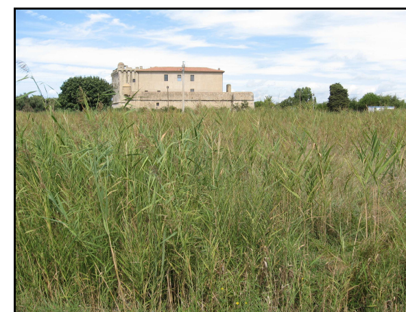
Panoramica dell'UR 522, da SE