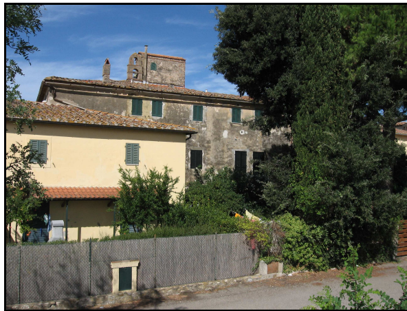
Panoramica dell'UR 532, da E

L'area risulta inaccessibile in quanto proprietà privata recintata relativa alla fattoria di "Casa Breschi", sottoposta a vincolo.