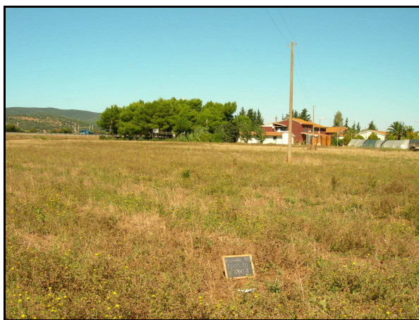
UR 543, da E

Campo incolto, poco leggibile a causa della fitta erba secca tagliata e la ricrescita di nuova vegetazione che ne ricoprono la superficie. Nonostante la scarsa leggibilità del terreno, la ricognizione ha portato all'individuazione del sito 6003 , forse corrispondente alla segnalazione da ricognizione SIA 641T ricadente in questa UR (cfr AR 4/6). Non è stata invece trovata conferma della traccia di umidità di origine naturale rilevata attraverso l'analisi delle fotografie aeree.