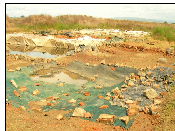
UR 473, Fornaci di Albinia

Campo arato di grandi dimensioni, all'interno del quale è stata verificata la presenza della segnalazione bibliografica 85 (area dello scavo delle fornaci di Albinia; cfr. AR 4/2). Nel terreno circostante le fornaci la ricognizione ha inoltre individuato un ampio spargimento di materiali fittili e ceramici ( sito 5002 ); non è stata invece rilevata la presenza delle tre zone umide segnalate nell'area dalla analisi delle fotografie aeree.