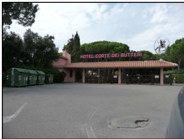
UR 566, da E

I campeggi sono inaccessibili perché recintati e quindi non è stato possibile controllare la segnalazione bibliografica 75 . L'area è interessata dall'estesissimo vincolo archeologico presente in tutta la zona (cfr. AR 4/4).