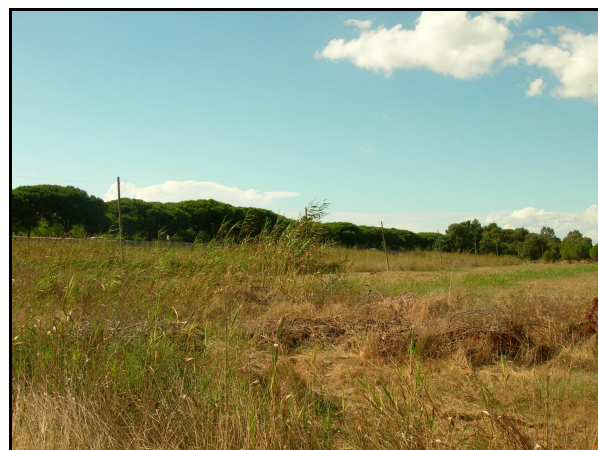
UR 493, panoramica da SE

Campi incolti illeggibili. A causa dell'erba alta e fitta è stato impossibile rintracciare sul terreno le segnalazioni bibliografiche 500 e 1494 (cfr. AR 4/4) nella UR 493 e le tracce anomale individuate attraverso l'analisi delle fotografie aeree (due riconosciute come scavi di origine antropica, due interpretate come zone umide e due come zone di interesse di origine naturale), né è stato possibile comprendere le motivazioni che hanno apportato all'imposizione dell'esteso vincolo archeologico che in parte ricade su queste UR (cfr. AR 4/4).