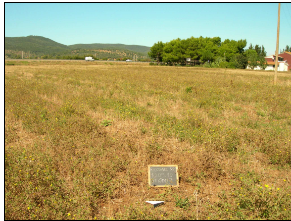
Panoramica del sito 6003 da N

Inoltre l'area in oggetto corrisponde al 614T , ed è localizzata all'interno dell'area di rischio A/R 4/6.