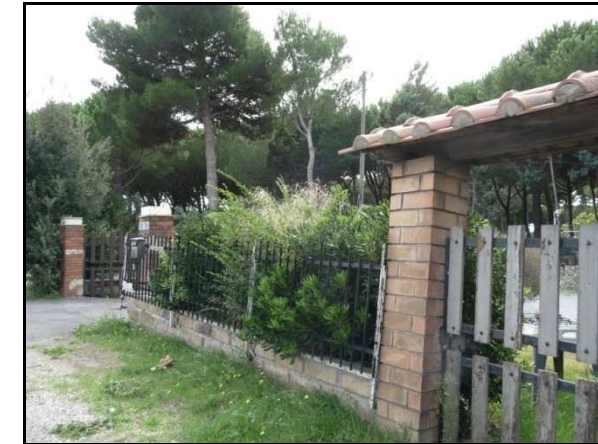
UR 568, da N

L'area residenziale è inaccessibile perché recintata. Per tale motivo non è stato possibile verificare la segnalazione bibliografica 496 . L'UR è parzialmente interessata dall'estesissimo vincolo archeologico presente in tutta la zona (cfr. AR 4/4).