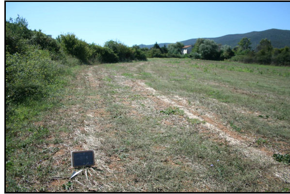
Panoramica del sito 8005, da NO

La ceramica rinvenuta, tutta conservata in pessimo stato, è composta da materiale edilizio (80%) e ceramica vascolare (20%), i cui impasti da un'analisi macroscopica rimandano a un ambito cronologico compreso tra l'età arcaica e l'età repubblicana. Va però sottolineato che è stato anche notato materiale moderno, quindi potrebbe trattarsi di terreno di riporto.