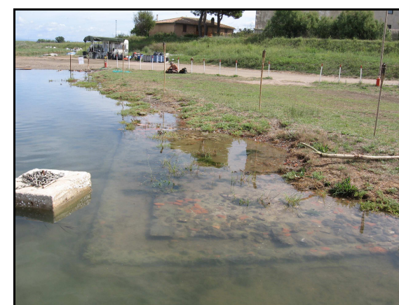
Panoramica del sito 8004, da S