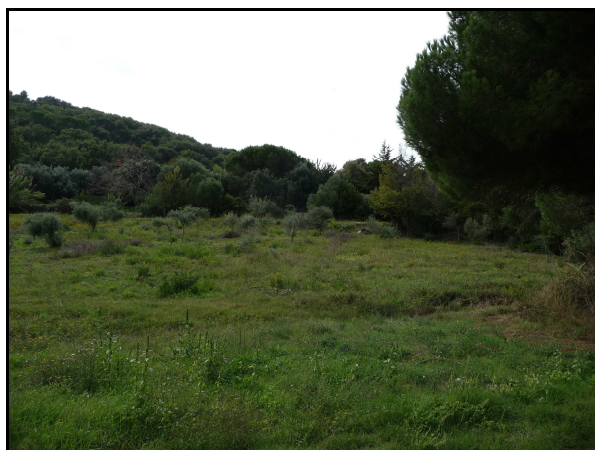
UR 580, da N

L'area è illeggibile in quanto è presente un boschetto con vegetazione molto fitta e rovi. Forse per tale motivo non è possibile riconoscere sul terreno l'anomalia di origine antropica individuata dall'analisi delle fotografie aeree (zona con scavi). Inoltre nell'area è presente un estesissimo vincolo archeologico (cfr. AR 4/4).