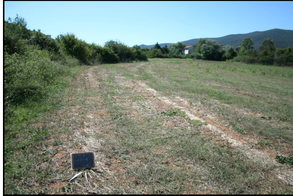
Panoramica delle UR 614 e 616. In primo piano il sito 8005, da NO

I campi si presentano illeggibili in quanto incolti. Tuttavia è stato individuato il nuovo sito 8005 , area di frammenti fittili.