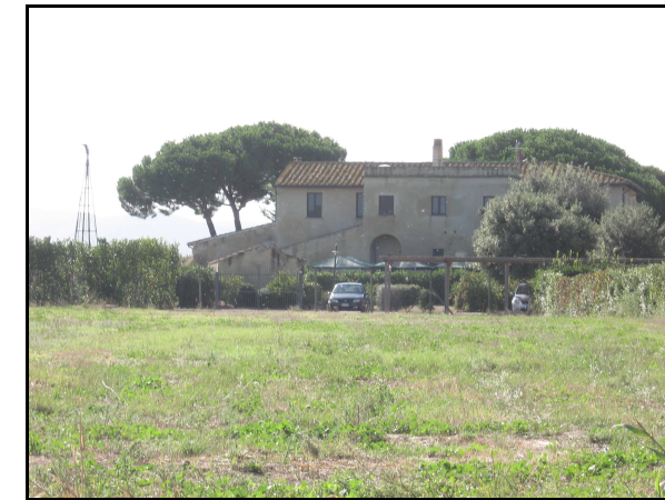
Panoramica dell'UR 544, da N

Il campo si presenta leggibile solo a tratti in quanto incolto. Qui si trova il "Casale Voltoncino", sottoposto a vincolo (cfr. AR 4/3). La scarsa leggibilità del terreno ha impedito l'individuazione della segnalazione bibliografica 1494 , riferibile all'ipotetico tracciato dell' Aurelia Vetus .