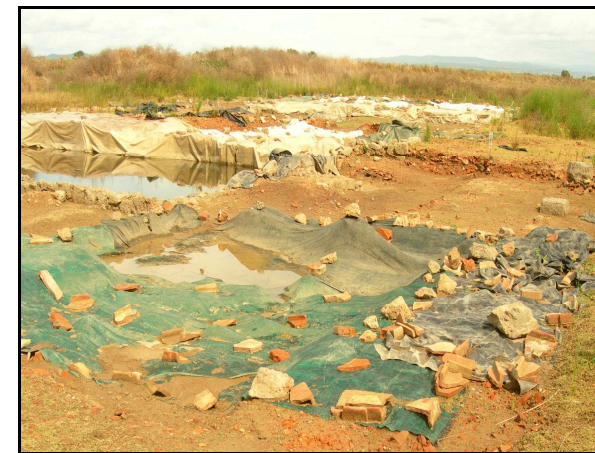
UR 473: Fornaci di Albinia (segnalazione bibl. 85 )

Il sito va interpretato come area di spargimento di materiale fittile riferibile all'attività produttiva delle vicine fornaci.