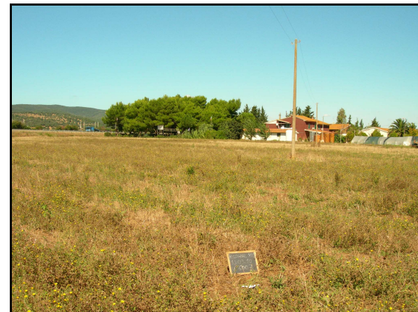
Panoramica de sito 6003 da E