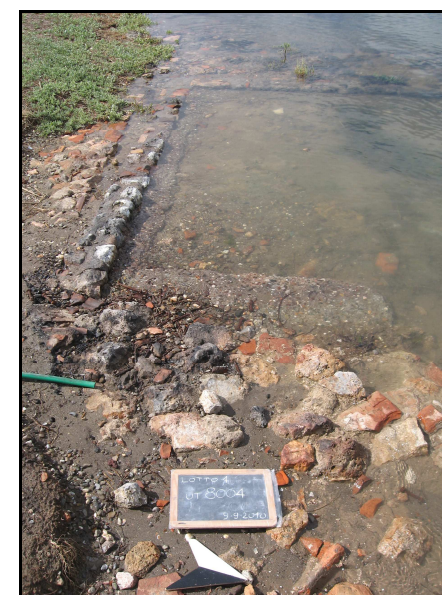
Panoramica del sito 8004, da E

Il sito corrisponde alla segnalazione bibliografica 84 (cfr. AR 4/2).