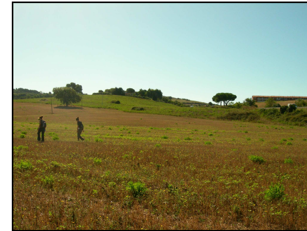
UR 521, in prossimità dell'area di svincolo per Talamone

Campo incolto, illeggibile. La pessima leggibilità del terreno ha impedito l'individuazione della segnalazione bibliografica 1495 , riferibile all'ipotetico tracciato dell' Aemilia Scauri .