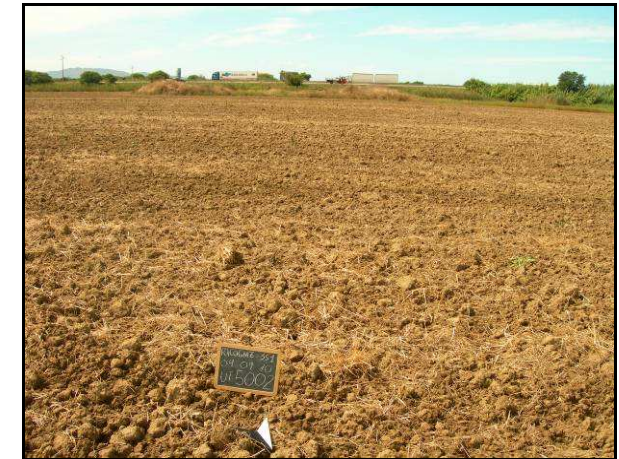
Sito 5002 UR 473, campo arato con spargimento di materiale