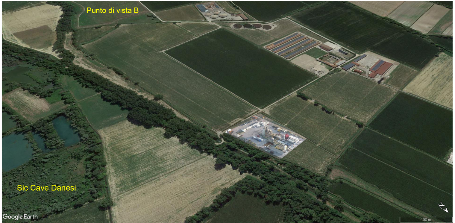
Sic Cave Danesi