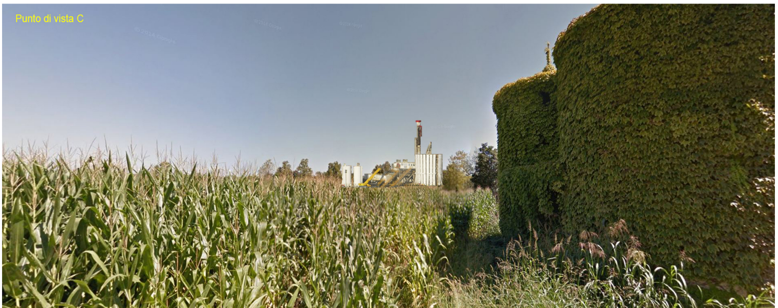
Punto di vista C