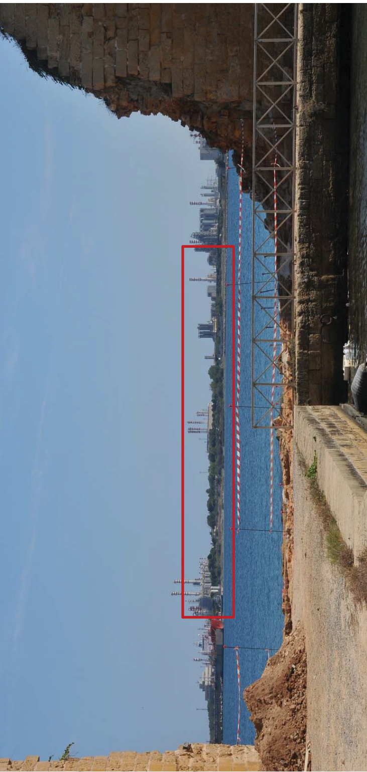
Figura 3. Vista da terra - ante operam