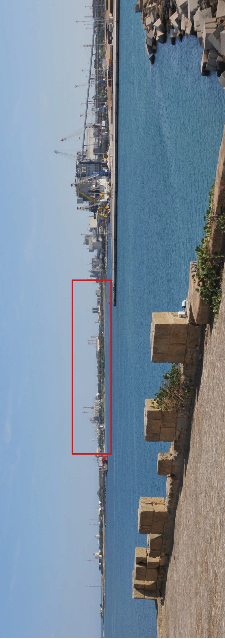
Figura 7. Vista dalla terrazza del castello - ante operam