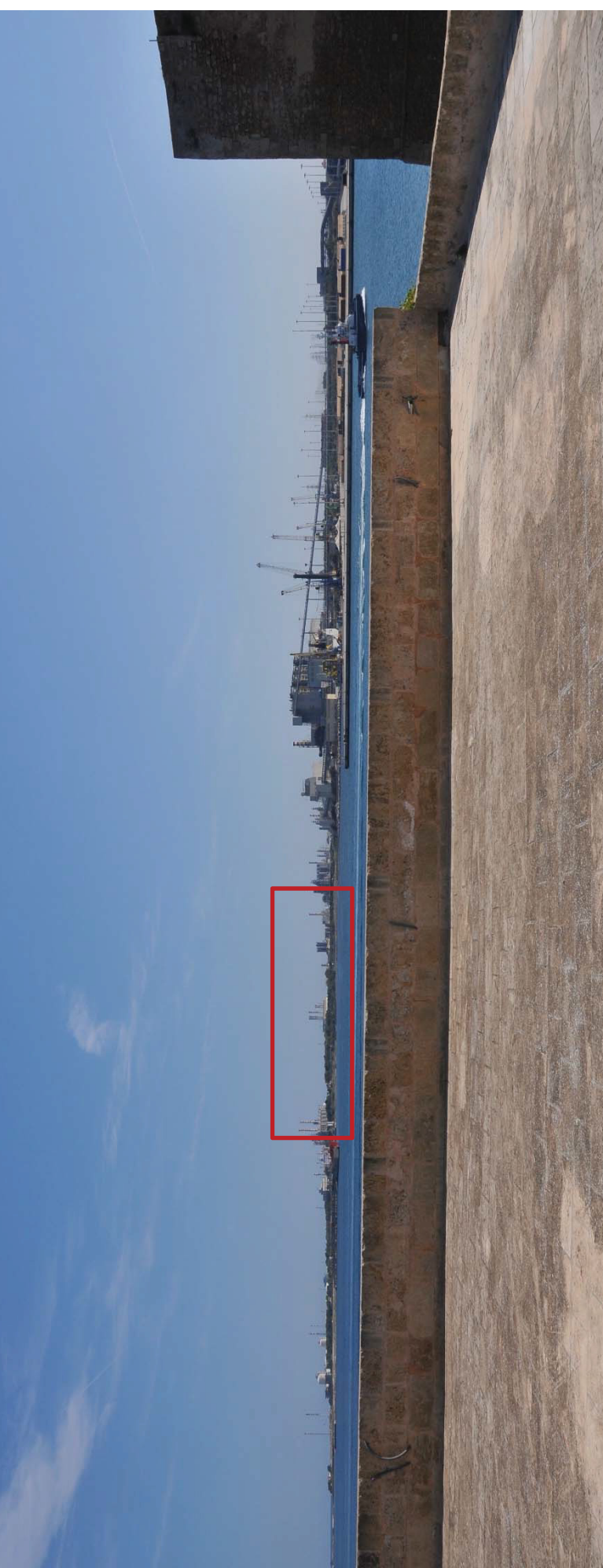
Figura 1. Vista dal camminamento sul bastione - ante operam