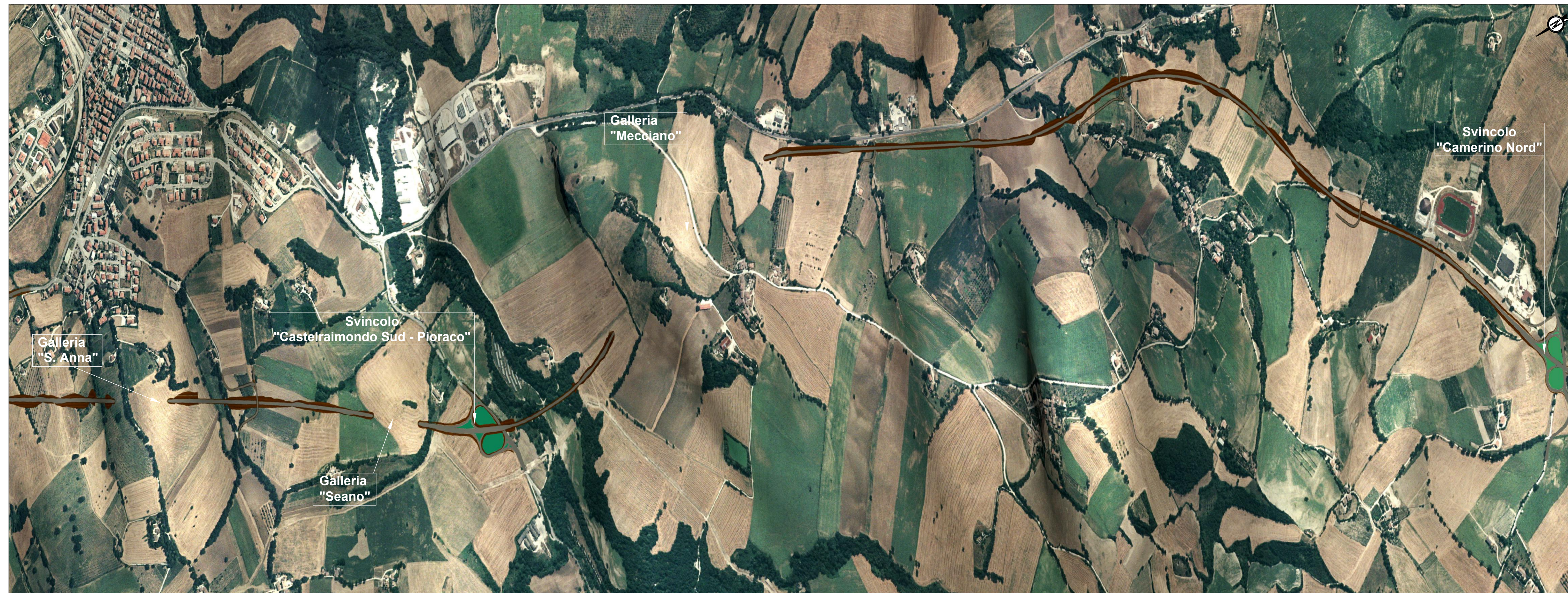
Simulazione su fotomosaico 3D