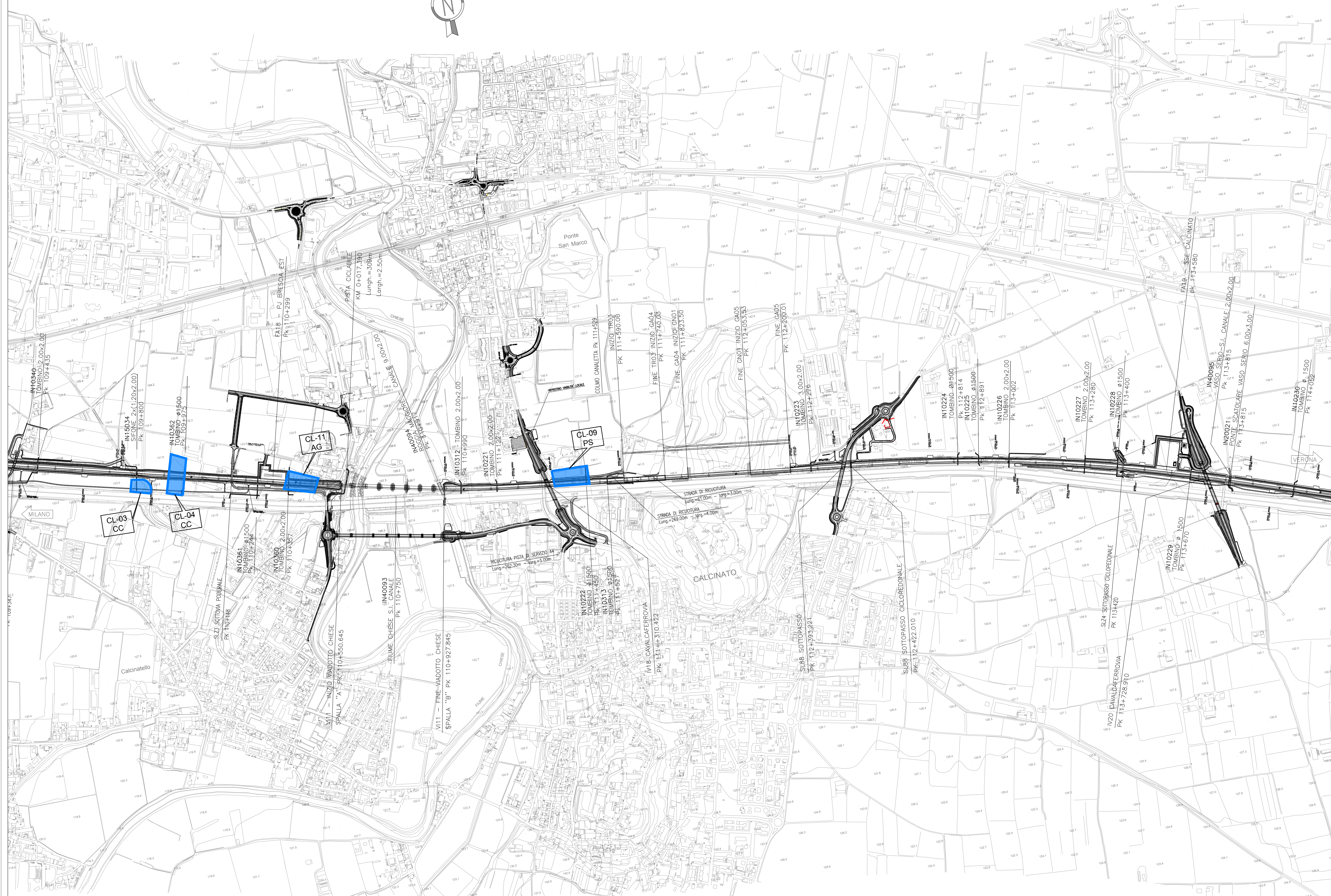
QUADRO DI UNIONE