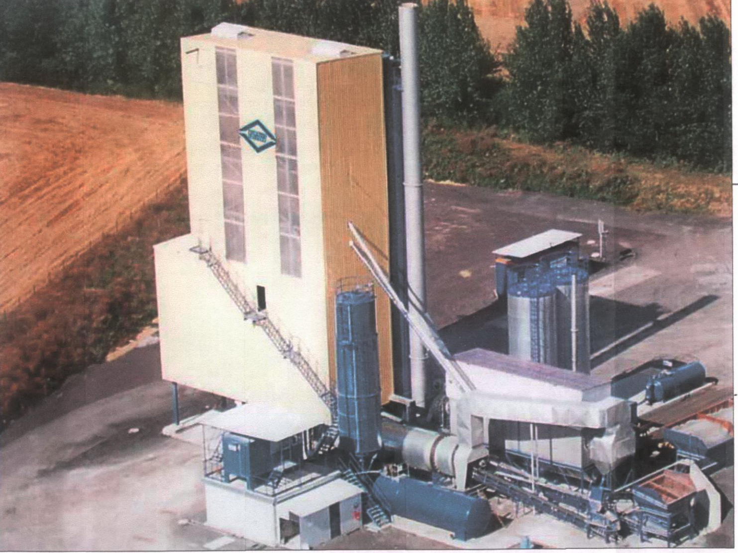
Tipologico impianto di produzione conglomerato cementizio