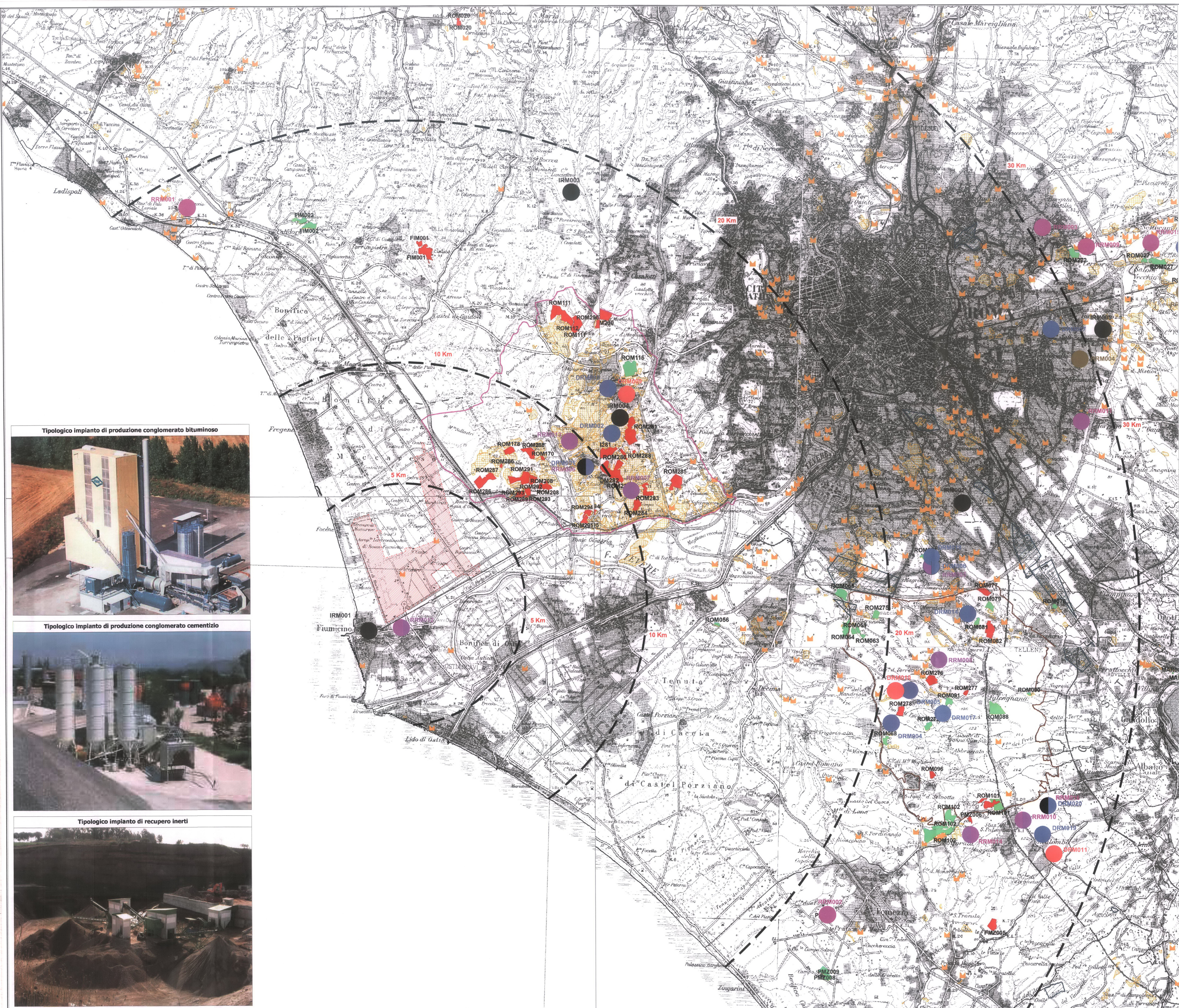
Tipologico impianto di produzione conglomerato bituminoso