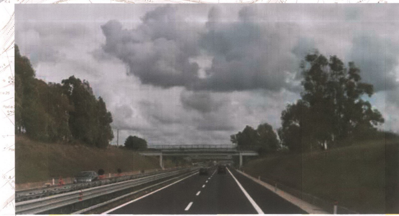
6 Autostrada Roma - Civitavecchia