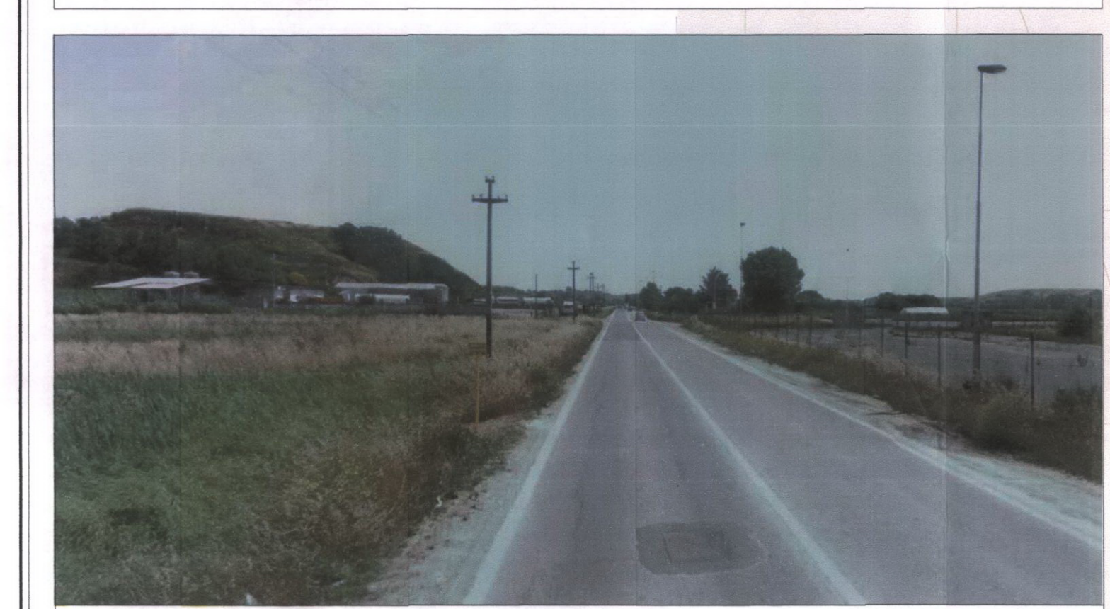
8 Via di Ponte Galeria