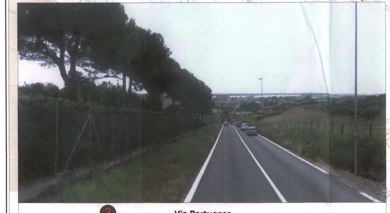
3 Via Portuense