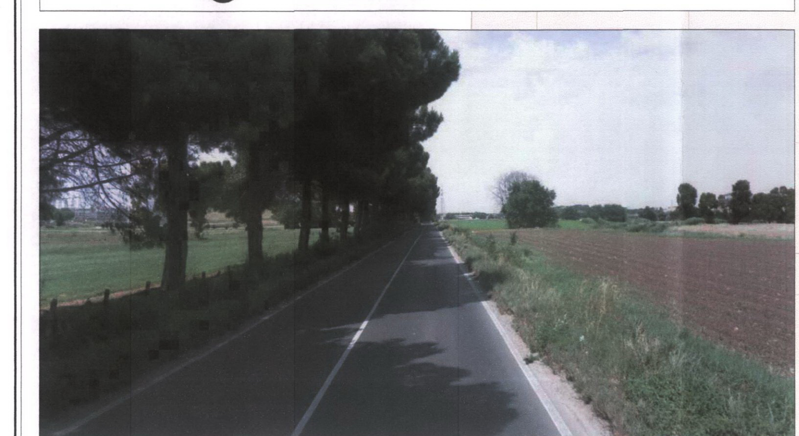
9 Via Malagrotta