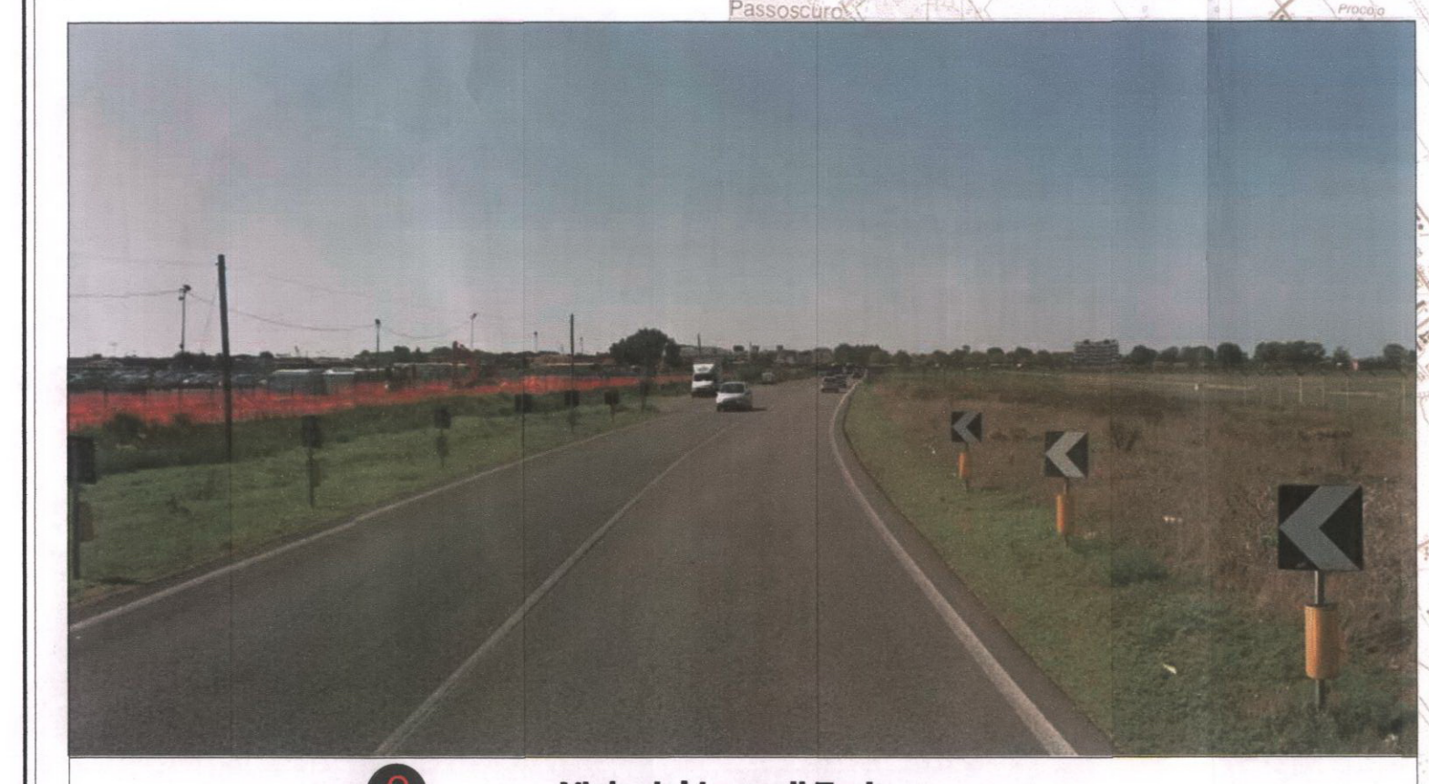
2 Viale del Lago di Traiano