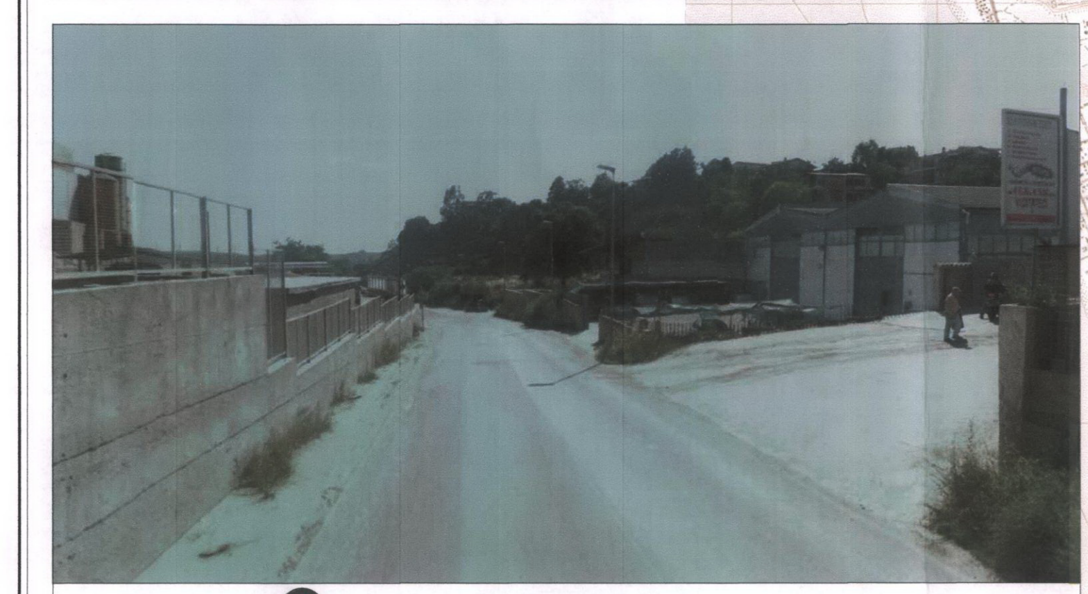
4 Via della Pisana