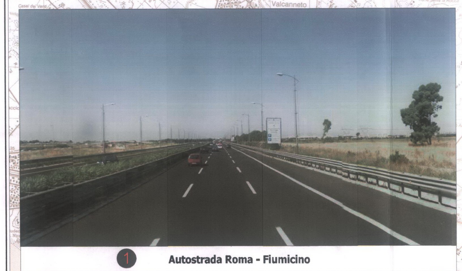
1 Autostrada Roma - Fiumicino