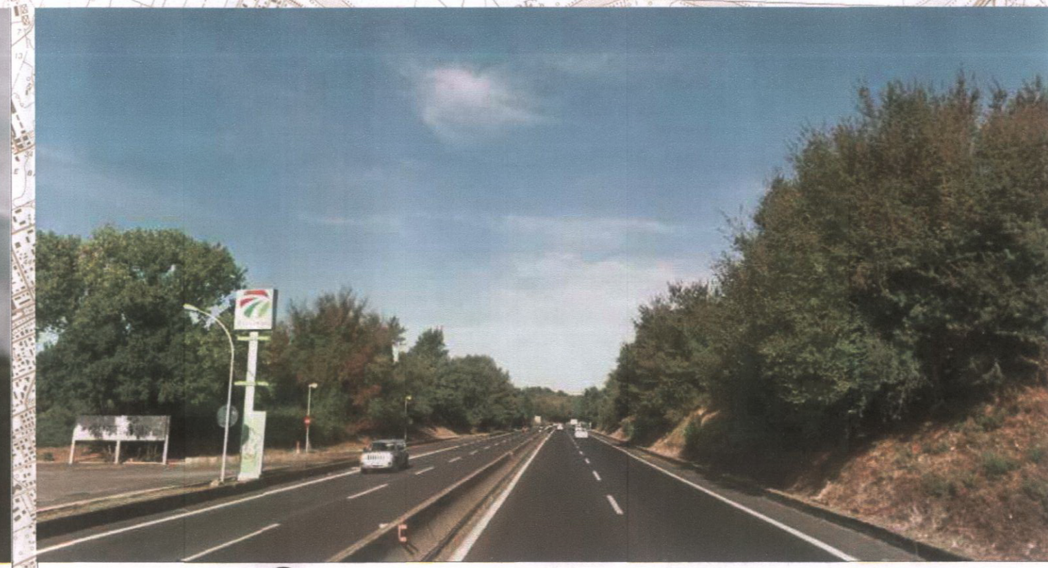
7 Via - Aurelia