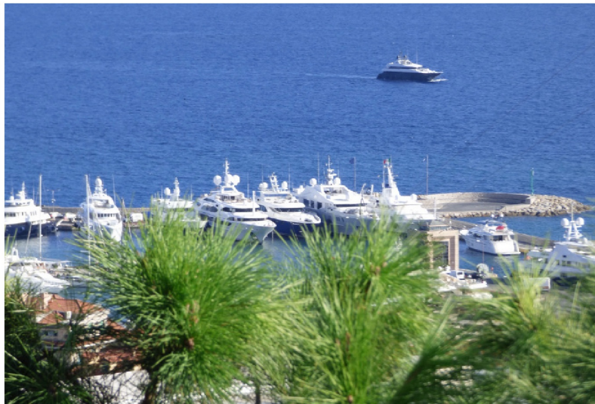
Vista dalla banchina (lato est)