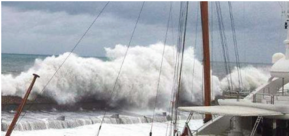
Mareggiata Novembre 2000