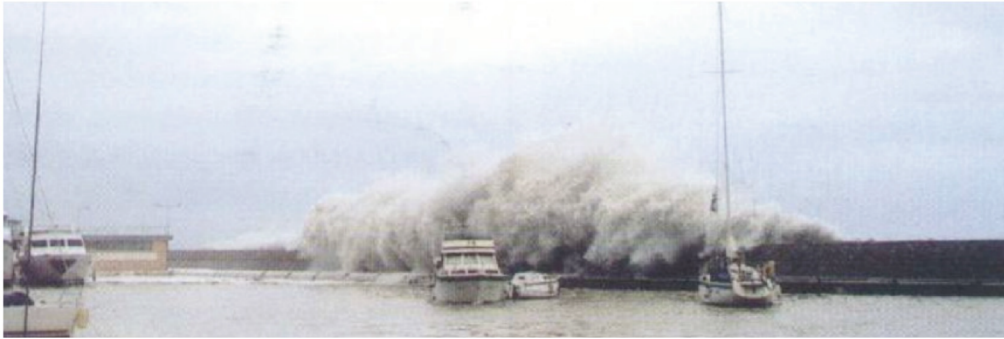
Mareggiata Novembre 2000