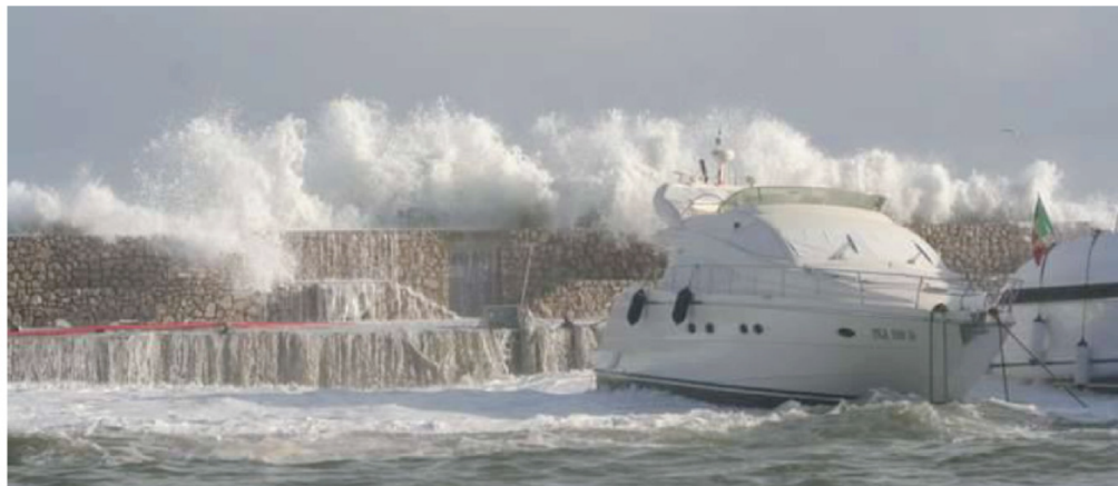
Mareggiata Maggio 2010