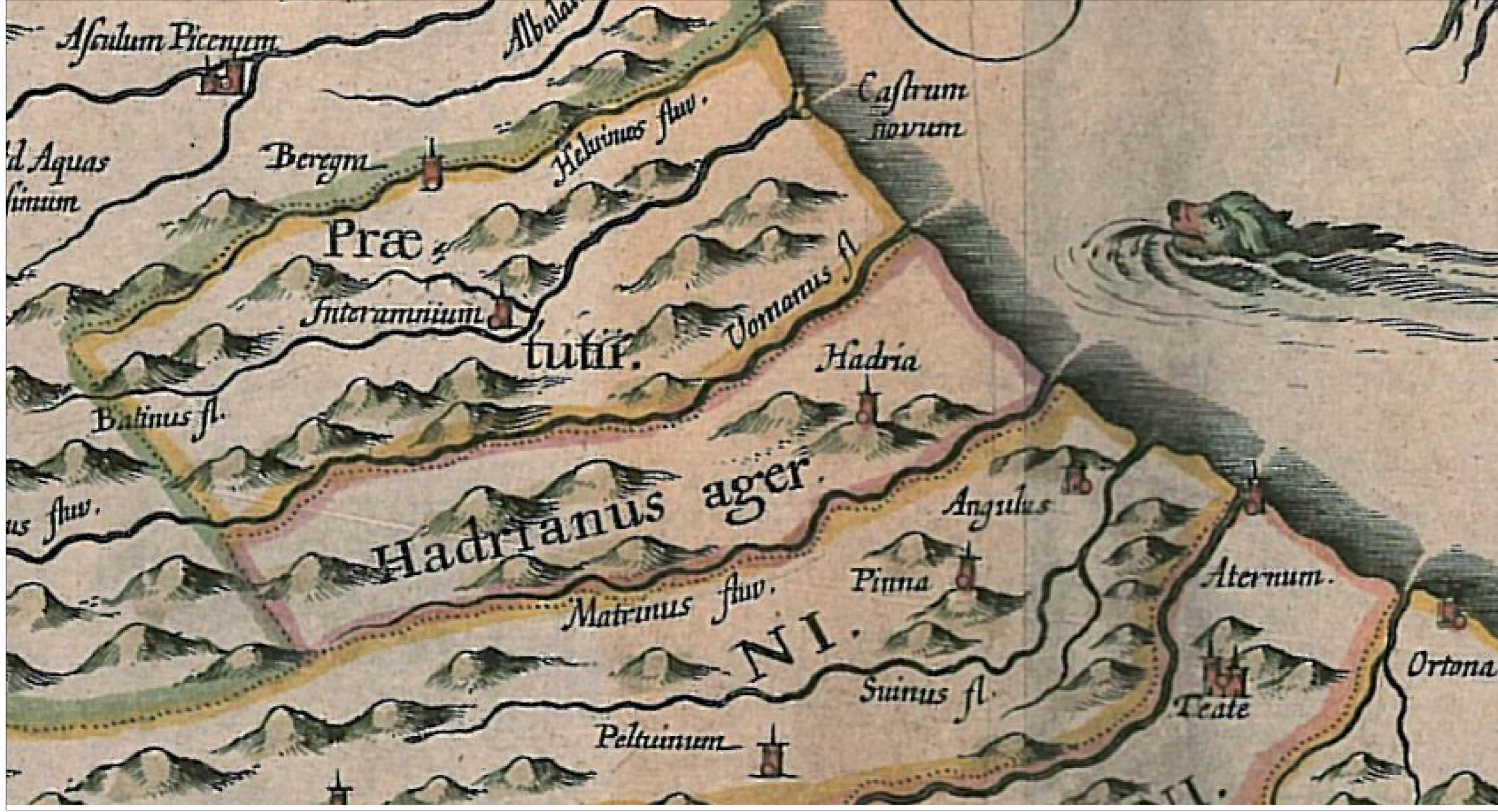
B: Particolare della Valle del Vomano in una carta del 1624 di Philip Clüver