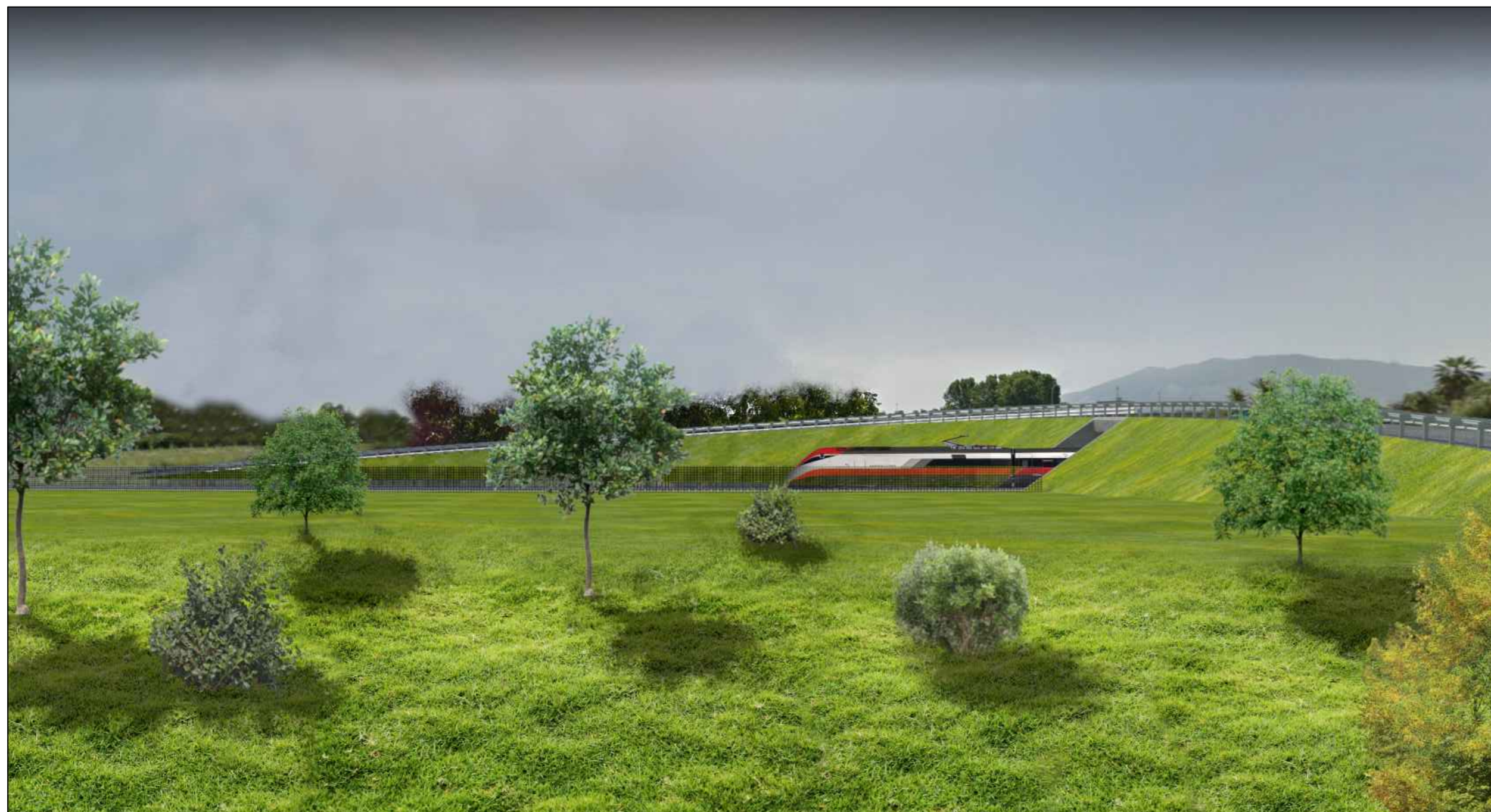
IA06 - Km 10+100 - POST OPERAM