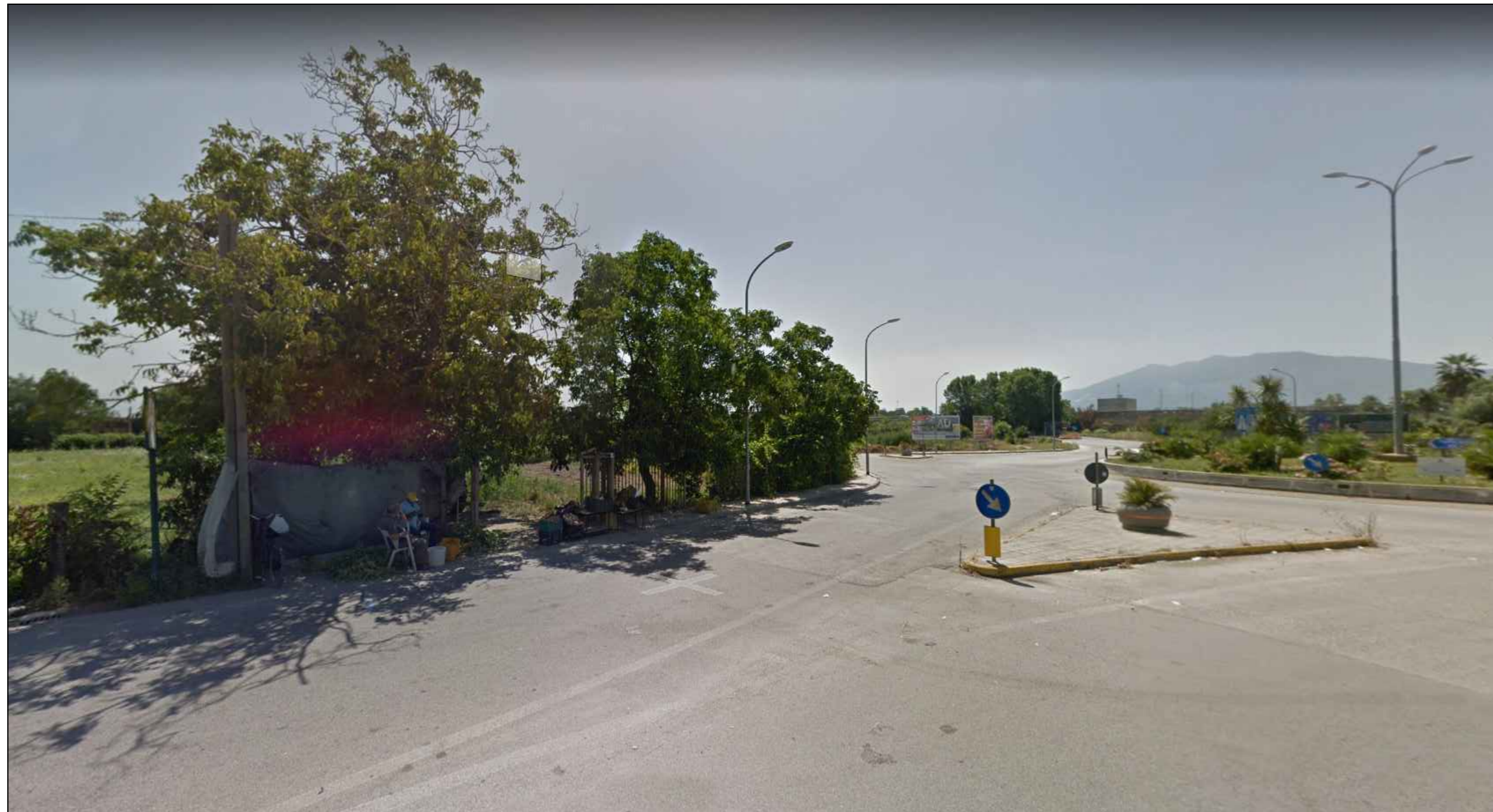
IA06 - Km 10+100 - ANTE OPERAM