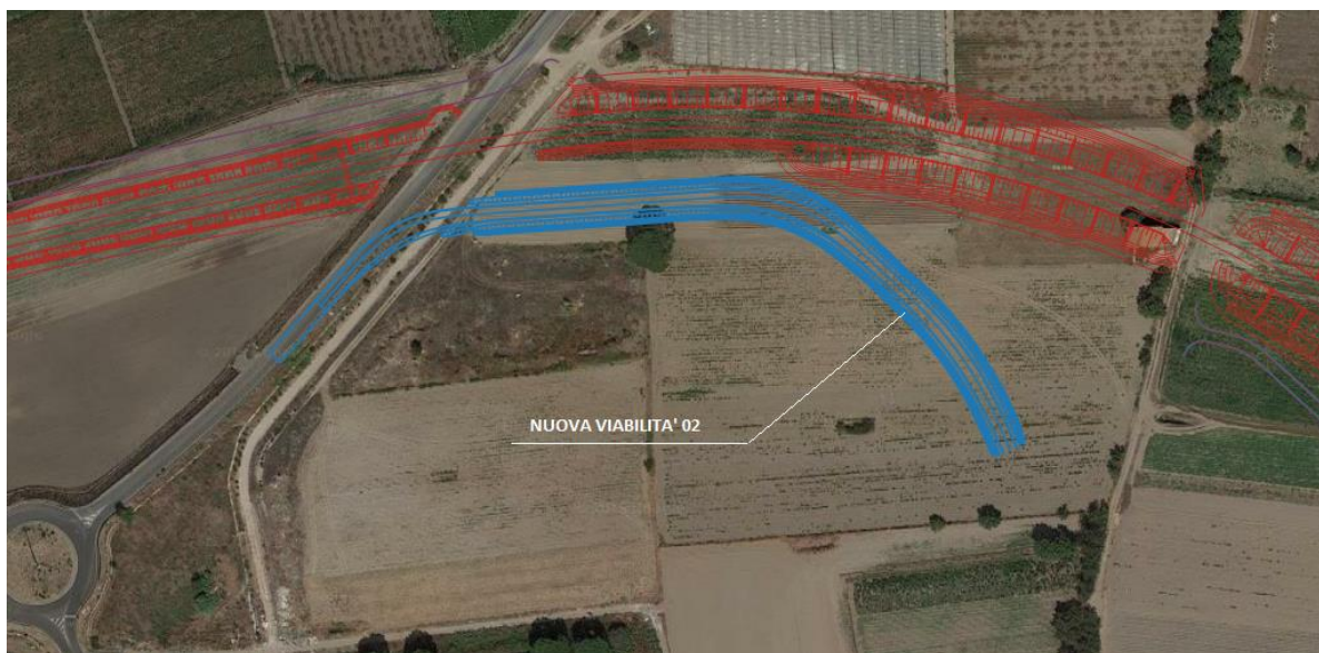
Figura 1: Inquadramento territoriale

Ai sensi del D. Lgs 285/92 e suoi aggiornamenti successivi, in base alle caratteristiche costruttive, tecniche e funzionali, la NV02 è classificata come "Strada Locale a destinazione particolare". Trattasi quindi di strade a carreggiata unica con due corsie e banchine pavimentate.