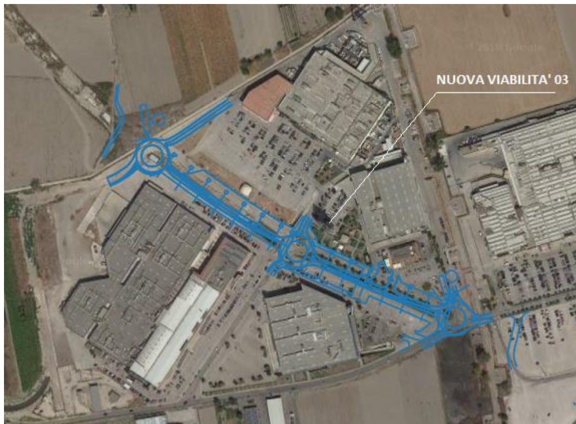
Figura 1: Inquadramento territoriale