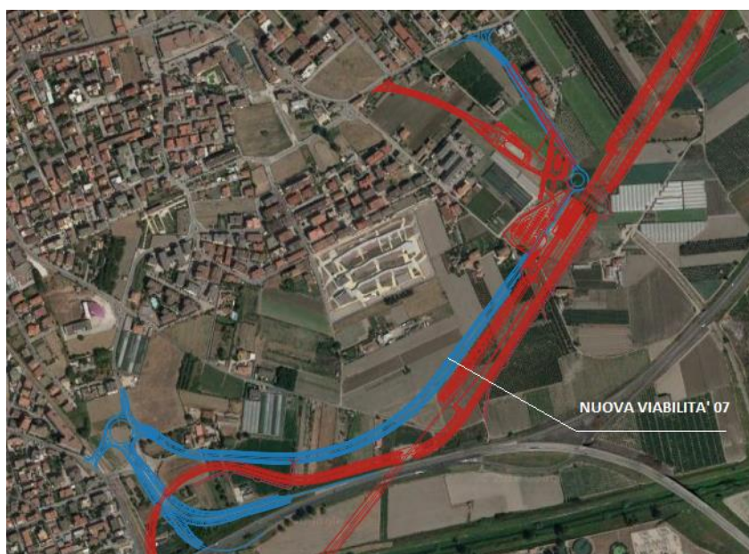
Figura 1: Inquadramento territoriale

Ai sensi del D. Lgs 285/92 e suoi aggiornamenti successivi, in base alle caratteristiche costruttive, tecniche e funzionali, la NV07 è classificata come strada di categoria E (strada urbana di quartiere). Trattasi, dunque, di una strada a carreggiata unica avente una corsia per senso di marcia.