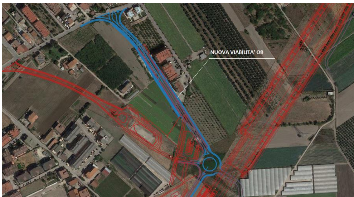
Figura 1: Inquadramento territoriale

La strada è classificata come Strada Urbana di quartiere, di categoria E ai sensi dell'art. 2 del Codice della Strada (D. Lgs. 285/92 e suoi aggiornamenti successivi). Si tratta cioè di strade a carreggiata unica con due corsie e banchine pavimentate.