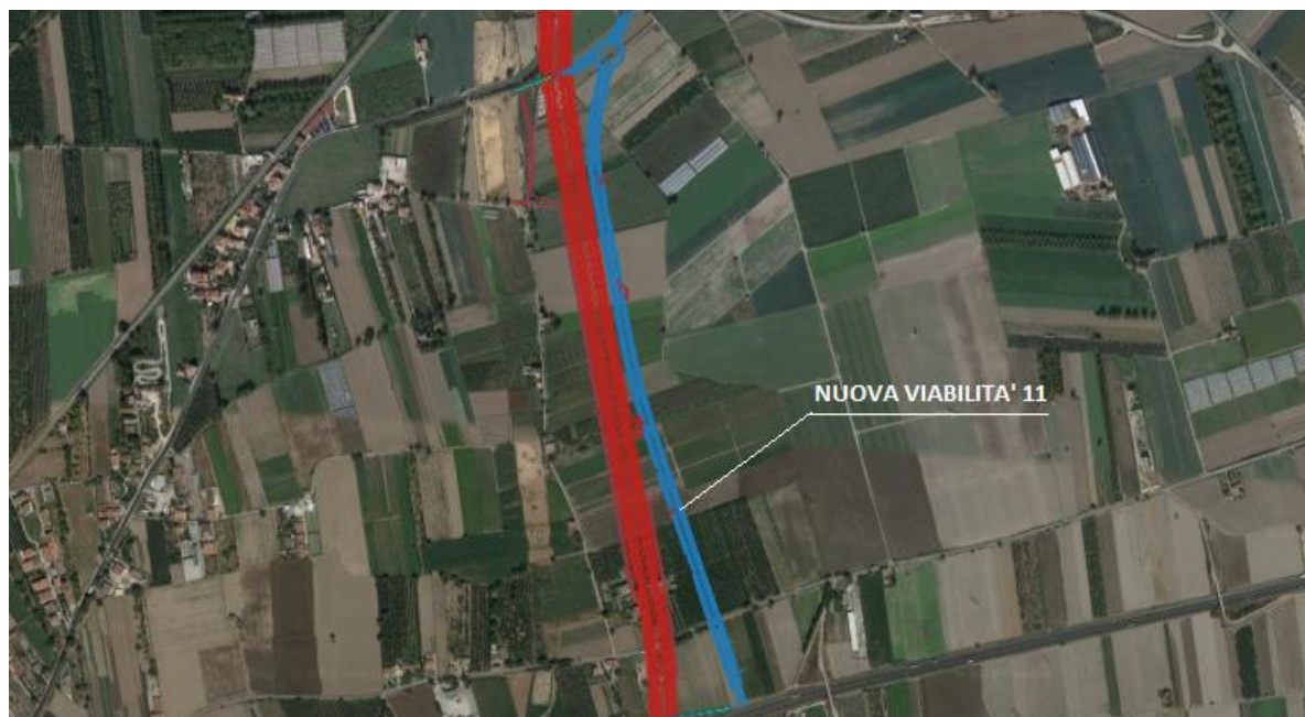
Figura 1: Inquadramento territoriale

La strada è classificata come Strada Urbana di quartiere, di categoria E ai sensi dell'art. 2 del Codice della Strada (D. Lgs. 285/92 e suoi aggiornamenti successivi). Si tratta cioè di strada a carreggiata unica con due corsie e banchine pavimentate.