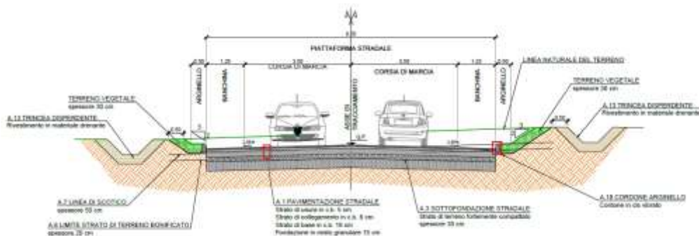
Figura 3: Sezione tipologica in trincea