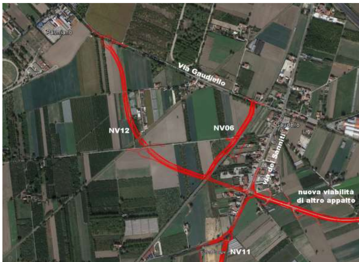
Figura 1: Inquadramento territoriale

La strada è classificata come Strada extraurbana secondaria, di categoria C ai sensi dell'art. 2 del Codice della Strada (D. Lgs. 285/92 e suoi aggiornamenti successivi). Si tratta cioè di strade a carreggiata unica con due corsie e banchine pavimentate.